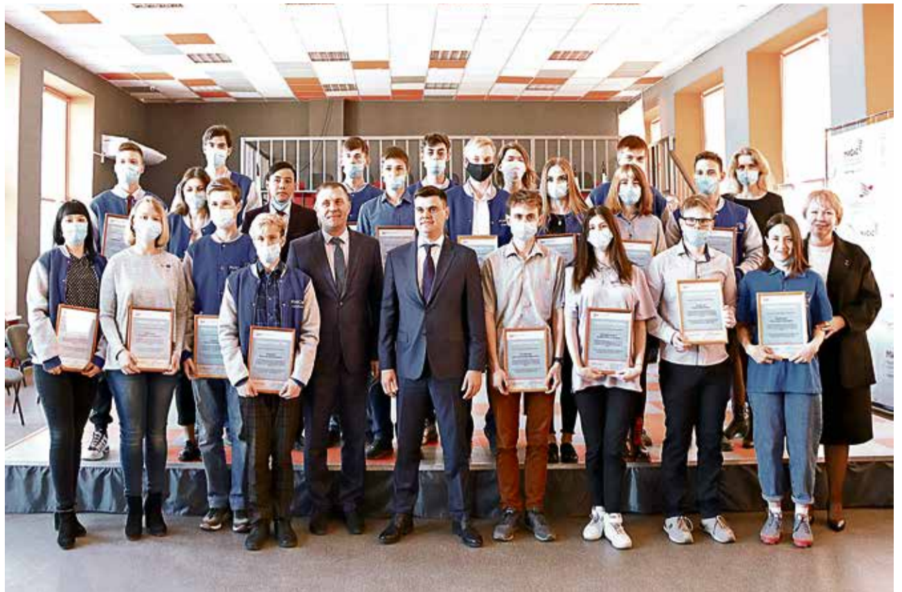
▲ Сотни студентов получили стипендиальные гранты Металлоинвеста за годы действия программы поддержки одарённых учащихся