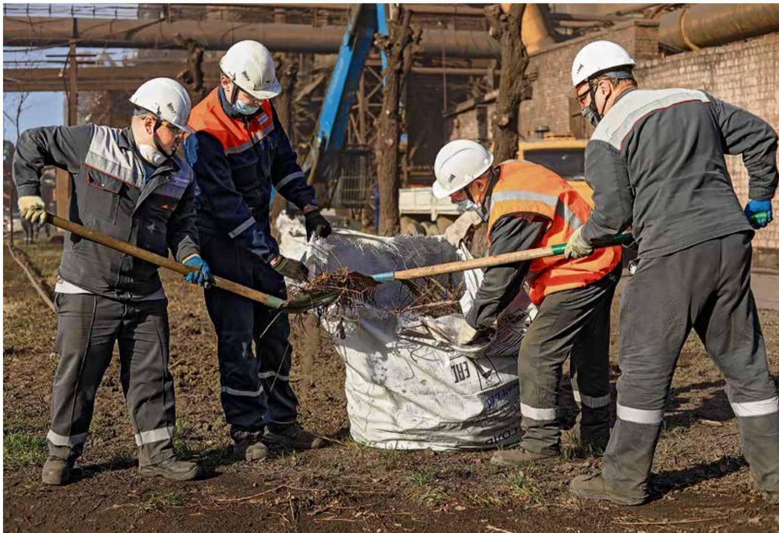
▲ И город, и цеха Уральской Сталы усилиями металлургов к майским праздникам приобретут надлежащий эстетический вид

Побелённые бордюры и вычищенные улицы — в Новотроицке стартовал корпоративный конкурс Metalloinvesta «Наш чистый город — 2021».