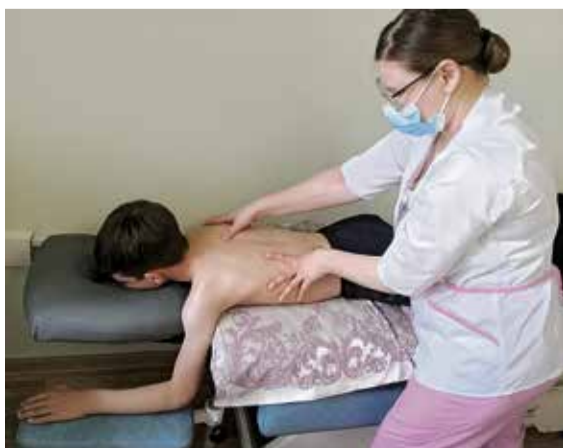
▲ Подготовить мышцы к лечебной физкультуре помогает профессиональный массажист

Отметим, что санаторий-профилакторий «Металлург» осуществляет оздоровление не только детей, но и работников и пенсионеров комбината. В этом году во взрослом отделении санатория получат лечение более тысячи работников и порядка двухсот ветеранов производства. Также работникам комбината в этом году представится возможность оздоровиться в санаториях Черноморского побережья и Кавказа, санаторно-курортным лечением планируется охватить более 300 сотрудников Уральской Стали. В этой связи напомним: чтобы долгожданный отдых не сорвался — нужно серьёзно подойти к вопросам безопасности в период пандемии коронавируса. Один из самых надёжных способов защитить себя и своих близких — вакцинация. Те, кто не планирует отдых с выездом, тоже могут сделать прививку, не покидая рабочего места: для удобства сотрудников она организована в здравпункте АТК Уральской Стали.