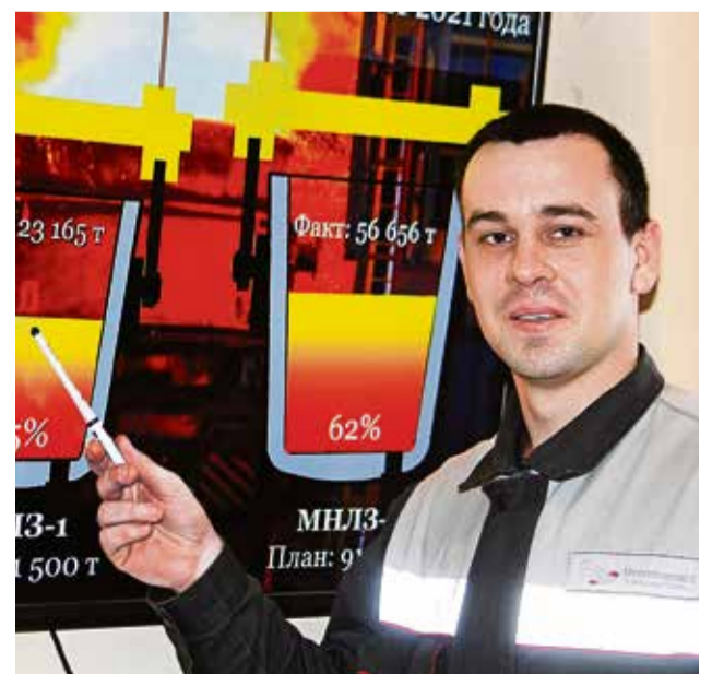
▲ На мониторах административной ячейки сотрудники могут видеть ежедневные результаты работы цеха

— На двух мониторах, установленных в здании АБК и в комнате сменно-встречных собраний, кроме обучающей информации по инструментам БС, статистике по ОТиПБ, показателей премирования сотрудников, отображаются сведения о результатах работы за смену, — поясняет Дмитрий Сергеевич. — Любой работник может ознакомиться с производственными показателями бригады, участка и цеха в целом. Впрочем, другие инструменты БС, при правильном их использовании, тоже приносят пользу. В цехе активно работают пять Досок решения проблем, ещё одного инструмента вовлечения сотрудников в процессы постоянных улучшений условий труда, состояния рабочих мест, качества обслуживания и ремонта оборудования и повышения уровня безопасности производства — большинство из занесённых на доску проблем устраняются в течение семи дней. Так, из 109 зарегистрированных в прошлом году проблем решены 107. Работает Система 5S, позволяющая эффективно организовать своё рабочее место. Особое место занимает Фабрика идей — проект, направленный на повышение эффективности бизнес-процессов. Только за март 2021 года через неё было подано 200 рацпредложений (в том числе и по снижению себестоимости), 177 из которых приняты техсоветом и рекомендованы к внедрению, при том, что за весь прошлый год работники ЭСПЦ подали всего около 700 предложений.