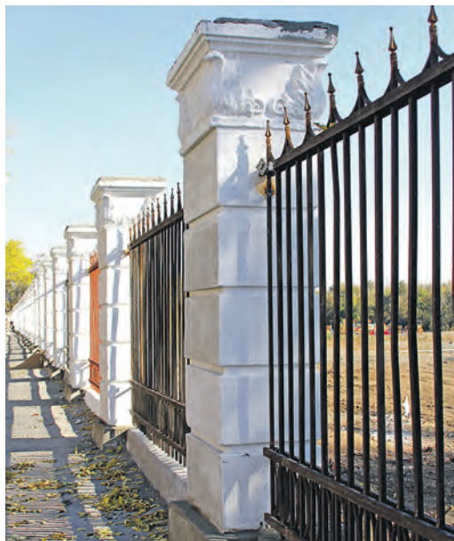
Городской парк получил новую ограду

Важной частью стратегии развития Новотроицка является улучшение качества городской среды. Первые шаги в благоустройстве родного города уже сделаны.