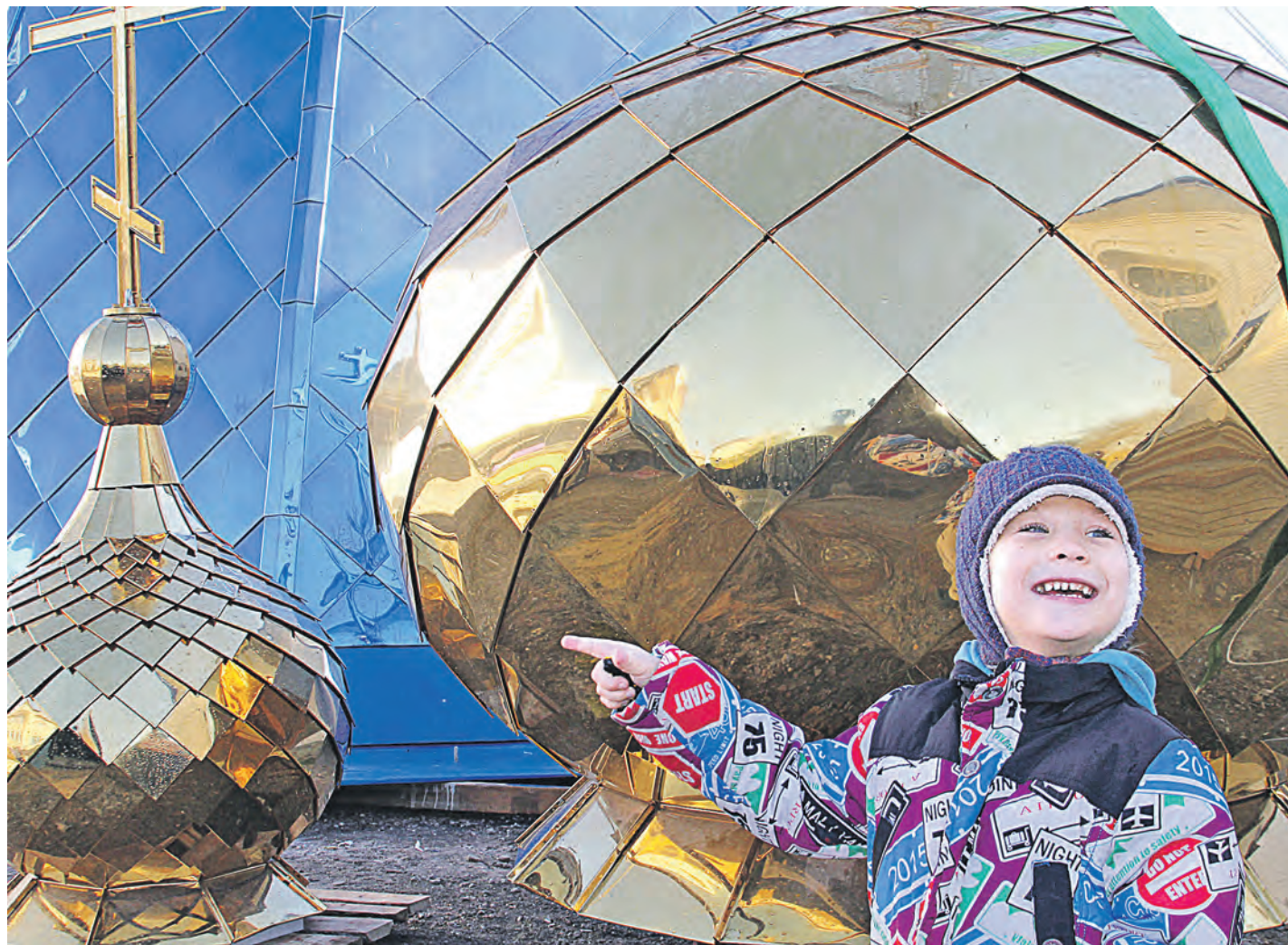
Поучаствовать в молебне по поводу поднятия куполов нового храма пришли сотни новотройчан разных возрастов

В церкви Благовещения Пресвятой Богородицы на улице Фрунзе вчера прошел торжественный молебен по случаю водружения шатров и куполов.