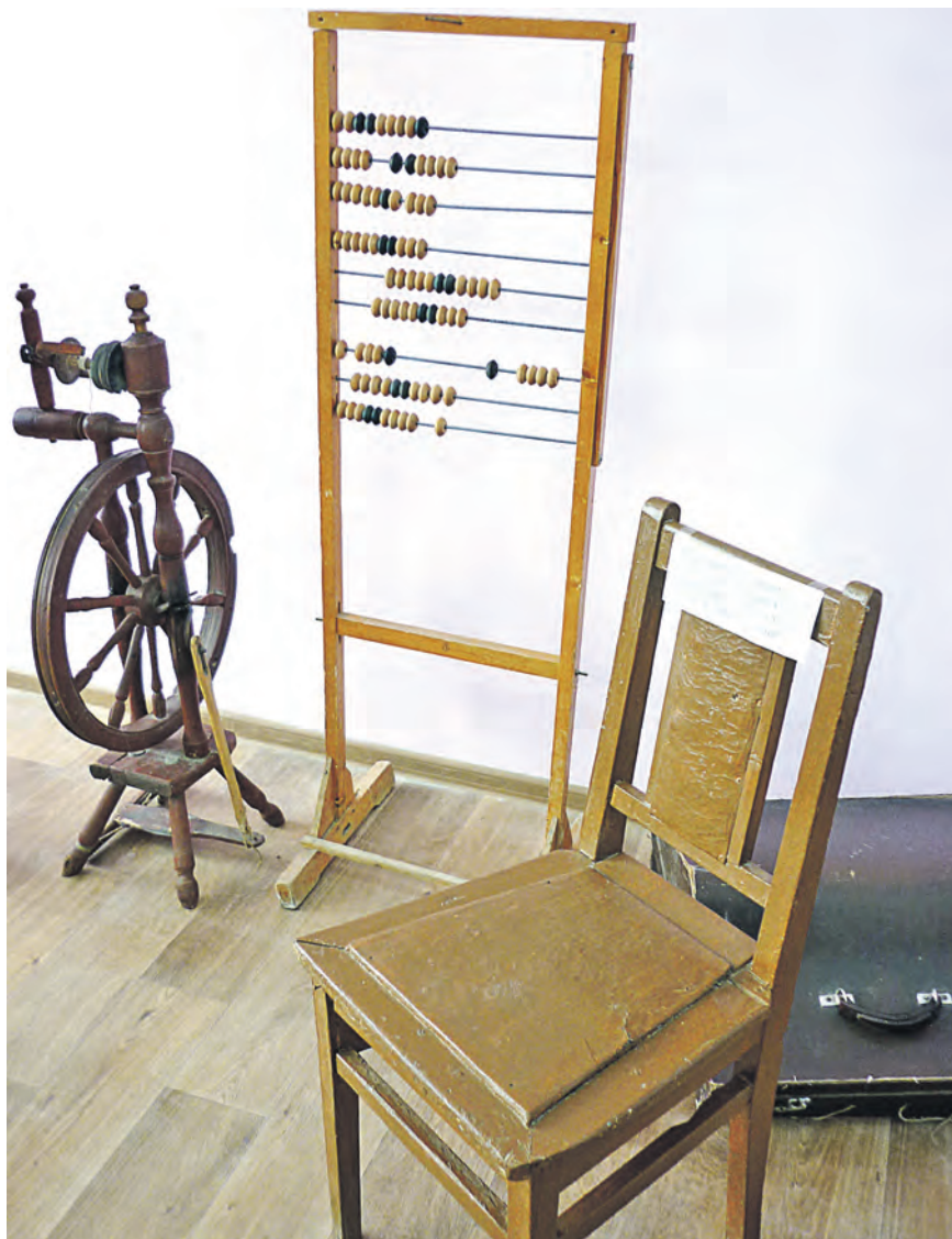
В музее фильма «Не хлебом единым» собраны экспонаты родом из середины XX века

К онцепция «Пять шагов благоустройства повседневности», разработанная КБ «Стрелка», принята к реализации в рамках федеральной программы, в которой Новотроицк участвует при поддержке Фонда развития моногородов, привлеченного к работе по инициативе Металлоинвеста. Большое внимание в документе уделено социальной инфраструктуре, объектам молодежной культуры и исторической части города.