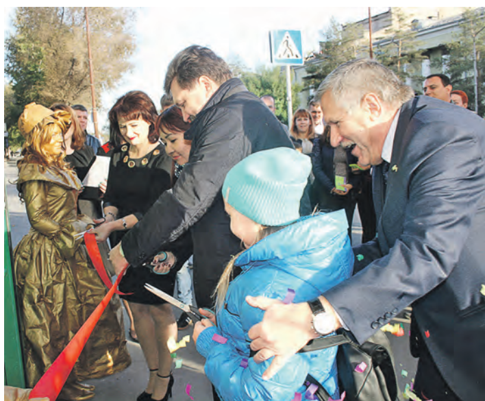
Открытие «Антикафе» решит вопрос с проведением досуга у молодежи