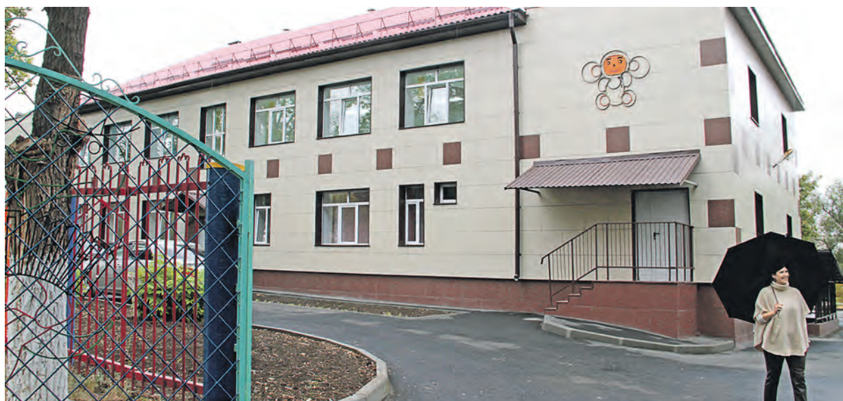
«Не садик, а картинка», – говорят местные жители про отремонтированный при помощи Металлоинвеста детский сад №16