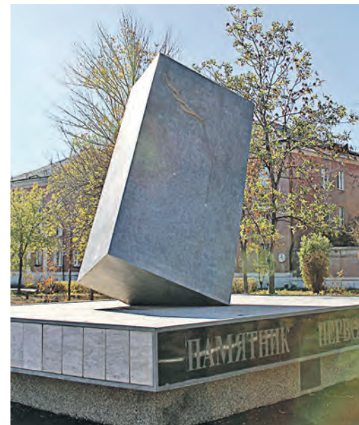
Памятник первостроителям – тоже объект заботы