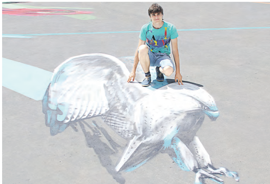
Хит этого лета – фотография с нарисованными на асфальте животными