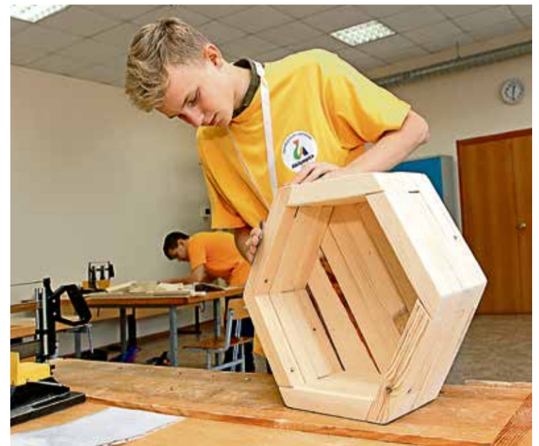
▲ Благодаря поддержке Металлоинвеста в обустройстве мастерских интерната он получил право на проведение региональных этапов конкурсов профмастерства Абилимпикс

В рамках проекта «К успеху вместе!» также предусмотрено масштабное практическое меро-