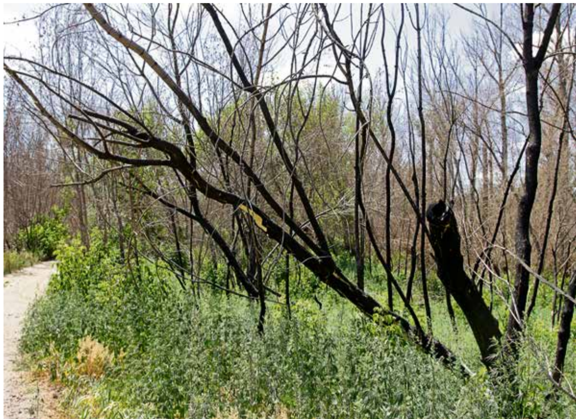
▲ Случись в лесу новый пожар — «пищи» для огня в нём будет предостаточно

На сегодня у администрации есть только предварительная оценка стоимости лесовосстановительных работ, и нет уверенности, что на это найдутся деньги.