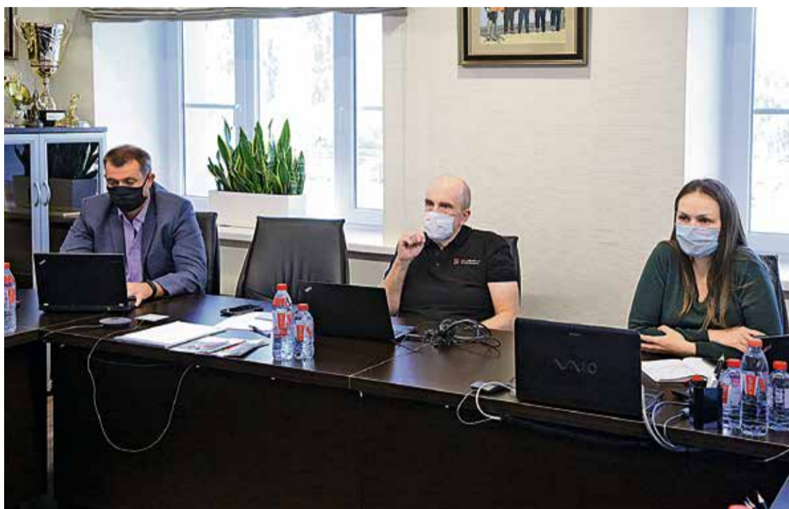
▲ Комитет по развитию Бизнес-Системы проходил в привычном уже формате онлайн-конференции

Обсудили и то, что сейчас во всех структурных подразделениях (СП) компании идёт интенсивная подготовка к финальному внутреннему аудиту, который покажет уровень зрелости Бизнес-Системы. В процессе принимают участие не только эксперты, но и руководители комбинатов, так что оценки каждый передел получает самые строгие и правдивые. Это особенно важно, ведь именно