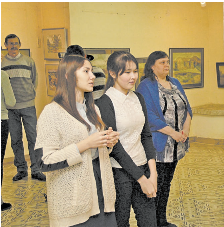
Открытие выставки привлекло зрителей разного возраста. Молодежь брала на заметку те или иные приемы. Взрослые зрители пользовались возможностью задать вопрос авторам