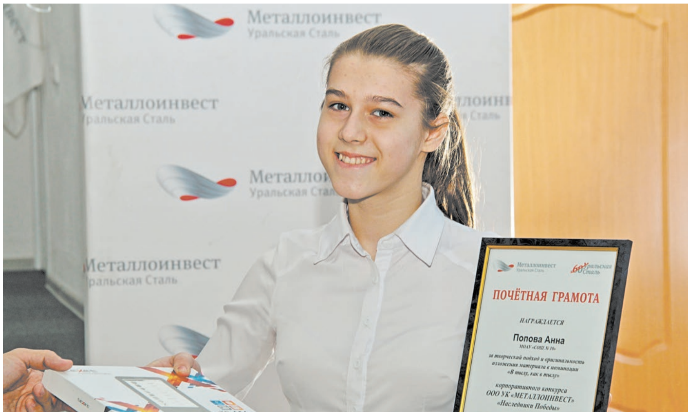
Авторы лучших сочинений получили почетные грамоты Металлоинвеста и электронные книги

К 26 победителям конкурса сочинений «Наследники Победы», организованного Металлоинвестом, пришли в гости депутаты городского Совета.