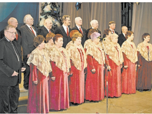
Выступает хор «Надежда»