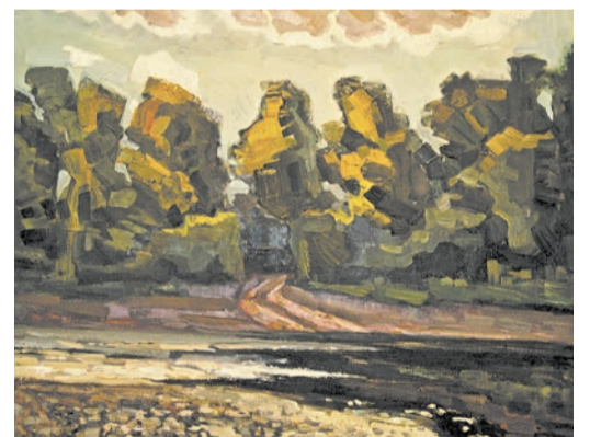
Пейзажи по Сакмаре отличаются особой красотой