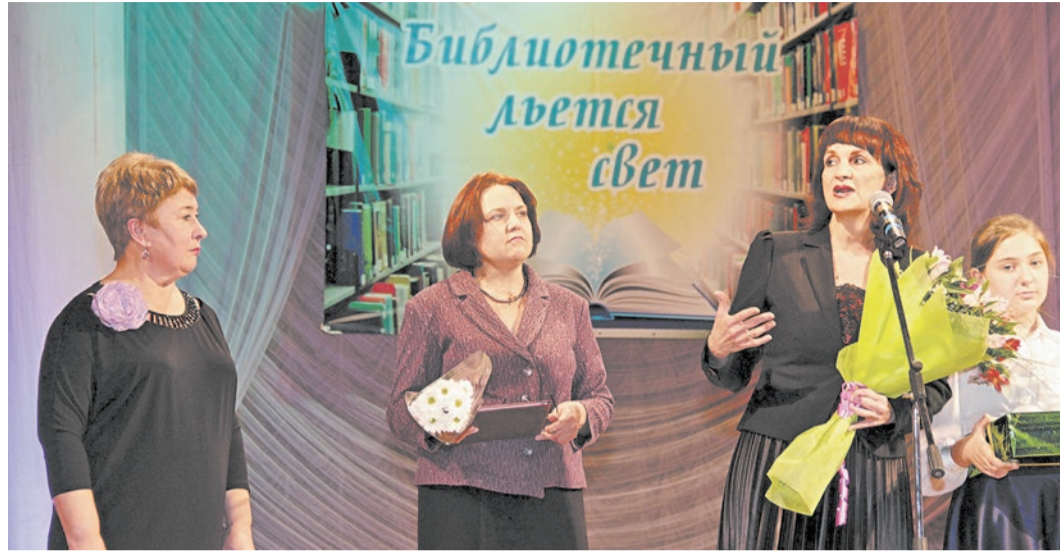
У бумажной книги — долгая жизнь, уверены библиотекари