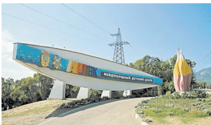
У ребят есть возможность попасть в «Артек», просто написав письмо