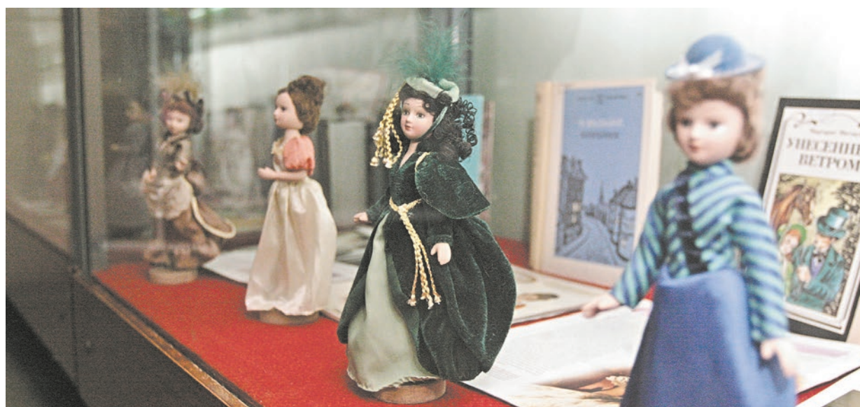
Любуясь кукольной экспозицией, словно окунаешься на мгновение во времена барышень в шикарных платьях