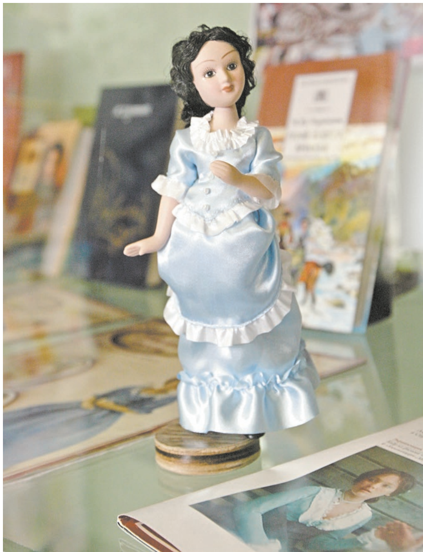
У каждой фарфоровой дамы своя история создания, свой мир фантазий, свой характер

Р еалистичность образов и потрясающие костюмы восхищают, все книжные персонажи сразу узнаваемы. В выставочных декорациях посетители встречаются со знаменитыми героинями произведений Александра Пушкина, Михаила Лермонтова, Бориса Пастернака, Михаила Булгакова и многих зарубежных писателей.