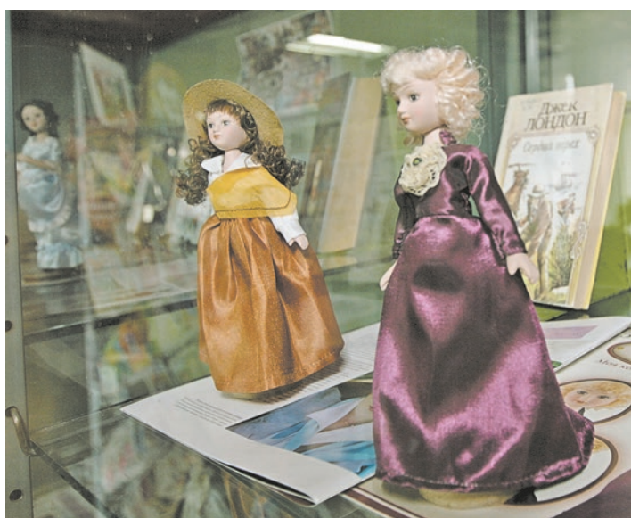
Куклы приглашают прочитать произведения мировой классики

Владислава Сергеева