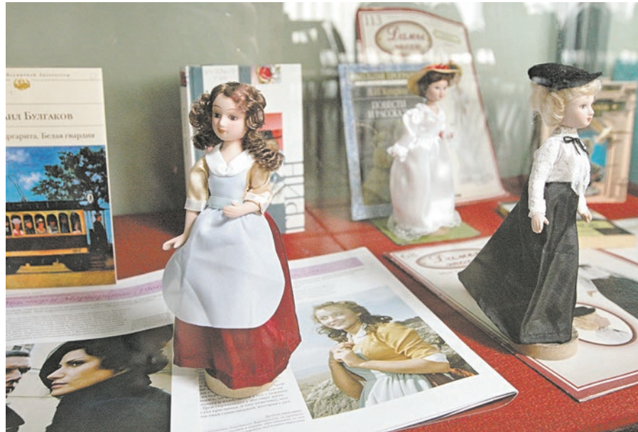
Кукольный вернисаж дополнен журналами «Дамы эпохи», в которых рассказывается о героине