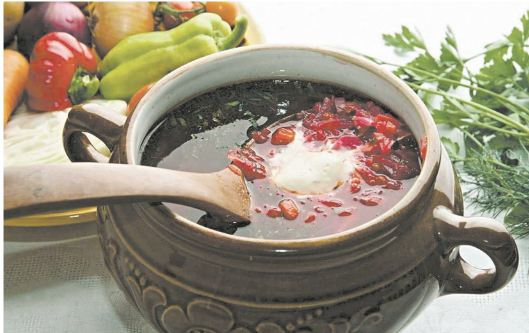
Борщ один из гастрономических предметов, о которых люди способны спорить ожесточеннее, чем о политике

Если у вас переросли огурцы — не беда — из них можно сделать очень вкусный салат на зиму! Слишком желтые, конечно, лучше не брать, а остальные смело «пускайте в ход». Кстати, подобный рецепт заготовки очень известен, вообще рецепты отличаются