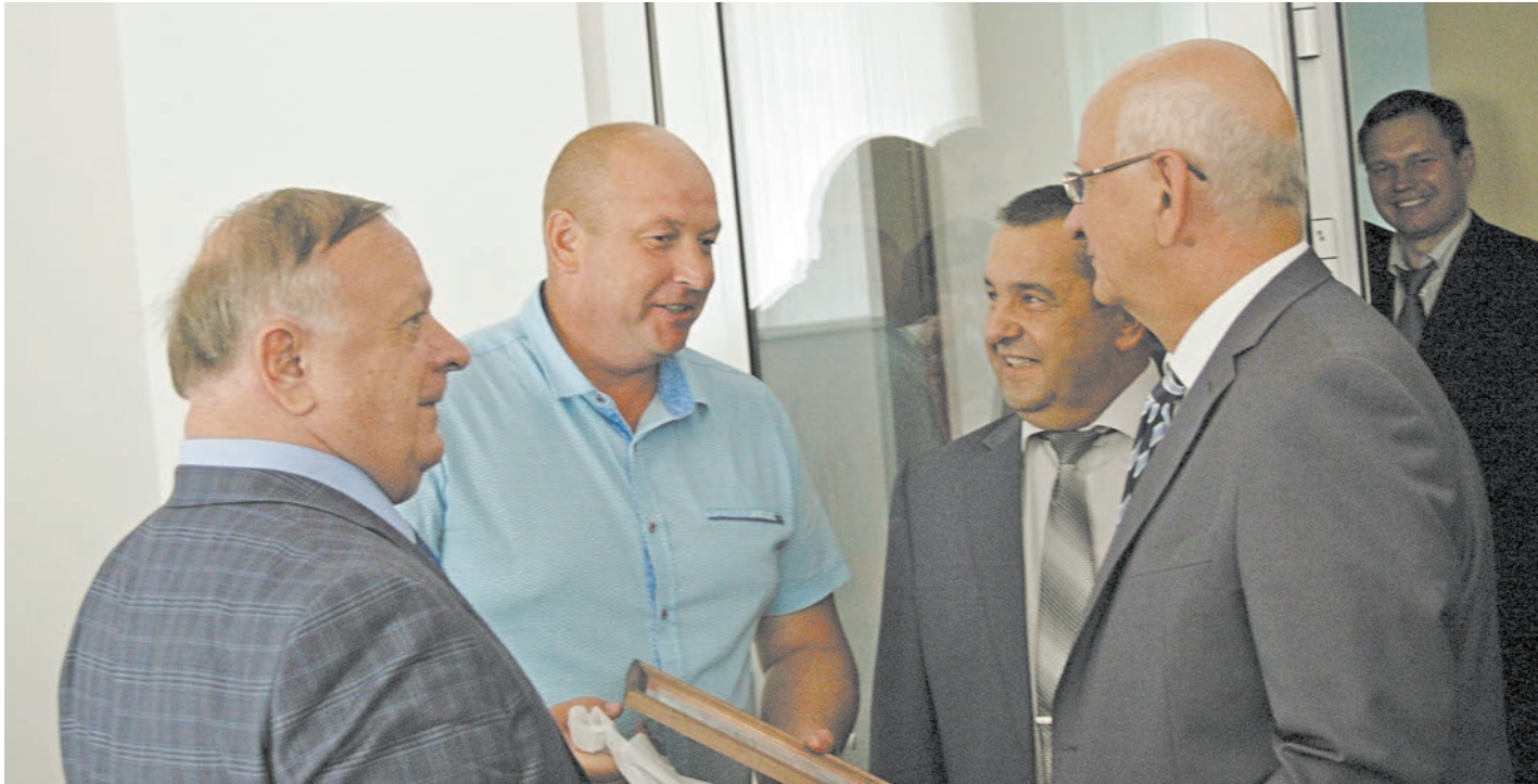
Успешный бизнес — результат всесторонней поддержки