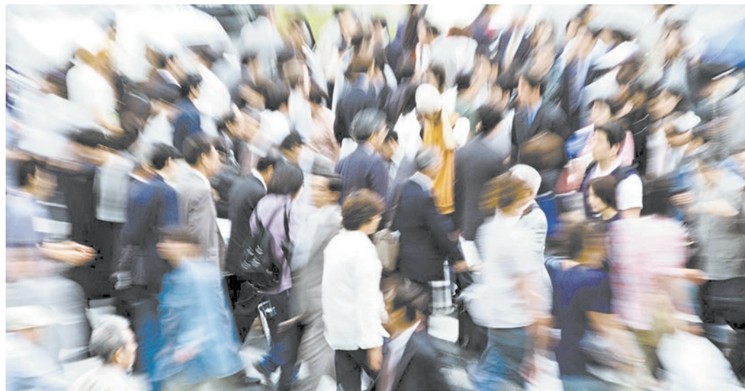
72 процента участников опроса чувствуют себя защищенными государством