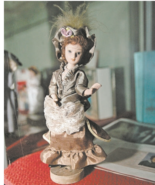
Ткани и кружева соответствуют эпохе