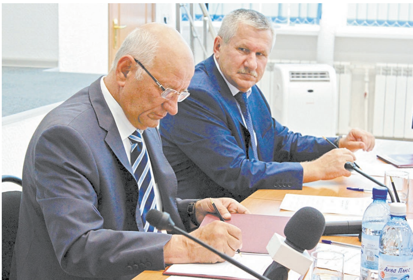
Тепличное хозяйство, соглашение о строительстве которого уже подписано, будет поставлять овощи на стол оренбуржцам круглый год

На совещании по развитию Новотроицка правительство области, администрация нашего города и компания «Зеленый проект» подписали соглашение о сотрудничестве.