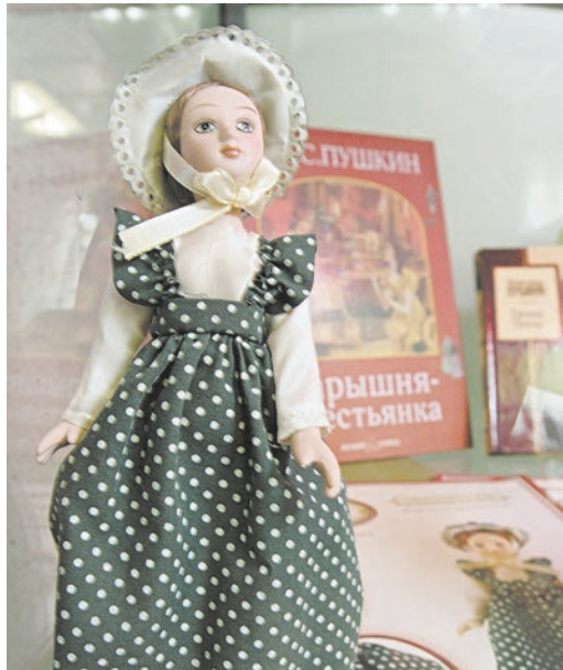
Все книжные персонажи сразу узнаваемы