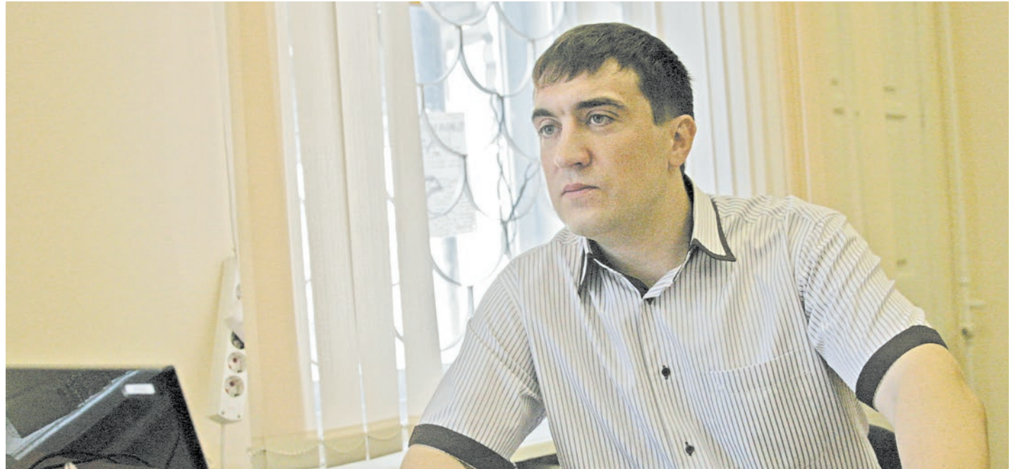
Разработанная инженерами Уральской Стали система управления гармонично вписалась в существующую автоматику стана