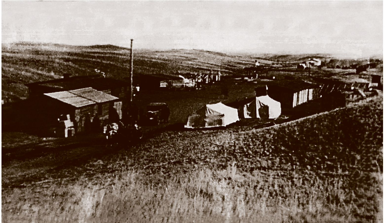
▲ На снимке, датированном примерно 1935 годом, невозможно угадать даже примерные контуры будущего города, но именно так зарождался Новотроицк