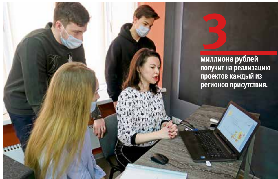
▲ Обучение участников ведётся по два часа трижды в неделю, кроме того, по воскресеньям можно принять участие в вебинарах

Приём заявок для участия в конкурсе открыт до 12 апреля. А уже в мае мы узнаем имена победителей, чьи инициативы будут поддержаны Металлоинвестом.