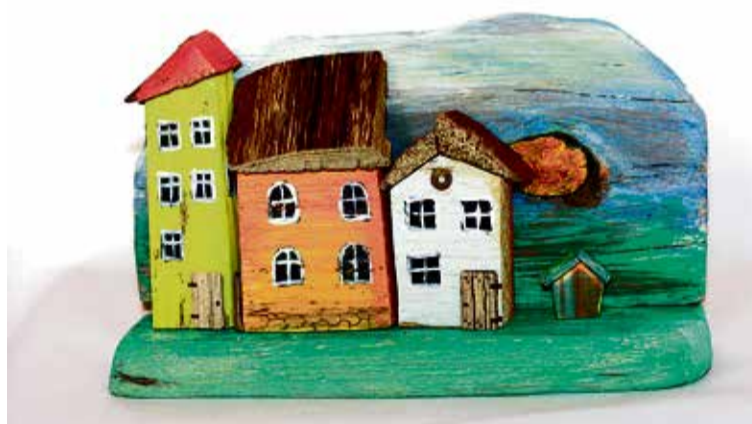
◀ Нарочитая условность работ не мешает взгляды в детали, и тогда структура дерева превращается в трещинки штукатурки на фасаде старого дома