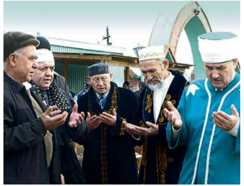
▲ Религия для казахов не повод подчеркнуть свою исключительность, а возможность настроить внутренний камертон на гармонию с миром