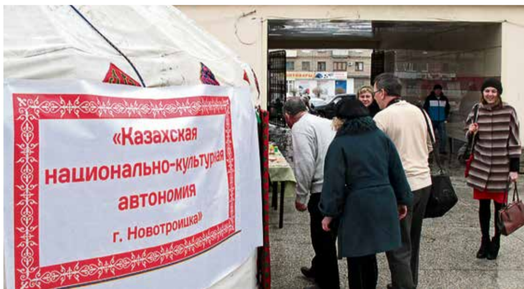
◀ Заглянуть в юрту, попробовать народные блюда — у посетителей Дней казахской культуры всё это вызывает неподдельный интерес

► Люди и земля, на которой они живут, схожи сдержанной красотой, которая влюбляет в себя тем сильнее, чем дольше на них смотришь