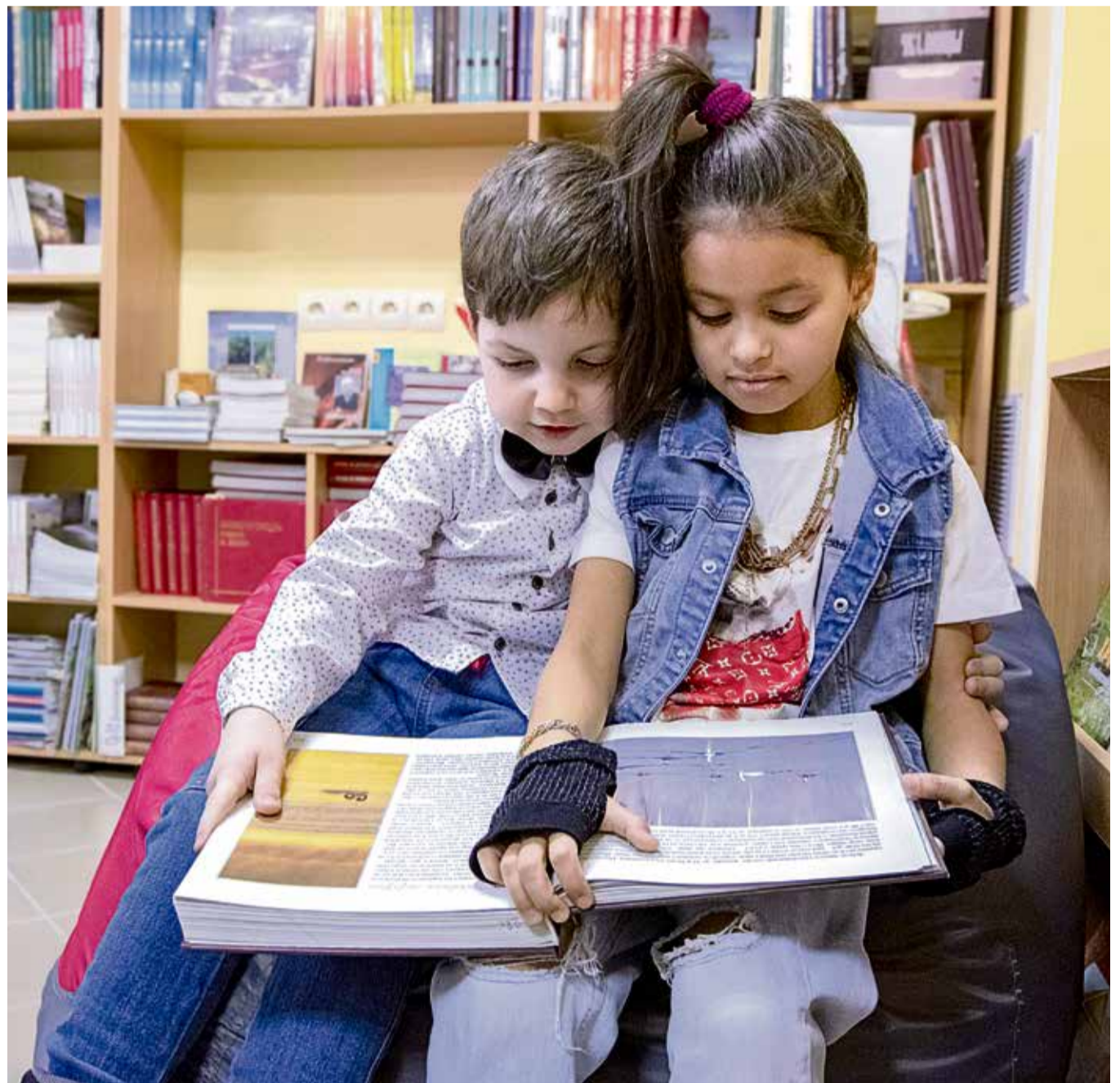
▲ В обновлённой библиотеке нет чопорной строгости: здесь сколько угодно можно листать заинтересовавшую тебя книжку, сидя на удобных мягких пуфах

В честь своего открытия после капитального ремонта новотроицкая библиотека семейного чтения получила от Металлоинвеста денежный сертификат на приобретение литературы.