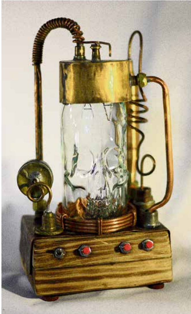
▲ Работы в стиле «стим-панк» существуют вне времени, их одинаково легко представить и в доме вековой давности, и в современной квартире