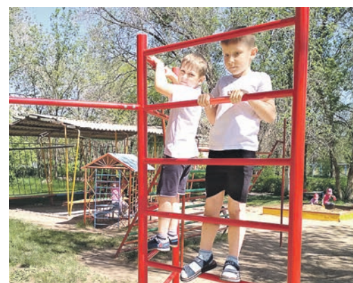
Проект способствовал приобщению дошкольников к здоровому образу жизни