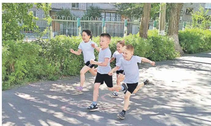
Педагоги «Светлячка» отмечают положительную динамику развития физических качеств у своих воспитанников