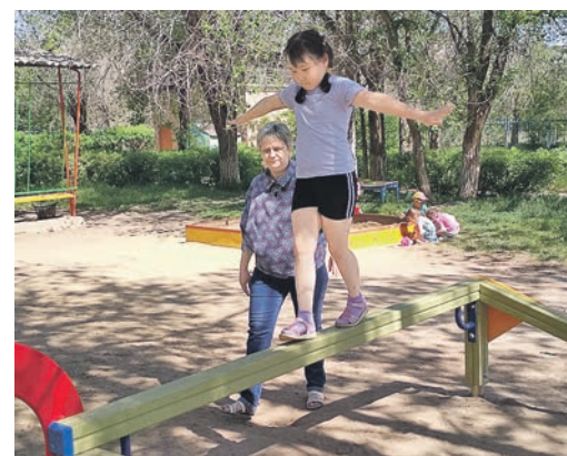
Бояться не стоит – опытные наставники всегда готовы подстраховать новичка

Сегодня вопросы сохранения детского здоровья нуждаются в новых подходах. Проанализировав большое количество литературы по этому поводу, воспитатели «Светлячка» пришли к выводу, что применение новой методики «Игрового стретчинга» в развитии физических качеств старших дошкольников очень актуально. Игровой стретчинг – это комплекс специально подобранных упражнений для растяжки мышц, проводимый с детьми в игровой форме. Все занятия выглядят как сюжетно-ролевые или тематические игры, состоящие из взаимосвязанных заданий и упражнений. Благодаря стретчингу увеличивается подвижность суставов, мышцы становятся более эластичными и гибкими, дольше сохраняют работоспособность, повышается двигательная активность, упражнения помогают формированию правильной осанки. А еще на таких занятиях воспитываются выносливость и старательность.