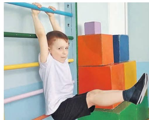
Упражнения игрового стретчинга охватывают все группы мышц