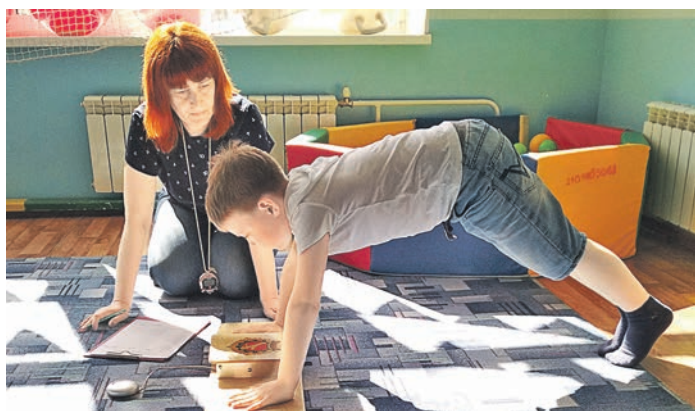
Сгибание и разгибание рук в упоре лежа на полу – часть обязательной программы ГТО первой ступени