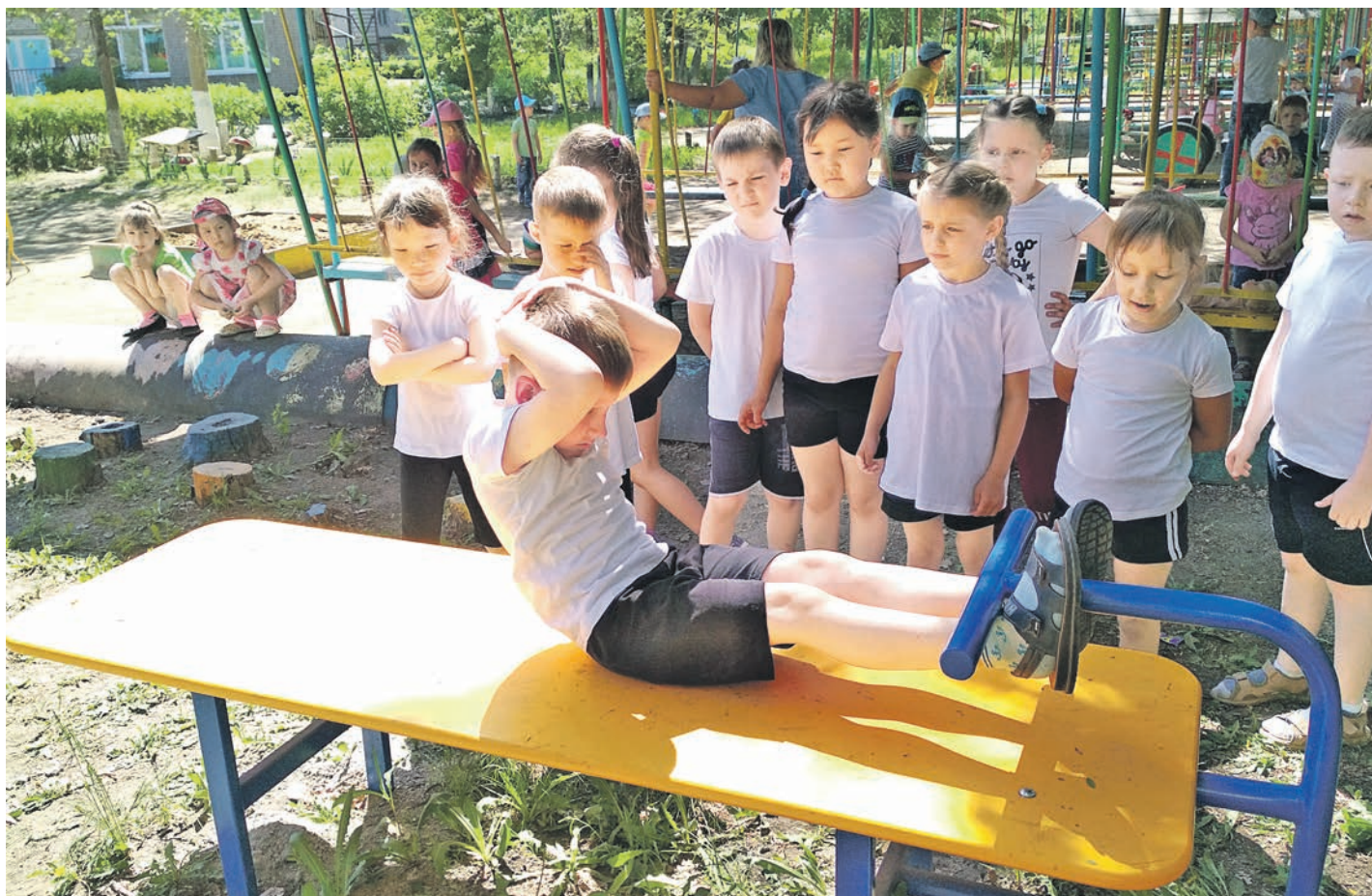
Подъем туловища из положения лежа на спине – одно из испытаний ГТО

В 2017 году детский сад №35 стал одним из победителей грантового конкурса Металлоинвеста «Здоровый ребенок». Его проект «Здоровые дети – счастливые дети. ГТО в детский сад» получил признание в номинации «Марафон здоровья».