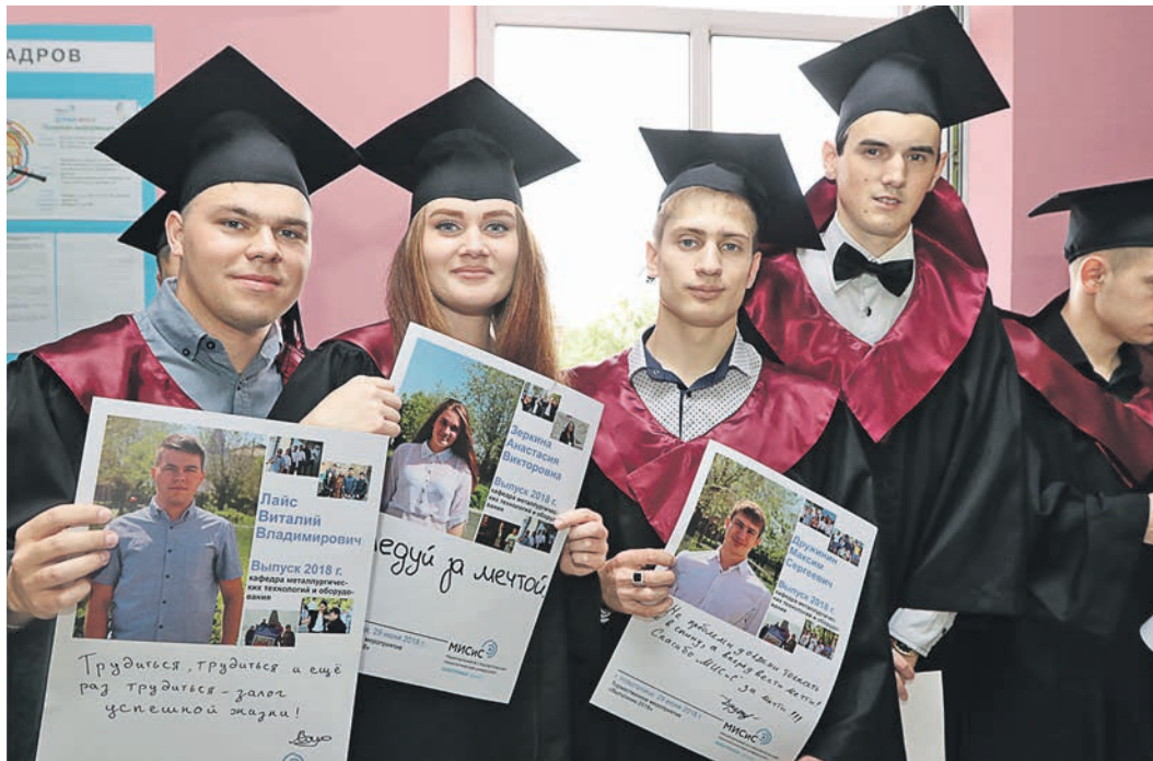
Уже сейчас можно сказать, что аллея выпускников обязательно станет доброй традицией мисисовцев