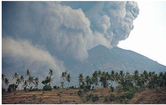
Турагент заботливо отправлял в отпуск на действующий вулкан