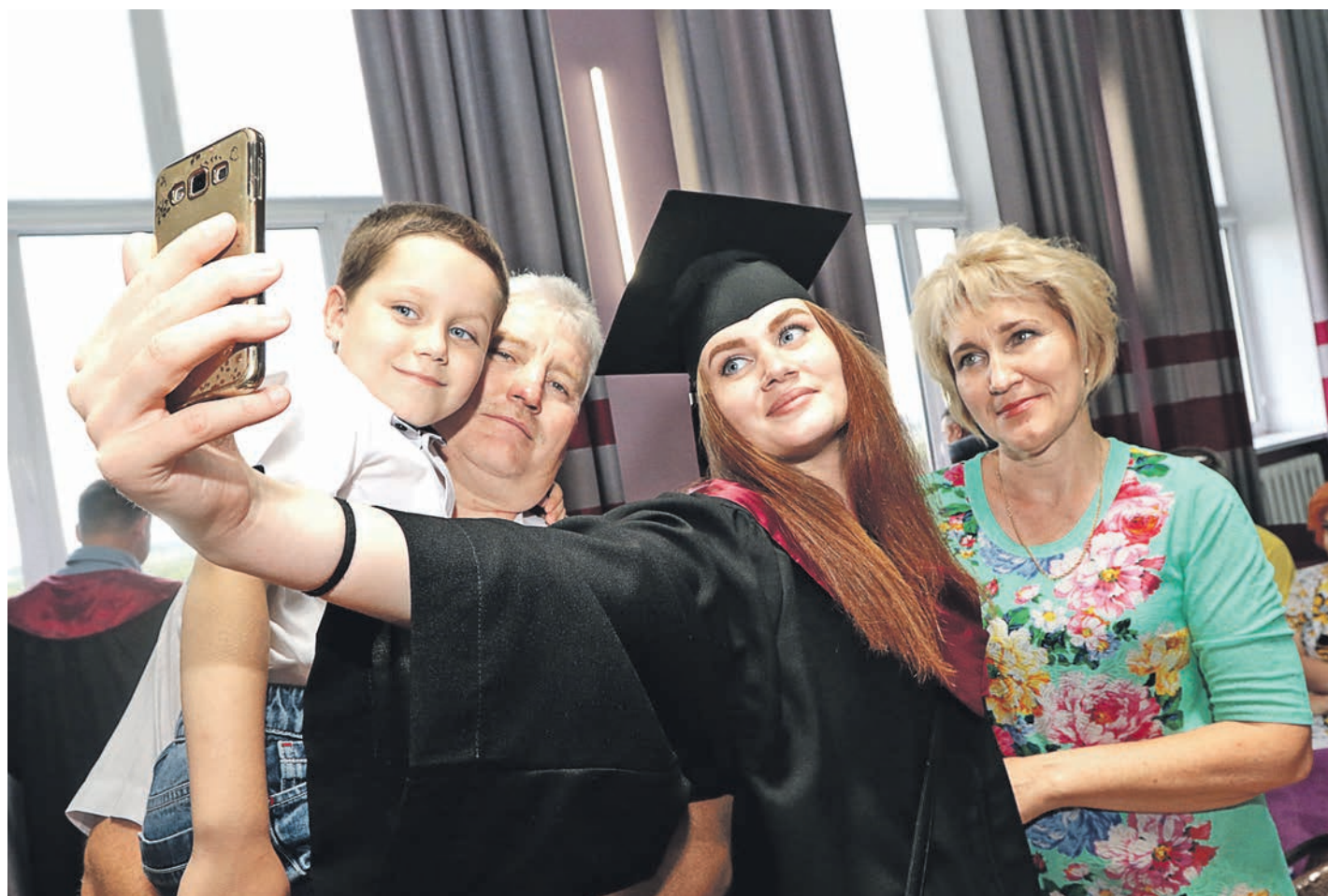
Фотографии этого незабываемого дня всегда будут среди самых ценных в домашней коллекции

В Новотроицком филиале университета состоялось вручение дипломов юбилейному выпуску молодых инженеров. В этом году высшая школа празднует столетие с момента основания.