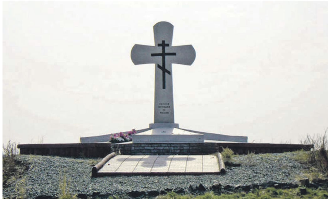
Сегодня мы можем помянуть добрым словом и белых, и красных, долгое время это было запрещено