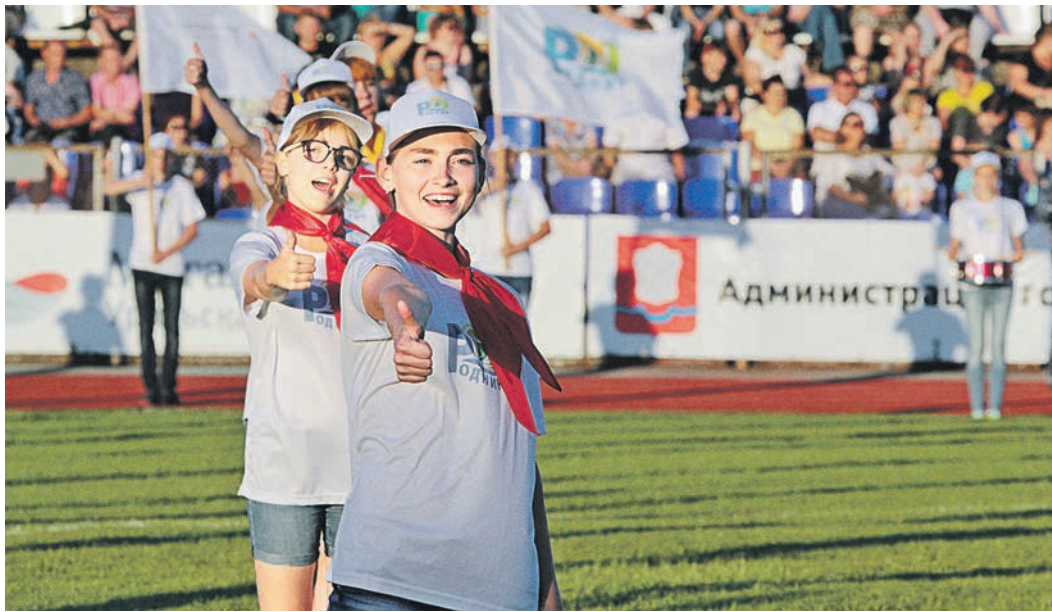
Праздничный концерт по традиции пройдет на стадионе «Металлург»

С 10 июля на комбинате начались торжественные собрания представителей трудового коллектива Уральской Стали. Более пятиста передовиков комбината будут отмечены ведомственными, отраслевыми и корпоративными наградами.