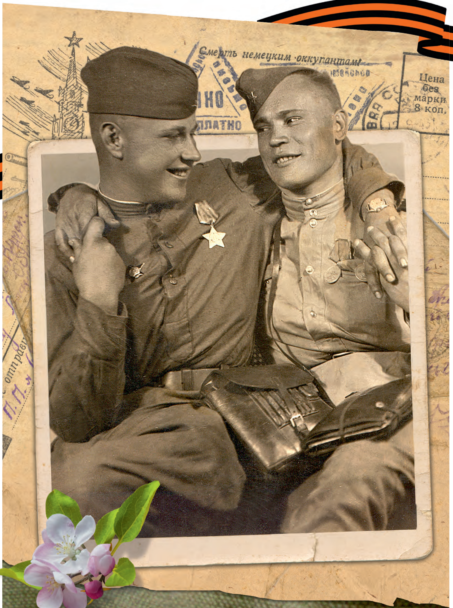
▲ Служили два товарища. Прага, Чехословакия, 29 мая 1945 года