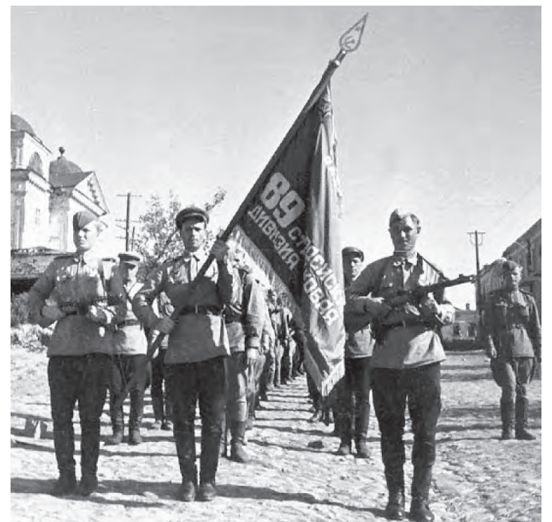
▲ Воины 89-й Белгородско-Харьковской гвардейской стрелковой дивизии проходят по улице освобождённого Белгорода