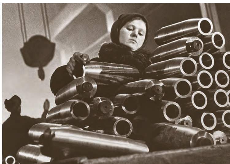
▲ Десятки тысяч школьников по всей стране в годы войны встали к станкам в цехах, часто возведённых в чистом поле. И в кратчайшие сроки фронт начал получать вооружение, боеприпасы и обмундирование, сработанные детскими руками

— В заводской столовой кормили нас бесплатно, когда на смене. Называли мы эту еду «баландой», жиденький такой супчик. И чай вместо второго и десерта. Поэтому, чтобы наесться, всем приходилось из дома еду приносить. У нас была корова, так я брала бутылочку молока, хлеба ломоть — тем и сыта была. Без своего хозяйства не знаю, как бы и выжили. Зарплата моя была 800 рублей, а буханка хлеба сто-