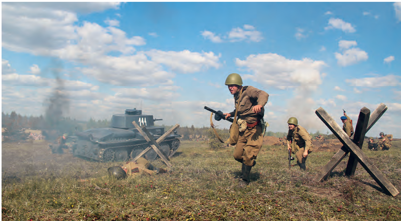
▲ На мемориальном комплексе «Поклонная высота 269» в Фатежском районе Курской области в 2020 году прошла военно-историческая реконструкция боя на Северном фланге Курской дуги