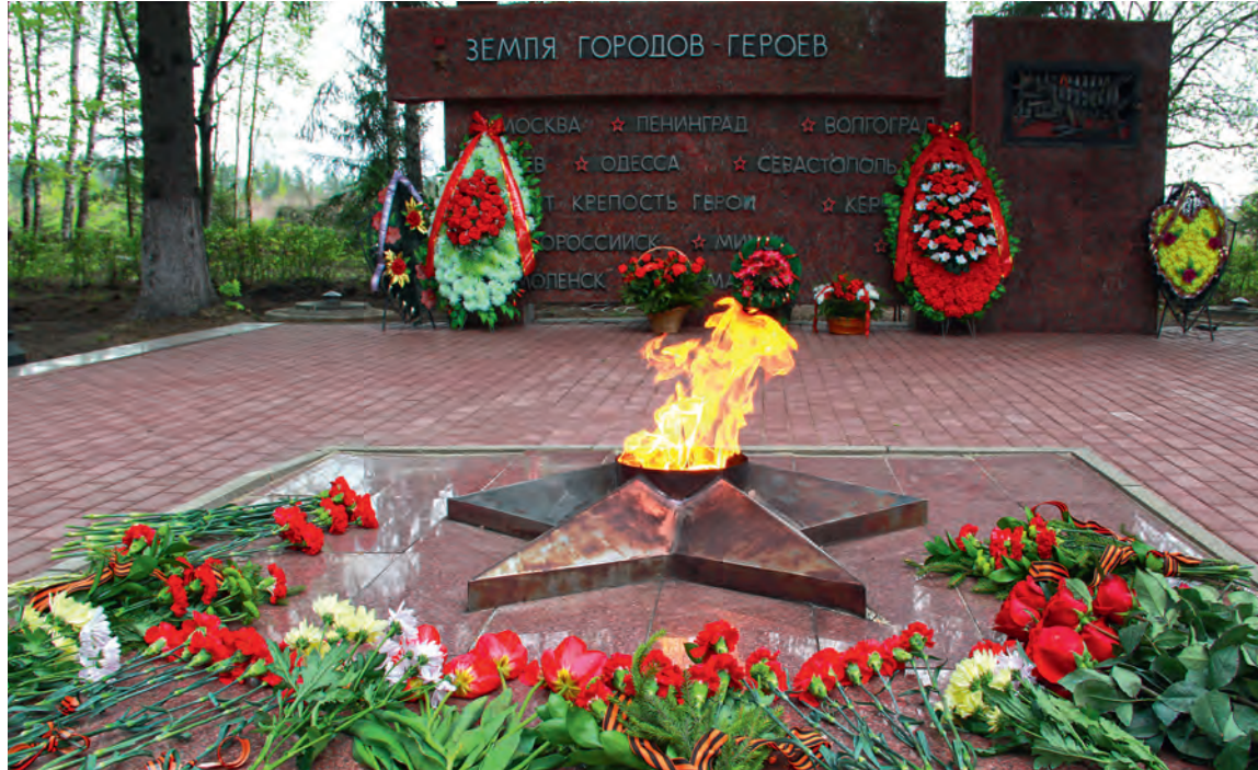
▲ Вечный огонь на мемориале «Большой Дуб» в Железногорском районе в память о замученных захватчиками жителей посёлка никогда не погаснет

В наказание фашисты провели карательную операцию «Белый медведь» — сожгли дотла посёлок Большой Дуб и его жителей. 18 взрослых, 26 детей. Несколько матерей с грудными младенцами