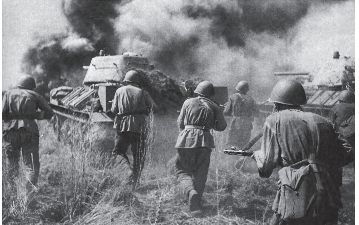
▲ На поле под Прохоровкой 12 июля 1943 года произошло самое крупное танковое сражение Великой Отечественной войны, предпринявшее её исход

Официально же столице Белогорья присвоен статус «Город воинской славы», о чём также повествуют стелы при въезде в город. Он дважды был оккупирован немецкими войсками. Противник превратил Белгород в сильный узел сопротивления. Вокруг города был создан мощный оборонительный обвод с густой сетью