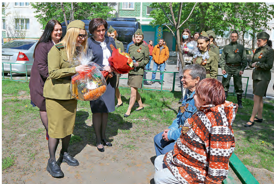
« Сотрудники Металлоинвеста, в том числе волонтеры корпоративной программы «ВМЕСТЕ! С призыванием», поздравили с Днём Победы бывших работников предприятий — ветеранов войны, малолетних узников концлагерей, тружеников тыла

Всё дальше от нас победный май 1945 года, всё меньше рядом тех, кто сражался на фронтах Великой Отечественной войны, ковал победу в тылу. Металлоинвест бережно относится к сохранению исторической памяти, помнит и чтит подвиг народа. Компания активно включилась в мероприятия, посвящённые 76-й годовщине Великой Победы.