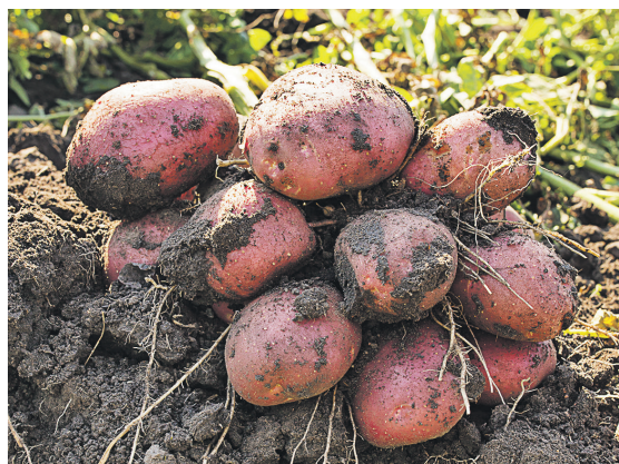
◀ Валентина Рябцева считает, что гарантия хорошего урожая для любого огородника — максимально полная информация о свойствах почвы, на которой произрастает культура

— Есть простой способ определить кислотность почвы. Пол-