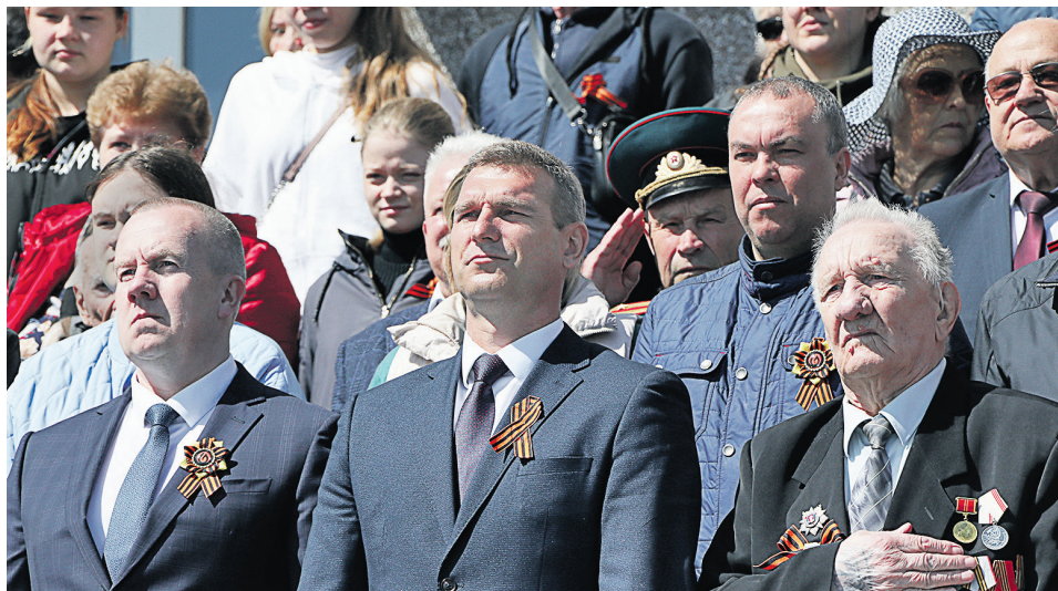
▲ Сотни горожан от мала до велика пришли на стадион «Металлург», чтобы увидеть концерт, подготовленный творческими коллективами города