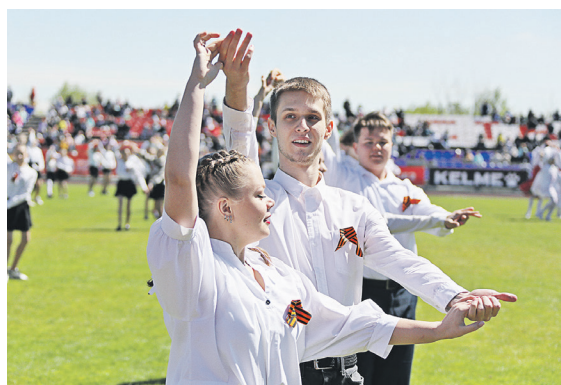
▲ «Майский вальс» композитора Игоря Лученка точнее других способен передать атмосферу праздника