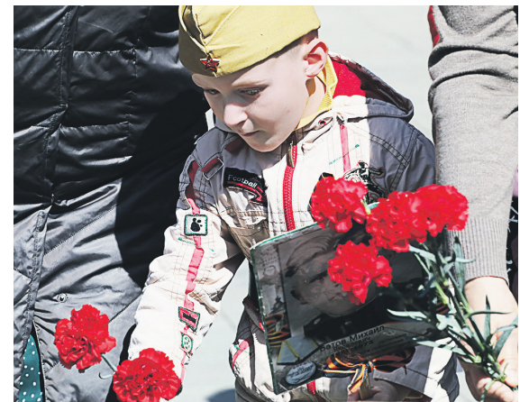
▲ Для юного новотройчанина это один из первых праздников Победы, который останется в его памяти на долгие годы