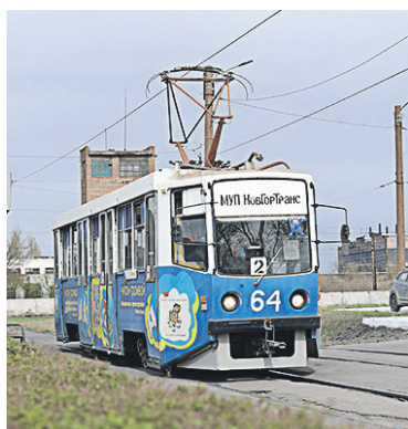
▲ Уходящая натура: трамваи Усть-Катавского завода в городе всё меньше, за неполные три месяца они успели стать экзотикой