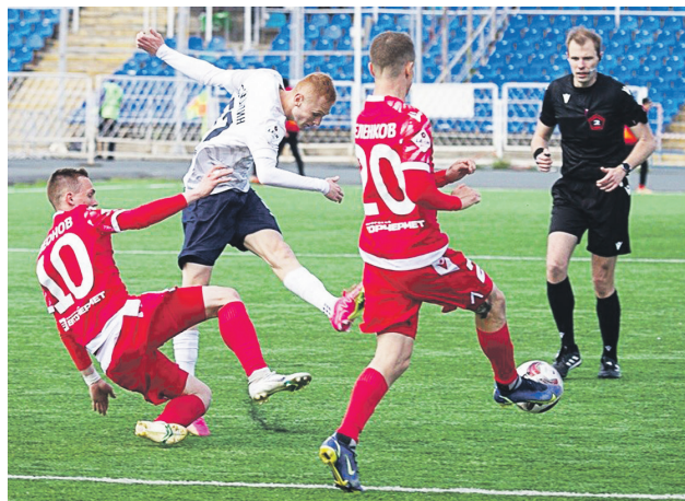
▲ В Самаре команда показала, как умеет обороняться всем составом. К сожалению, в атаке «НОСТА» выступила не так удачно