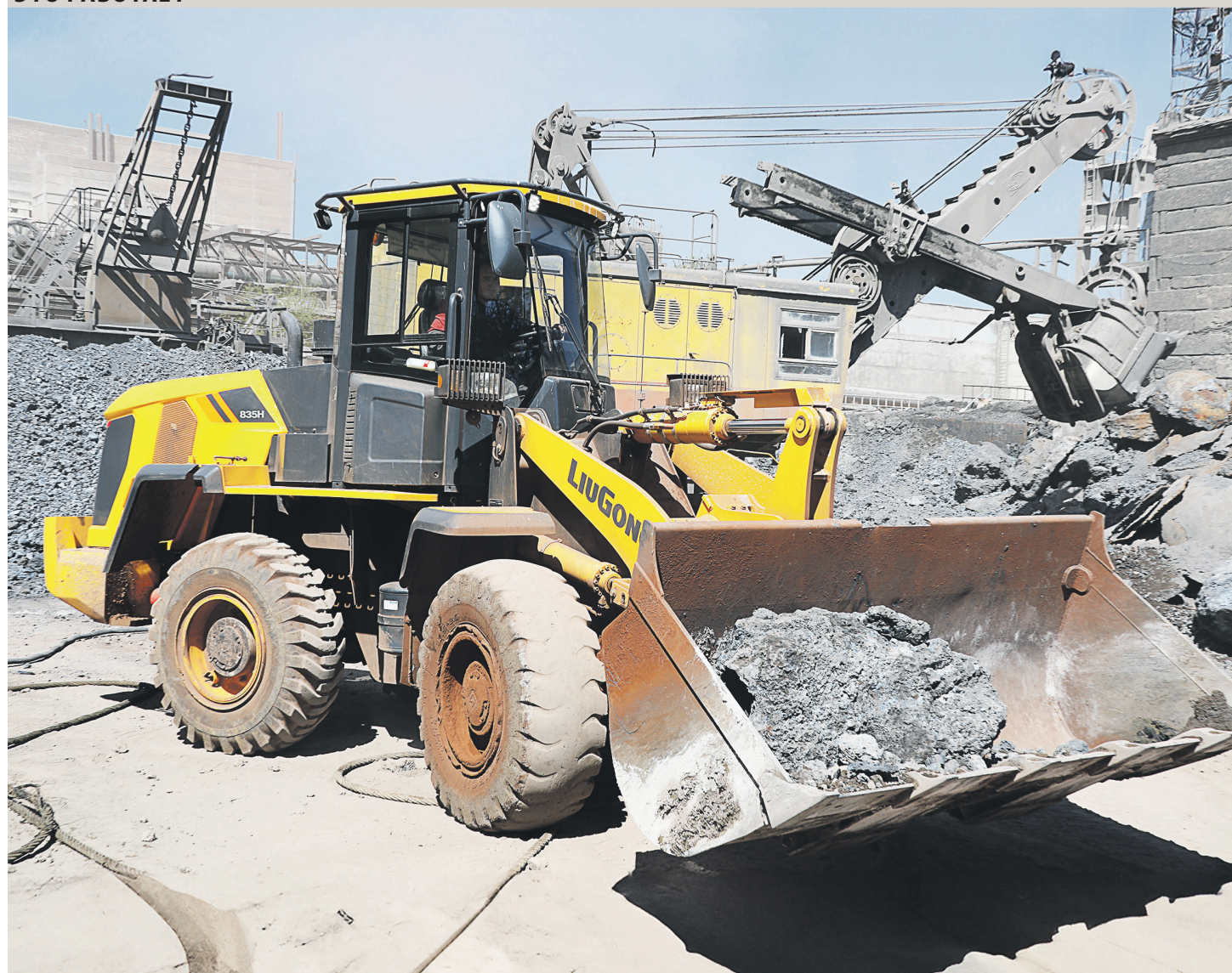
▲ При необходимости погрузчик может выступить и в роли бульдозера, помогая убрать экскаваторную просыпь на площадке шлакового двора ЭСПЦ