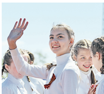
▲ «Мама, мама, я здесь!» — благодаря победе в Великой Отечественной, потомки ветеранов не познали гнёта иностранных захватчиков