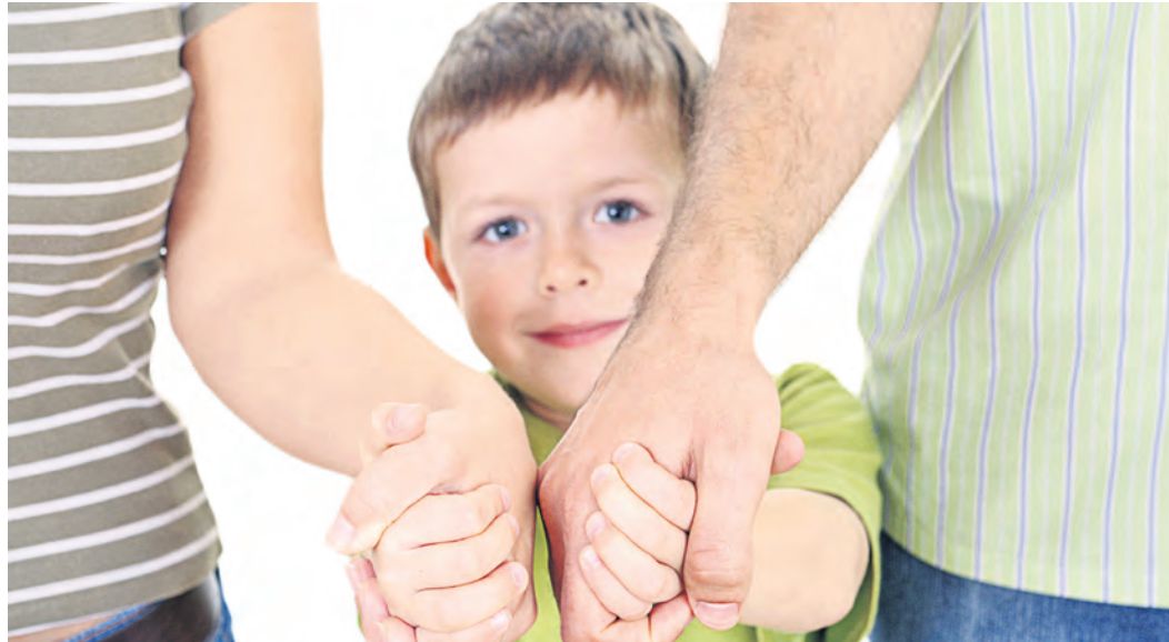
Финалом каждого выяснения отношений должно быть публичное примирение, говорят психологи

Не припоминайте прошлых грехов. Близкие родственники, а особенно родители должны быть примером для подражания в глазах малышей, и им не