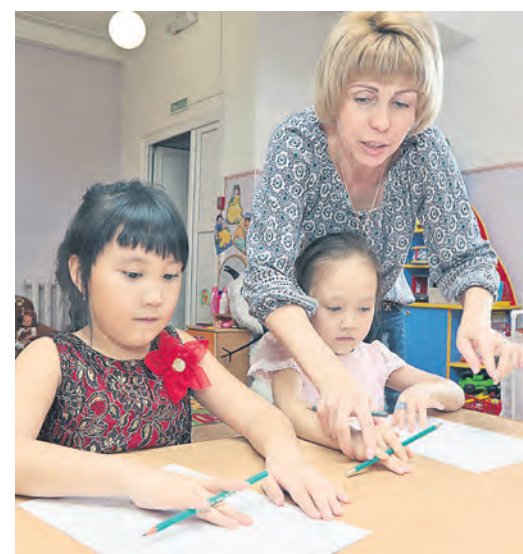
Тренировать пальцы нужно еще до школы