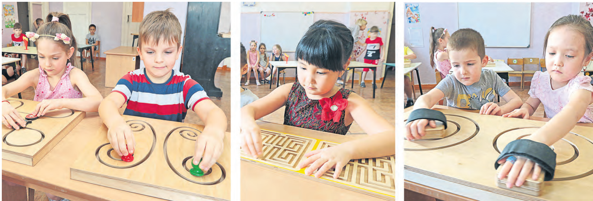
Занятия проводятся с помощью специального оборудования в виде лабиринтов и спиралей, появившихся в садике благодаря Металлоинвесту. Работа двух рук одновременно задействует оба полушария мозга

Одним из победителей грантового конкурса Металлоинвеста «Здоровый ребенок» стал детский сад №17: на его базе реализуется проект «От игры – к письму».