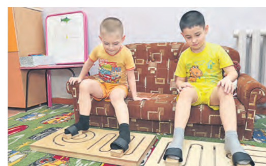
Развитие моторики ног это прежде всего весело