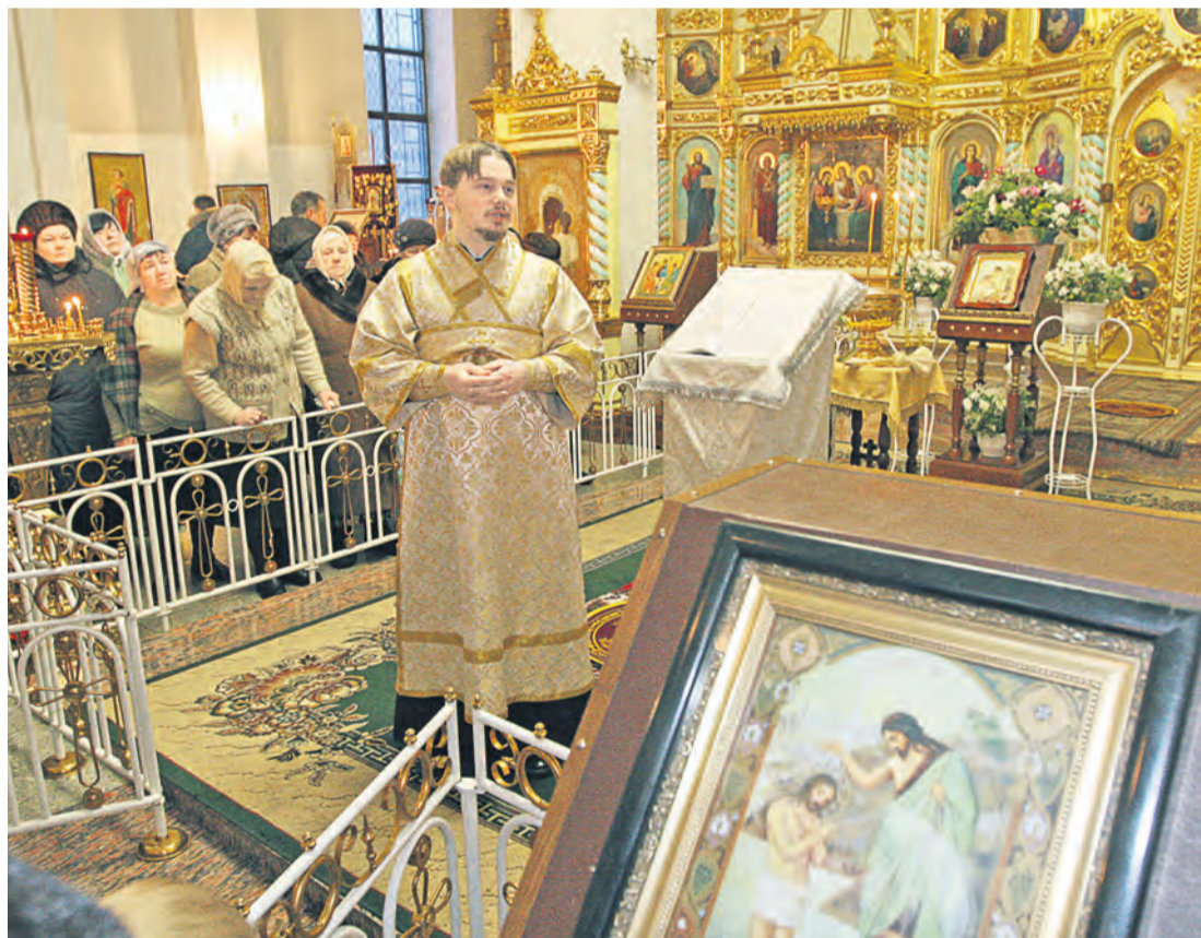
Церемонию водосвятия предваряет торжественная служба в церкви

Сегодня христианский мир отмечает Крещение Господне, событие евангельской истории более чем двухтысячелетней давности и одну из важнейших дат православия.