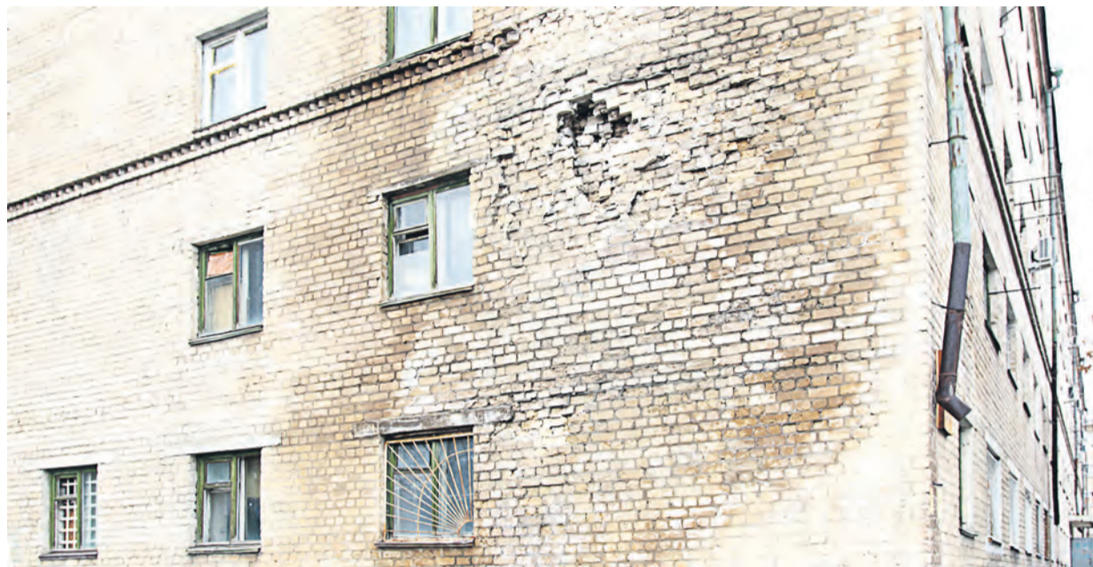
Часто собственники своими руками разрушают доставшееся им бесплатно жилье, а потом просят помощи у властей, показала история с общежитием на улице Пушкина. Идея, что владение – это ответственность, только предстоит сформироваться

Жители ждут, что вопросами ремонта их собственности так и будет заниматься государство. И готовы даже потерпеть и переплатить, лишь бы вместе с соседями не брать в свои руки вопросы проведения капитального ремонта.