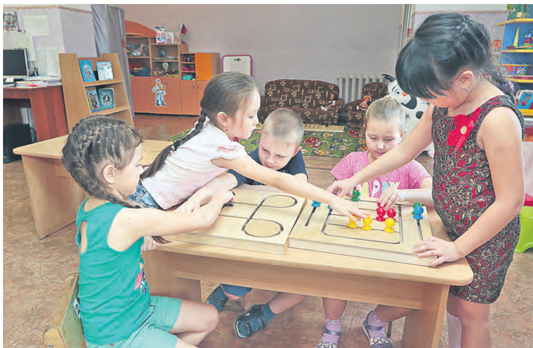
Детям настолько интересно, что зачастую они выполняют задания наперегонки

непосредственно на обучении, ведь именно это чаще всего и приводит к формированию неправильной техники письма. Во избежание негативных последствий при обучении письму и был разработан проект «От игры – к письму», позволяющий ребенку постепенно, без перегрузки, с учетом индивидуальных особенностей подготовиться к этому роду деятельности.