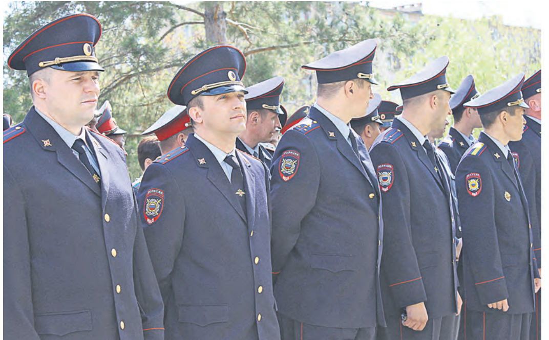
Патрульно-постовая служба не относится даже к отделу полиции №3. Теперь они исключительно «орчане»

Все эти доводы горсовета, подкрепленные еще и последующим письмом главы Новотроицка, областное управление МУ МВД игнорирует и отвечает, что депутаты заблуждаются – Оренбургу и Москве, согласовавшим предложение о реорганизации новотроицкой полиции, лучше видно, как обстоят дела в провинции, ведь целых три года ими прорабатывался вопрос присоеди-