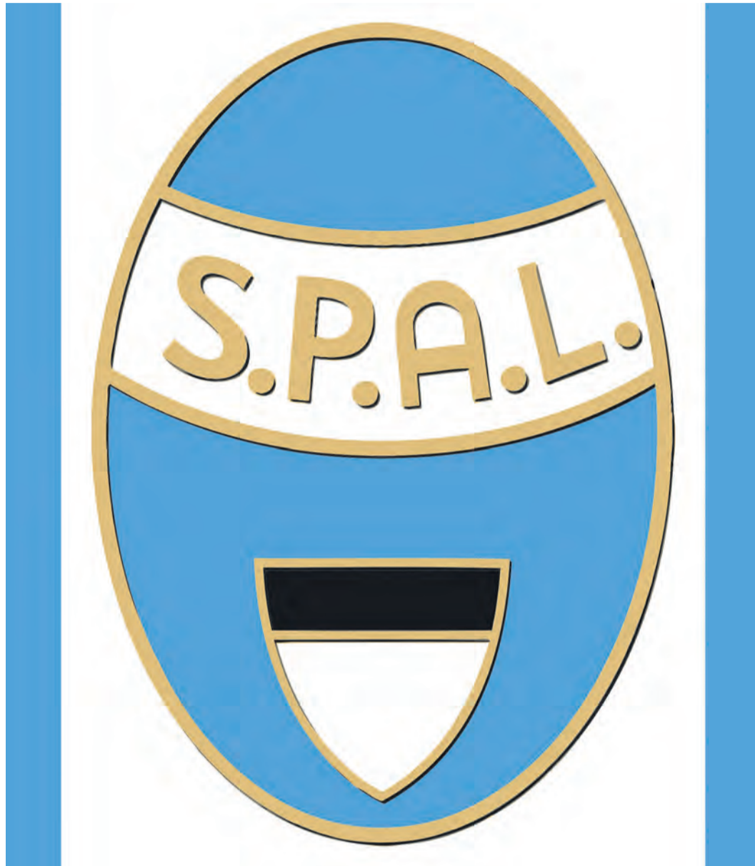
«СПАЛ» гостеприимно встретил ностовцев. Наши клубы похожи тем, что их названия представляют собой аббревиатуры. Для российского футбола это явление обычное, а для итальянской серии А – уникальное