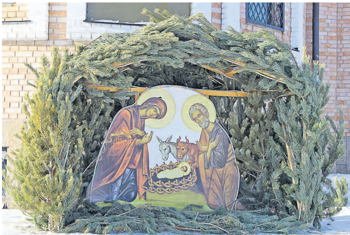
Рождество Христово – второе по значимости событие в православном календаре

Один из величайших христианских праздников – Рождество Христово – отметит через два дня православный мир. А завтра начнется сочельник и связанные с ним хлопоты.