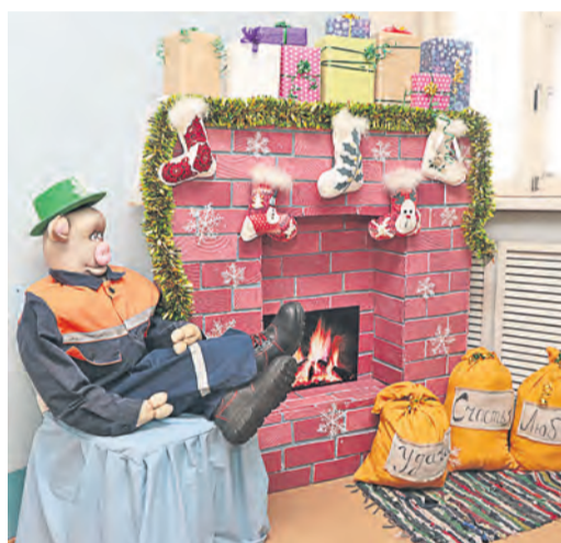
В ТЭЦ удобно устроился поросенок у камина