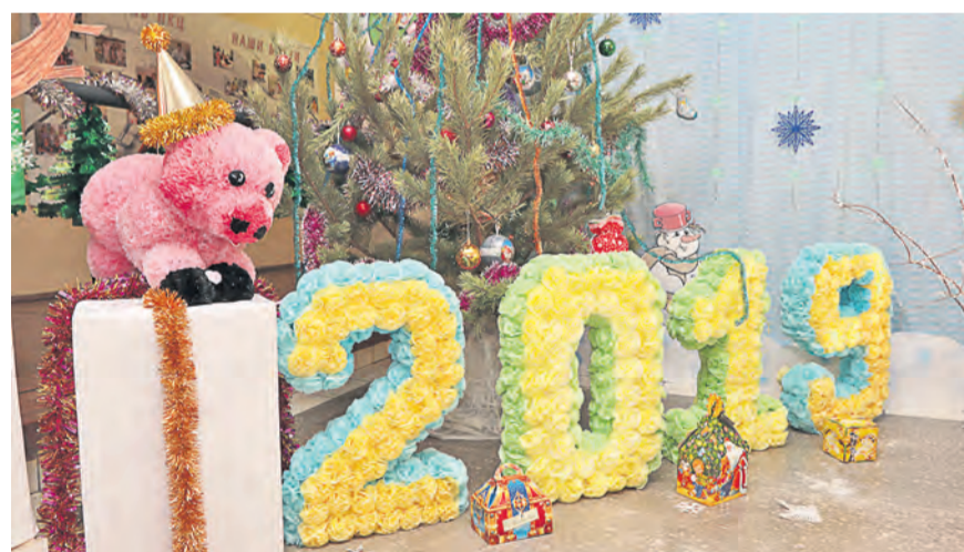
Экспозиция из гофрированной бумаги украсила ПКЦ

Марина Валгуснова