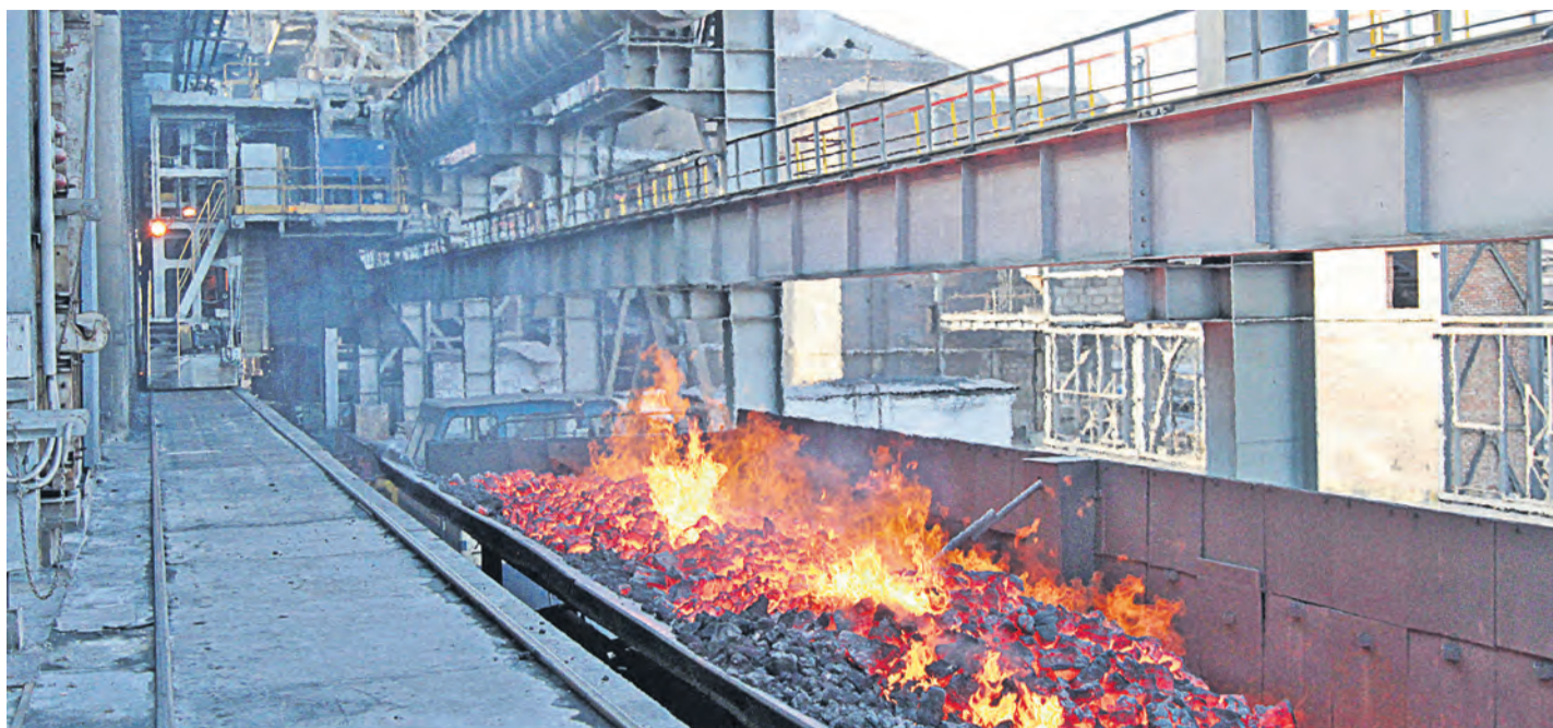
Идеи сотрудников КХП повышают надежность агрегатов и способствуют устранению конструктивных просчетов заводского оборудования