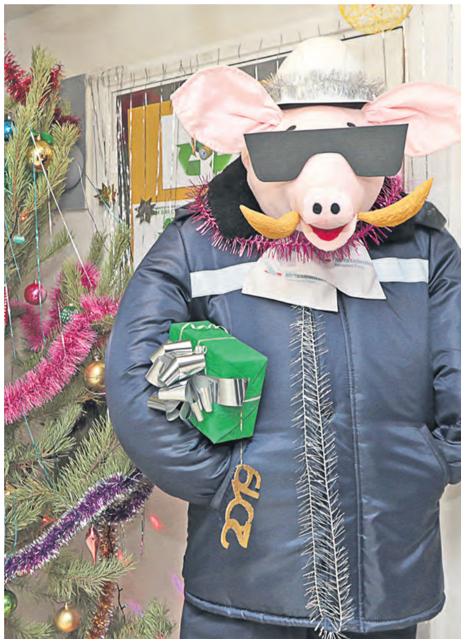
Чем не Джеймс Бонд? Этот персонаж встречает гостей в центральной лаборатории метрологии