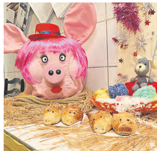
Аппетитные хрюшки от ЦТГС так и просятся на праздничный стол