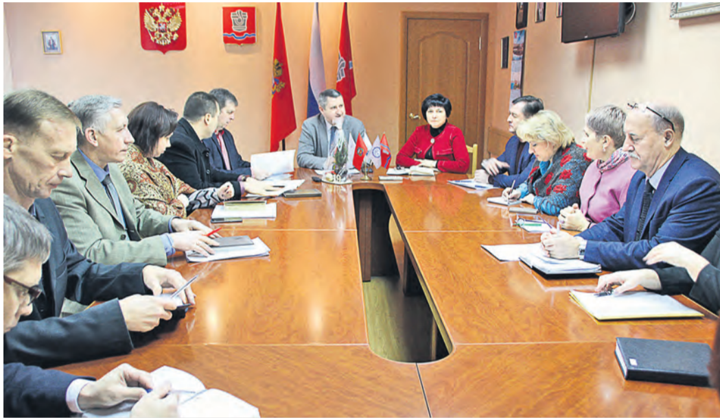
По благоустройству территории за Молодежным центром уже составлен приблизительный дизайн-проект

Так, в рамках национального проекта «Безопасные и качественные автомобильные дороги», инициированного правительством России и направленного на приведение в нормативное состояние сети автомобильных дорог субъектов РФ, Новотроицк вошел в состав Орской агломерации. Согласно проекту на эти цели