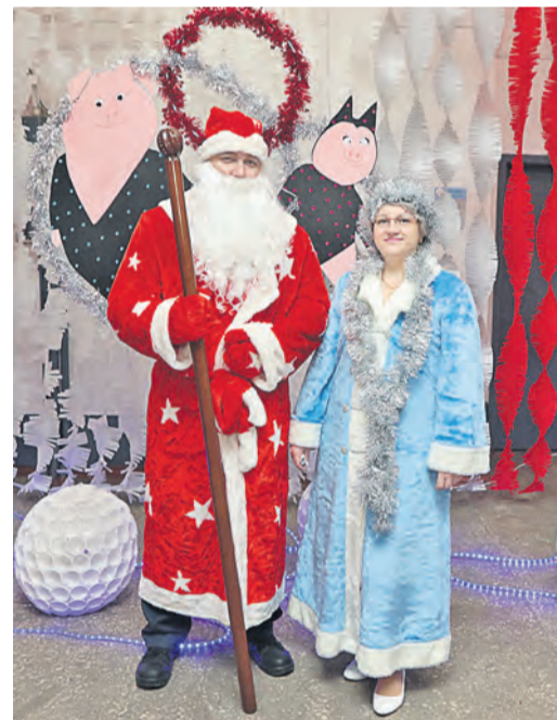
Механический цех порадовал веселой презентацией

Если верить народным приметам, то стоит потерять поросенку пятачок, и наступающий новый год непременно принесет благополучие, изобилие и материальные блага каждому, кто загадает желание. Наверное, умельцы предприятия тоже помнили об этой примете, поэтому постарались вложить в свое творение максимум любви – чтобы трудолюбивая хрюшка оценила старания.