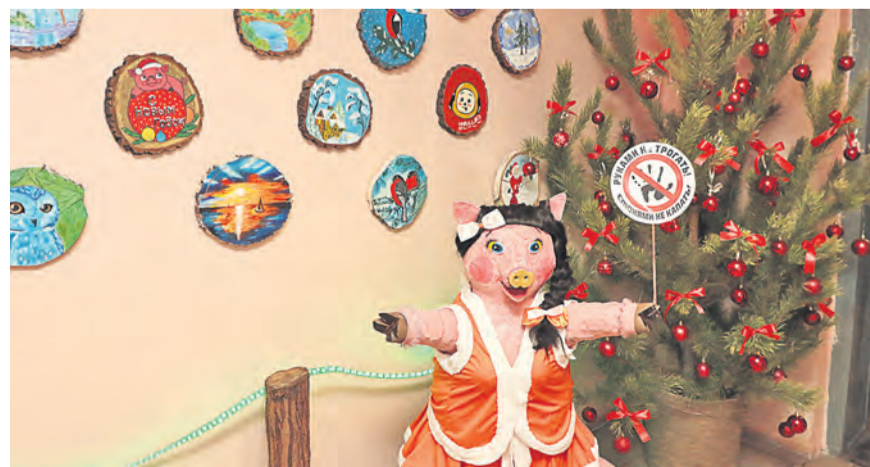
Оригинальные картины на спилах деревьев появились на стенах АБК ЦРМО