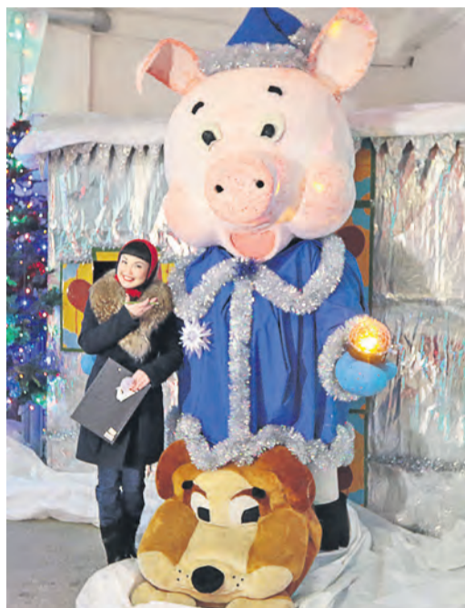
Символ года электриков, в два человеческих роста высотой, со световыми эффектами стал победителем

На Уральской Стали подвели итоги корпоративных конкурсов на лучшее новогоднее оформление административных зданий и символа года. Очаровательные свинки (талисманы наступающего 2019-го) всех мастей и размеров из самых невообразимых материалов поселились в структурных подразделениях комбината.