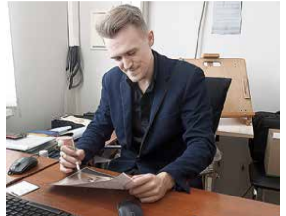
▲ На столе компьютеры, за спиной — мольберт: рабочее место современного художника редко выглядит иначе