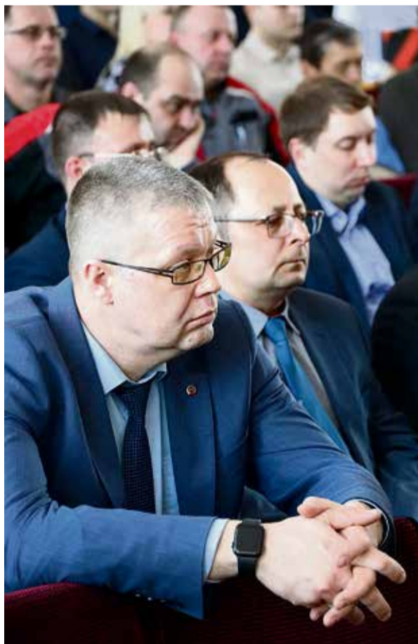
«Успех компании зависит от усилий каждого работника, об этом после разговора с руководителями Уральской Стали напомнят начальники всех уровней своим подчинённым»