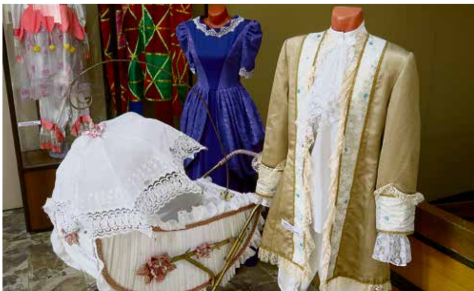
▲ В МКВ выставка театральных костюмов из коллекции Орского драмтеатра будет работать до конца марта