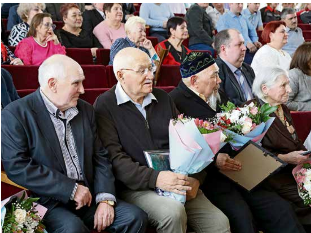
▲ В первых рядах в день праздника — те, кто десятилетиями своим трудом поддерживал жар обжиговых машин — ветераны аглофабрики

В первых числах марта 60-летний юбилей отметил и агломерационный цех Уральской Стали