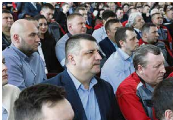
«У каждого участника собрания есть свой пример позитивных изменений, которые произошли за год»