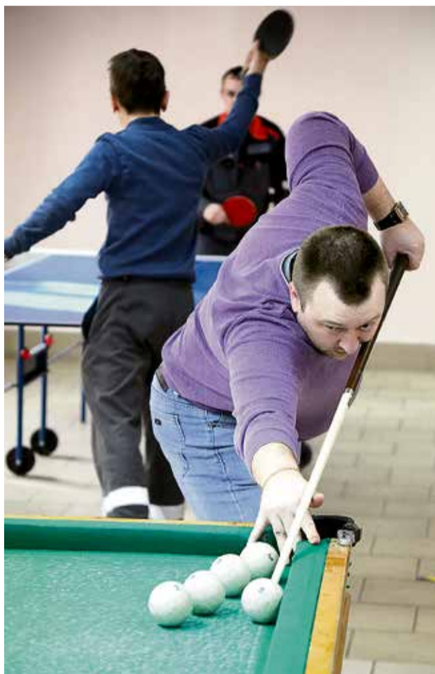
▲ Пока одни игроки соревновались, у кого лучше бильярдный глазомер, другие удивляли скоростью реакции в настольном теннисе

◀ Кажется, эти девушки слишком буквально восприняли пункт правил о том, что стрельба — командный вид спорта