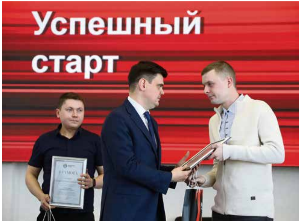
▲ В этом году несколько человек получили грамоты и стали одними из самых молодых их обладателей — их стаж работы не превышает года. И верим, эта грамота станет для них не последней на Уральской Стали

Инвестиции в производство важны, но никакие производственные свершения невозможны без личного вклада самих металлургов. За большой вклад в повышение эффективности деятельности предприятия,