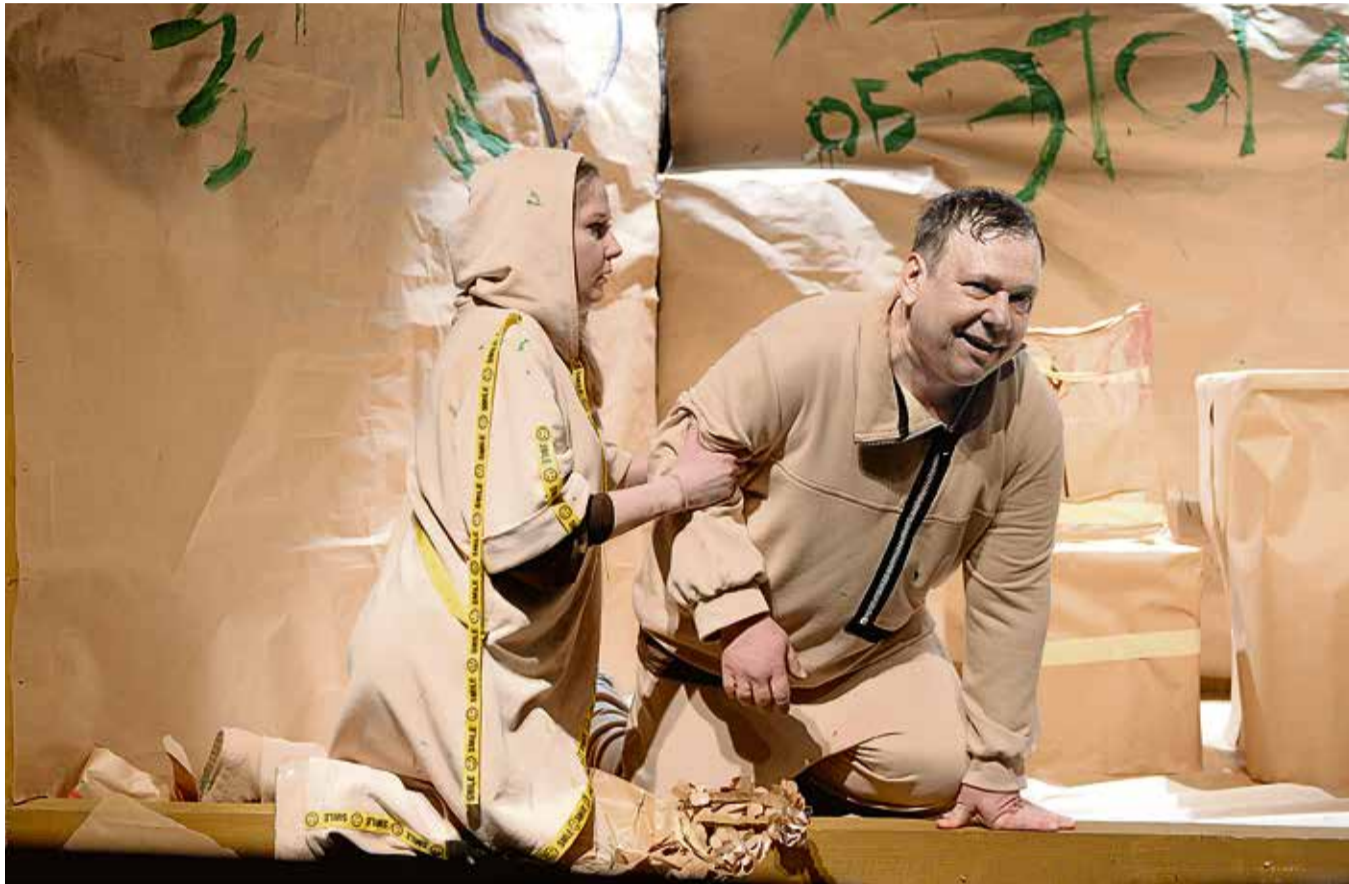
▲ Сцена из «Флорентийской трагедии»: отсутствие ярких цветов в постановке тоже может работать на концепцию спектакля

В музейно-выставочном комплексе Новотроицка проходит выставка костюмов Орского драмтеатра