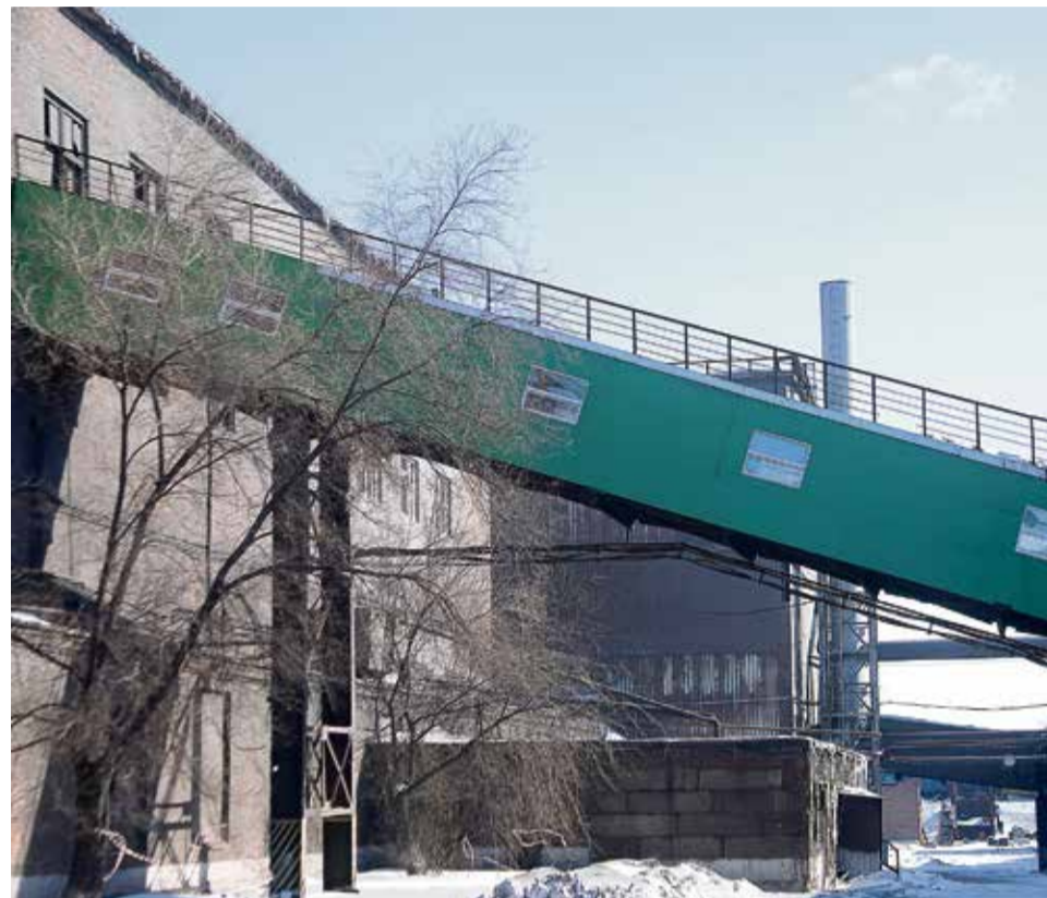
▲ Цветовое разнообразие галерей поможет сориентироваться на местности даже тем, кто пришёл в цех совсем недавно

— Меня устроил своей логичностью подход к