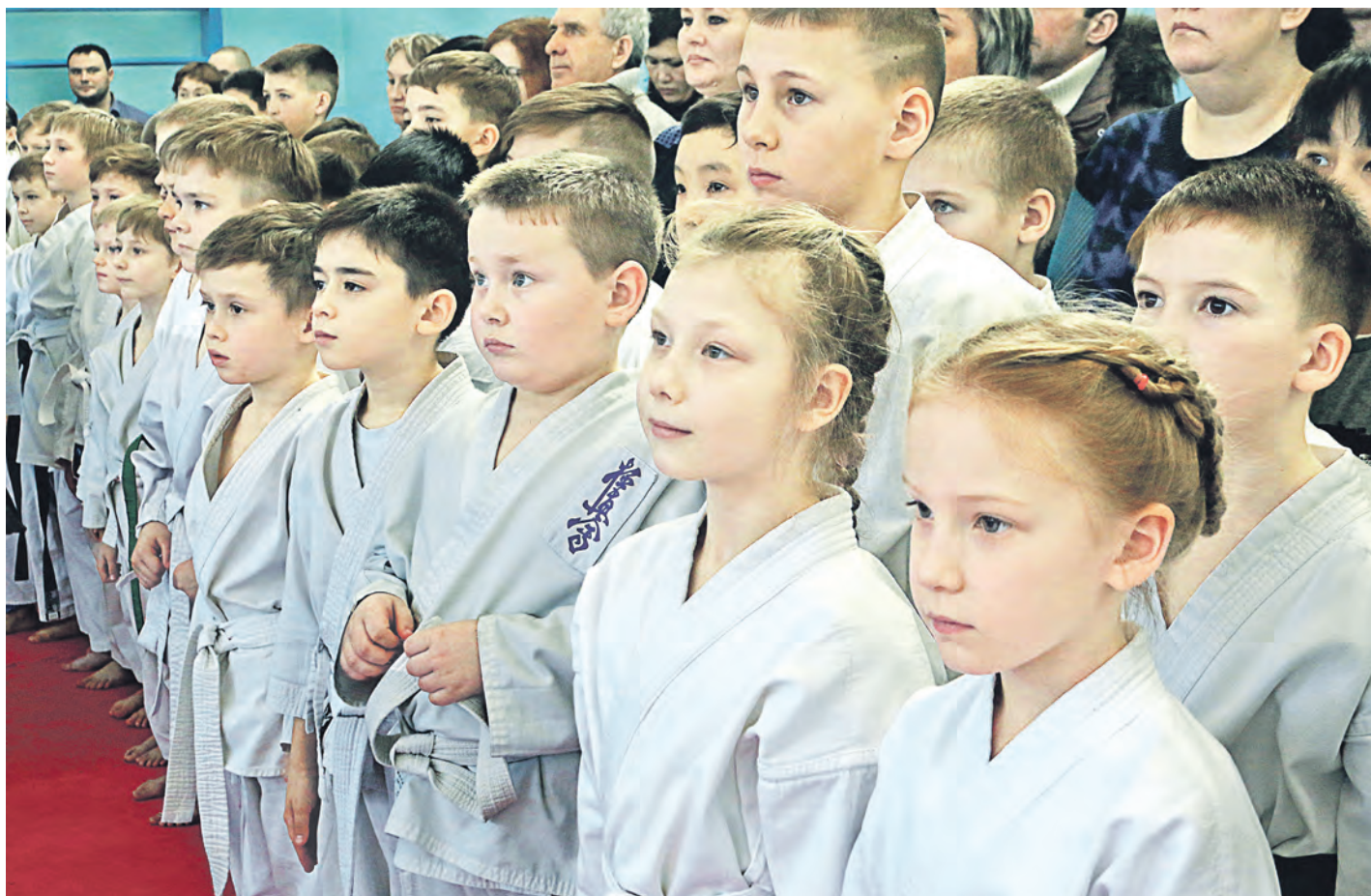
Мы станем чемпионами!

В филиале гимназии (бывшая школа №1) во второй раз прошло первенство города по кобудо, посвященное памяти погибших в борьбе с международным терроризмом. На татами вышли 260 новотройчан от пяти до 20 лет.