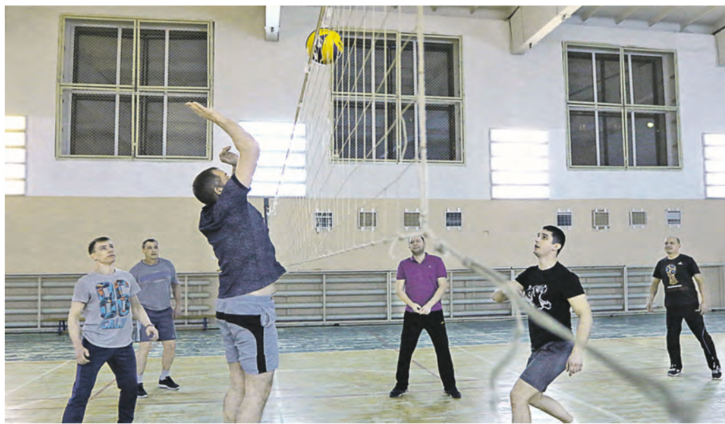
Престиж выигрыша в таких турнирах чрезвычайно высок – победителем остаешься до следующего юбилея

Поймав фарт, команда РСС попыталась взять верх и в турнире по перетягиванию каната. Но тут непреодолимой преградой на пути к победе встала