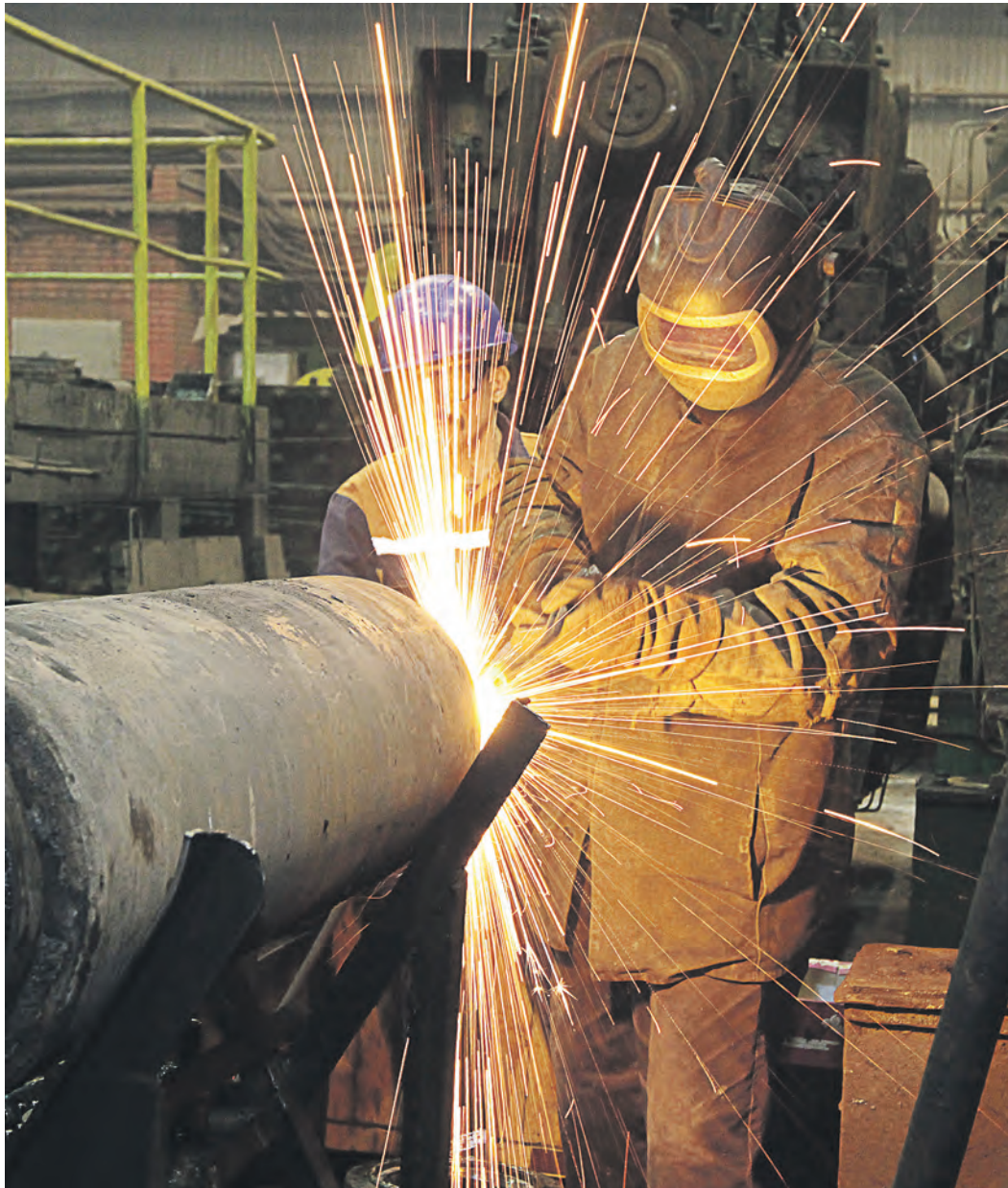
Высокий уровень техники безопасности в ЦСО СП – приоритет персонала

В том же году произведена модернизация коллекторов вторичного охлаждения на секциях №1, 2 блюма 330x470,