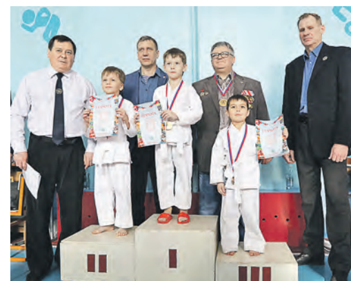
Как сладок ты, момент триумфа! И не забыть тебя никогда

К обудо – единоборство, которое требует особой выносливости. Ведь на бойце защитная амуниция, которая ложится на атлета дополнительным весом. У девочек с длинными волосами может возникнуть проблема с шлемом. Во время боя он может сдвигаться, и если ты неправильно просунула хвостик косички, это вызовет боль.