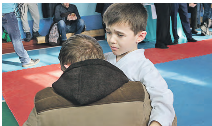
Думаете, что я от боли расплакался... Да боль-то – пустяки... Это слезы обиды... За проигрыш