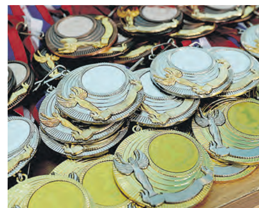
Вот они, заветные трофеи. Немало участников турнира получат сегодня первую в жизни медаль