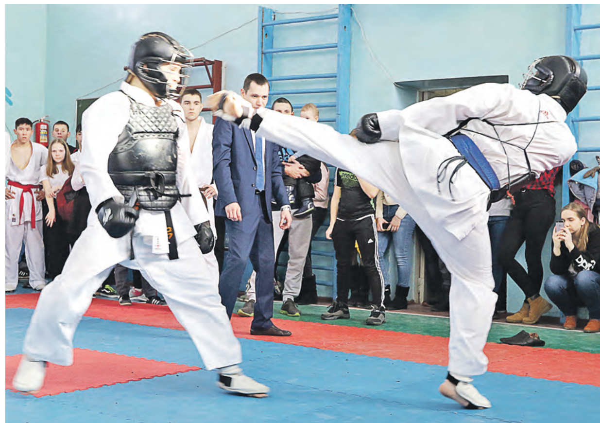
Есть и такой способ не подпускать соперника слишком близко. Так и держать его на расстоянии вытянутой... ноги

Александр Викторов