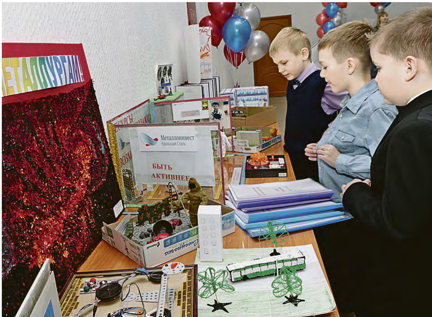
На суд жюри были представлены десятки работ, выполненных в различных техниках

В четверг в актовом зале УКК Уральской Стали состоялась церемония награждения призеров и участников конкурса профориентации на тему «Проект будущего рабочего места».