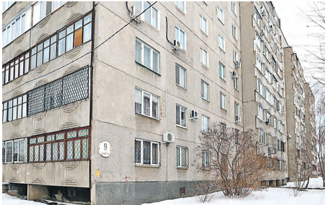
Неожиданно каждый из собственников огромного дома задолжал коммунальщикам по несколько тысяч рублей

долгом расплатились они. Пенсионеры решили не торопиться с оплатой счетов за отопление, тем более, что эти суммы составляют половину или более половины их пенсии. Причина такого роста вскоре выяснилась: оказалось, вышел из строя общедомовой прибор учета тепловой энергии. Год назад, в феврале 2017 года. Никто из представителей коммунальной службы за год