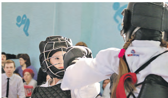
Да, у меня сильный удар, подруга. Но ничего личного – это просто кобудо. Выйдем с татами и будем вновь не разлей вода