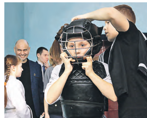
Шлем и девчончьи косы только на первый взгляд кажутся несовместимыми. Одно другому не помеха