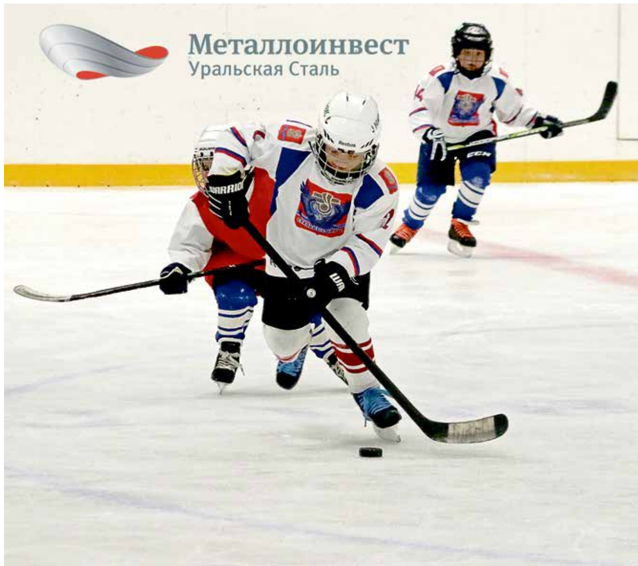
▲ «Стальные орлы» — продолжатели хоккейных традиций, заложенных их дедами из «Металлурга», «Строителя», «Химика» и НОСТЫ

Хоккеисты ДЮСШ «Олимп» взяли в Екатеринбурге «Кубок первоклассника» — именно так назывался турнир, собравший шесть команд из игроков 2012 года рождения.