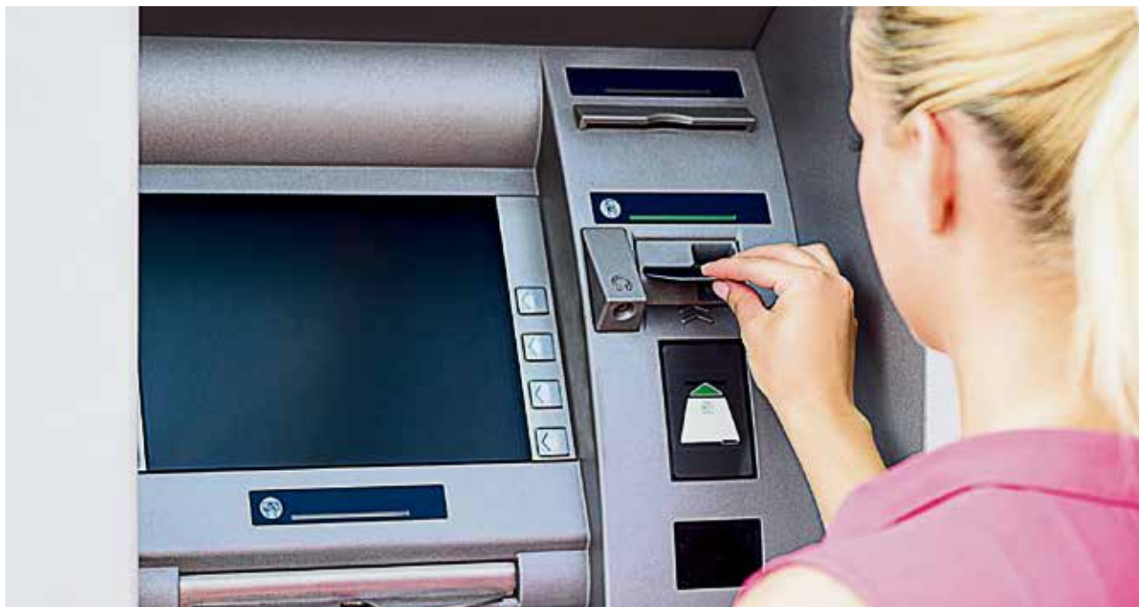
▲ Время от времени даже голосовое напоминание о необходимости забрать карту не спасает от забывчивости

В Новотроицке возбуждено уголовное дело по факту мошенничества с использованием электронных средств платежа.