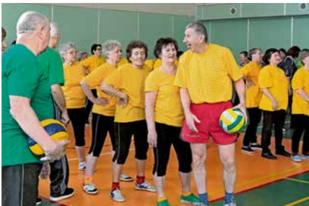
▲ Нам не до скуки! Заразительный пример активного и здорового образа жизни демонстрируют на протяжении многих лет пенсионеры