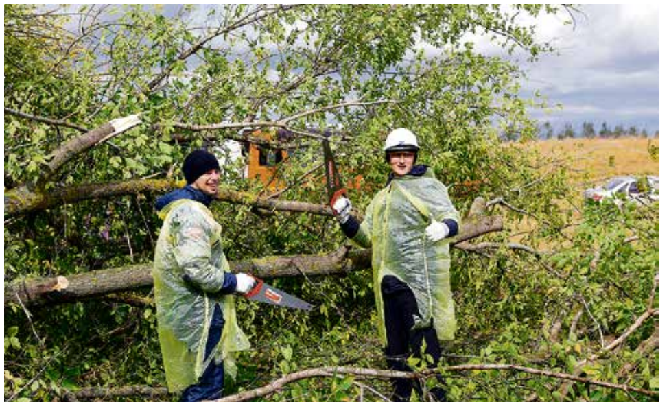
▲ Если клён ясенелистный не истребить, экосистема степи исчезнет в результате биологического загрязнения

Для погружения в тему волонтерства одной теории мало, поэтому большую часть первого дня отвели практике. Для участников слёта организовали тренинги по трём направлениям «Мотивация», «Командное взаимодействие» и «PR и медиа». Разобраться в себе, понять ис-