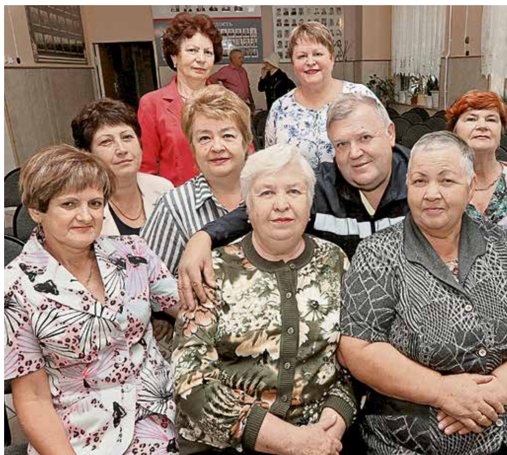
▲ Ветераны комбината всегда активны. С энтузиазмом принимают участие во всех корпоративных мероприятиях Уральской Стали

Сейчас в работе молодые. Время не ждёт — бегут года. Волнует душу ностальгия, Я с цехом мысленно всегда.