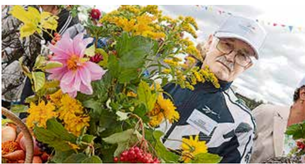
▲ Ветераны Уральской Стали — активные участники ежегодного конкурса «Добрым людям на загляденье»