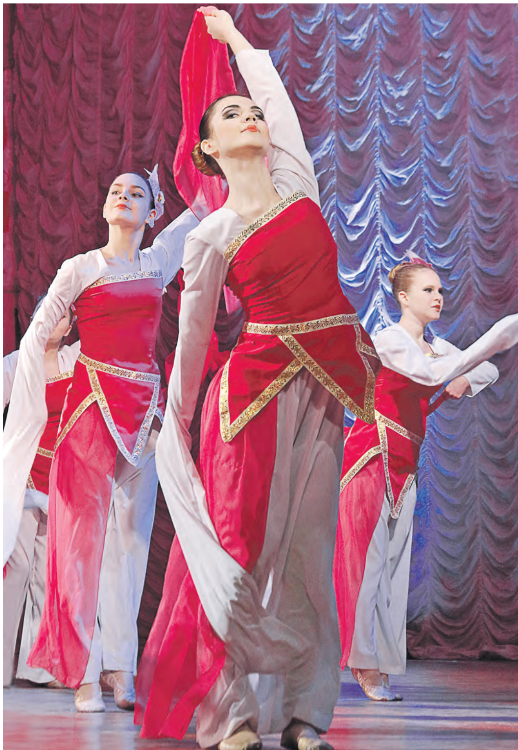
Танцы – традиционный конёк артистов Дворца культуры металлургов

В минувшую субботу Новотроицк стал точкой отсчета XXVIII областного фестиваля народного творчества «Обильный край, благословенный!». У нас выступили также Орск, Гай, Новоорск.