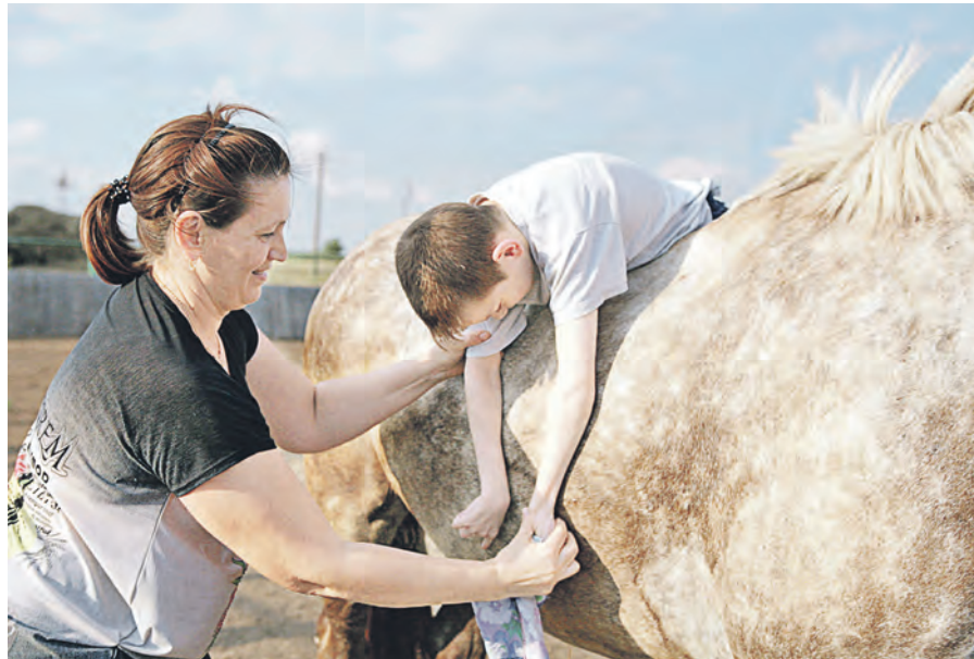
Занятия иппотерапией для детей с проблемным здоровьем ведутся здесь с лета 2016 года