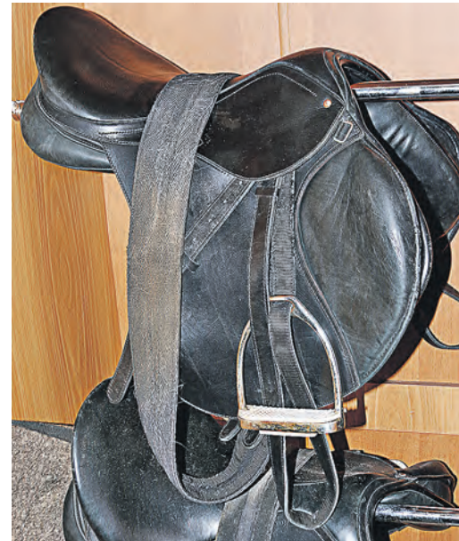
Кожаные седла словно произведения искусства