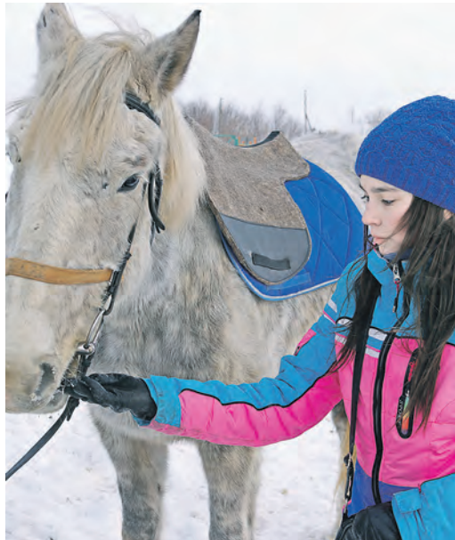
Морковка и сахар – любимое лакомство лошадей

Новотроицкое станичное казачье общество стало победителем конкурса грантов президента Российской Федерации на развитие гражданского общества.