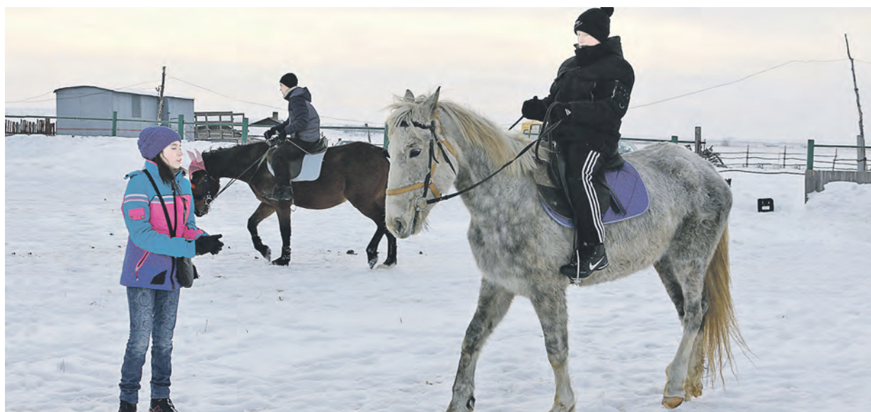
Управлять лошастью – задача не из легких, в этот момент работают все мышцы