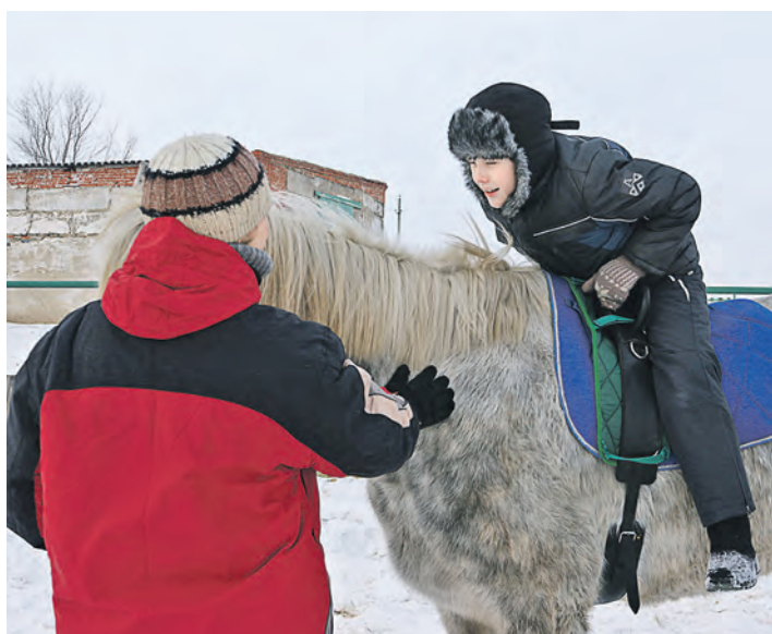
Допуск к занятиям оформляется врачом