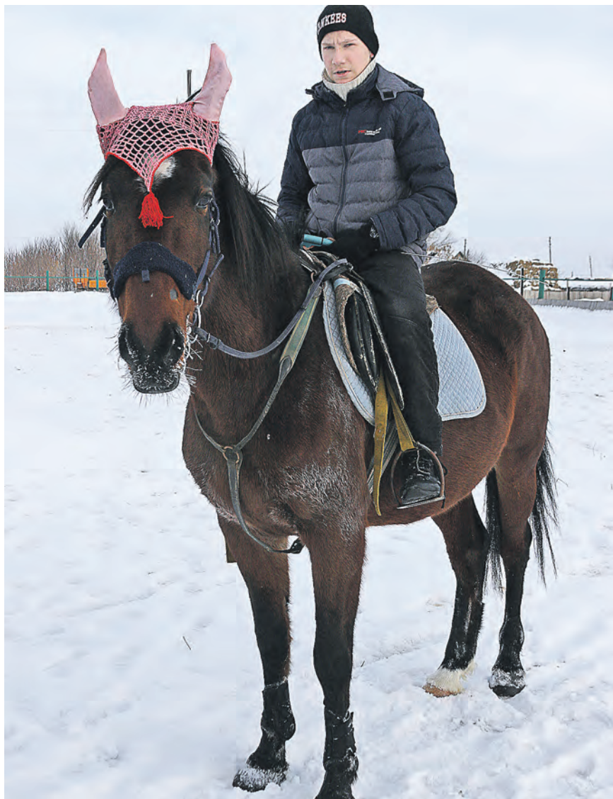
Верховая езда – это красиво

П роjekt «Сивка-Бурка» уже начал свою реализацию в поселке Старая Аккермановка. Благодаря президентскому гранту проект по иппотерапии, направленный на проведение занятий по лечебной верховой езде с детьми-инвалидами, не прекращает работу, а наоборот, расширяет границы. Теперь, кроме лечебных занятий, инструктор проводит еще и спортивно-оздоровительные тренировки.