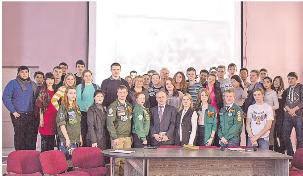
Десятки лет студенты Оренбуржья не прерывают традиции стройотрядовцев