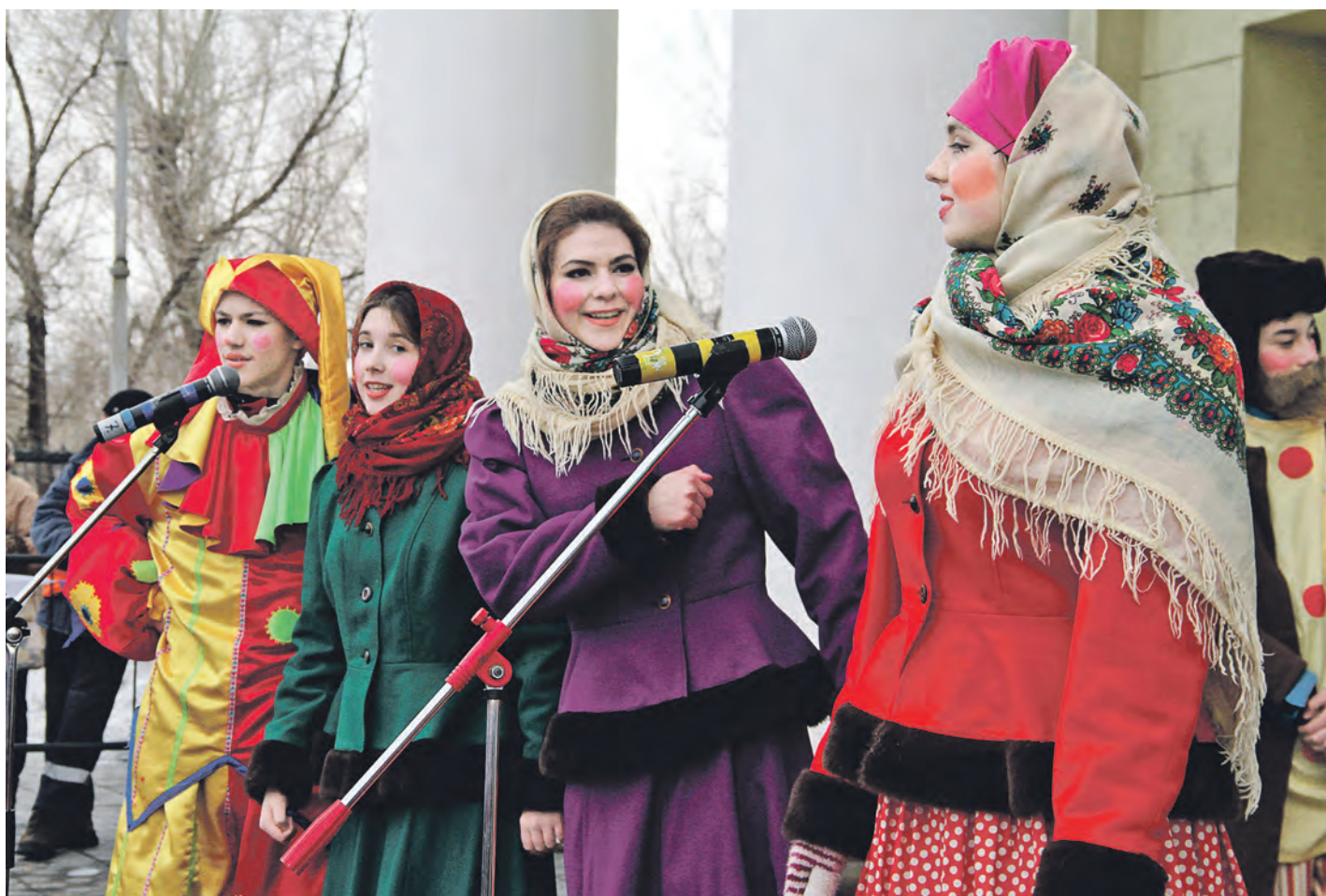
Масленица (справа) быстро нашла общий язык со скоморохами из новотройцкого Молодежного театра-студии, которые вели праздничную программу

Как ни злилась нынешняя зима, пришел ее срок уходить со двора. Весна пришла строго по расписанию и всю Масленичную неделю теснила зиму-старуху оттепелью да капелью.