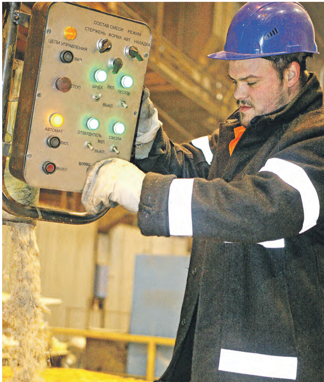
Работа вокруг формовочных установок не замирает ни на минуту

Первую продукцию фасонно-литейный цех выдал 28 октября 1958 года. С тех пор мини-завод внутри комбината, обладающий собственными сталеплавильными мощностями, шагнул далеко вперед. Долгое время он был самостоятельным подразделением, память от которого осталась в наименовании главной проходной комбината «Фасонно-литейная», а в 2011 году стал частью механического цеха. Сегодня здесь производится продукция не только для нужд комбината, но и для сторонних потребителей. Изделия литейного участка механического цеха на складах не пылятся – 2/3 готовой продукции