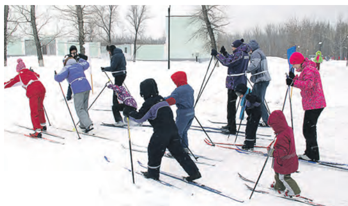
В семье стараются все – место определяется по последнему финишу

Д а, праздничного настроения не смог испортить сильный ветер. Лыжники не чувствовали его пронизывающего дыхания, а для обогрева зрителей предоставлялся автобус.