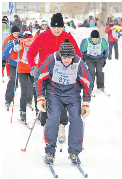
Лыжам, как и любви, все возрасты покорны...