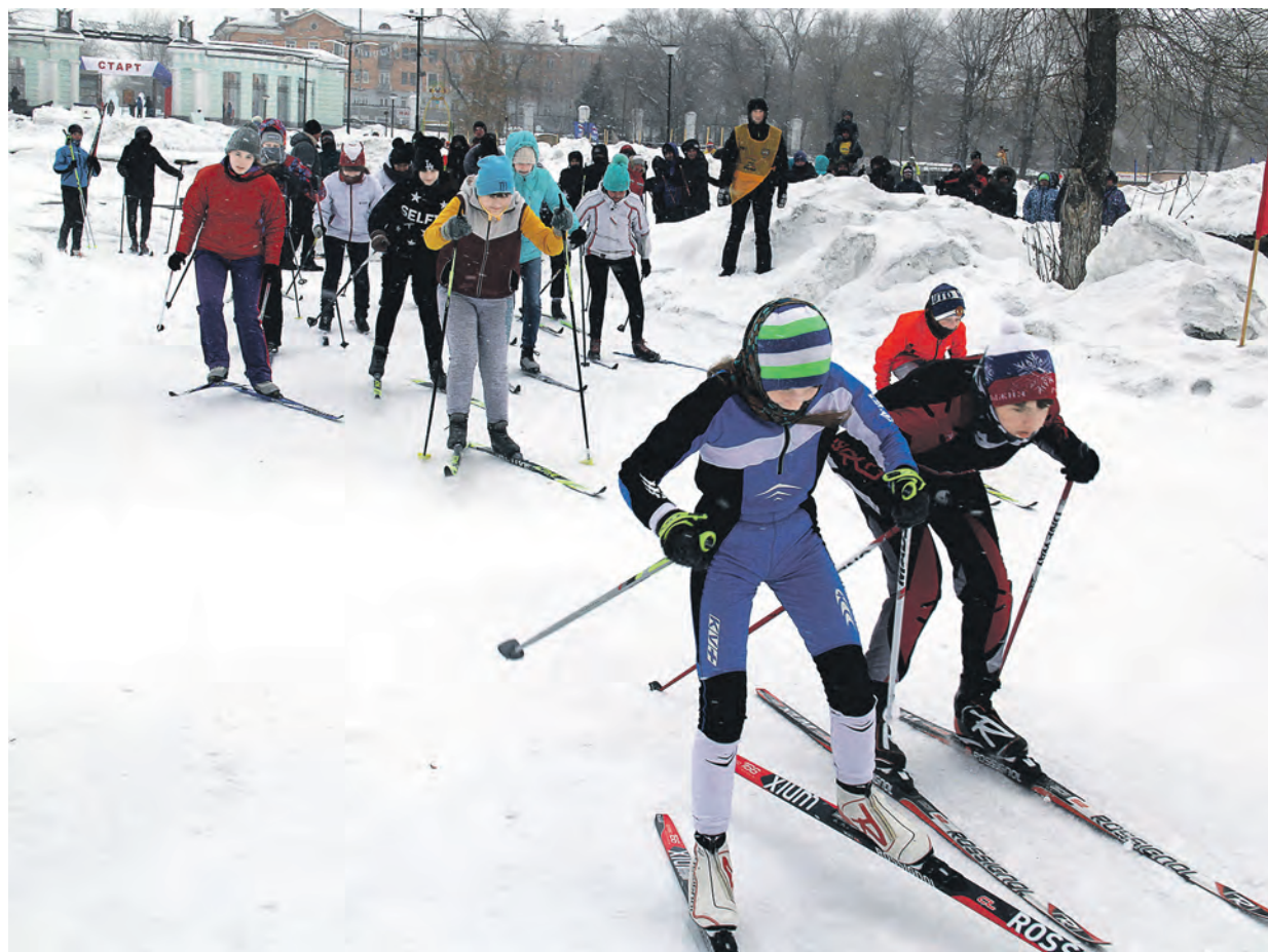
Старт школьников на «Лыжне России» можно смело назвать масс-стартом

Погода не баловала участников состоявшейся в городском парке Новотроицка Всероссийской массовой лыжной гонки «Лыжня России-2017». Но разве может сильный ветер помешать закаленному народу – уральцам! На старт вышли 400 спортсменов.