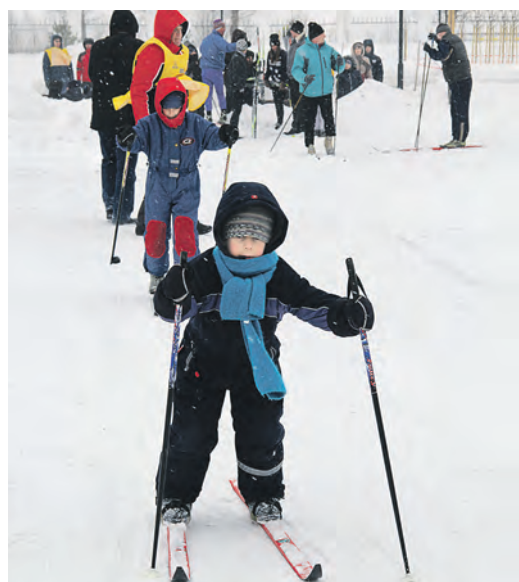
...ими увлекаются новотройчане всех поколений