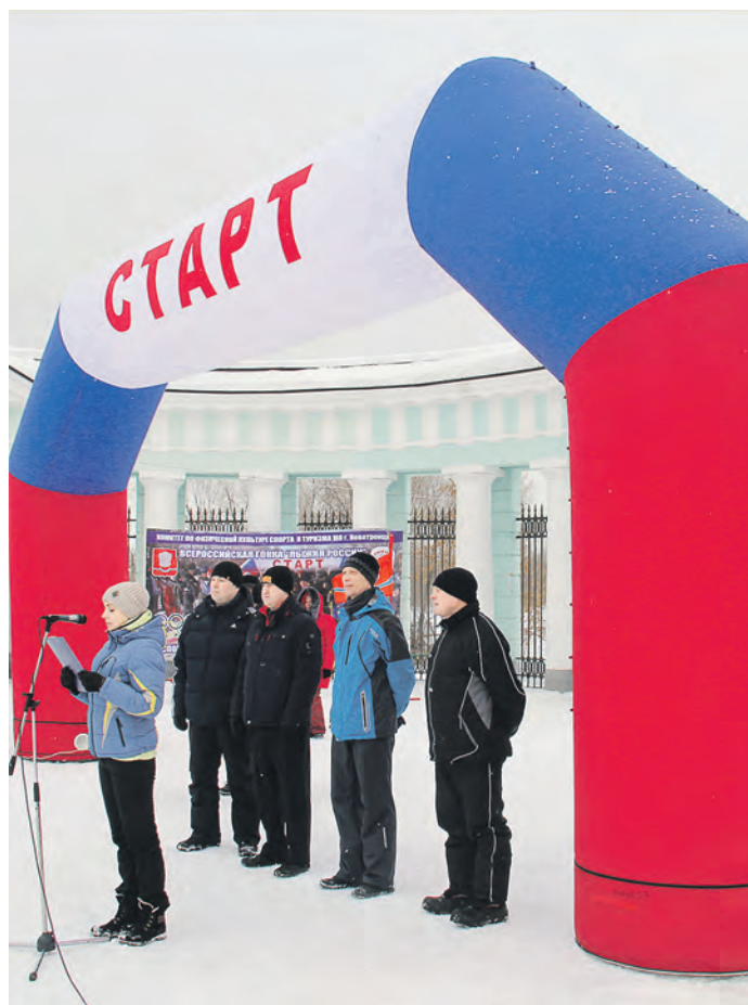
Традиционное напутствие перед стартом звучит на площади Metallургов