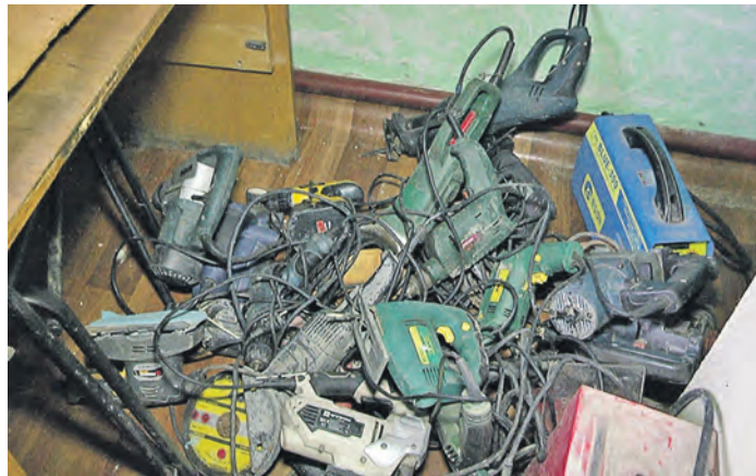
Улов гаражных «гастролеров» традиционен: инструменты и автозапчасти

Но теперь подробнее об этом резонансном деле. Следствием было установлено, что четверо новотройчан, предварительно сговорившись, решили обогатиться за чужой счет. Первые преступления относятся к маю 2015 года.