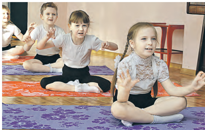
Основные элементы йоги – позы и дыхательные упражнения

– Изучение литературы, посвященной вопросам физического воспитания, позволило нам прийти к выводу о том, что занятия йогой благотворно влияют не только на весь организм, но и психику. Йога способствует развитию таких