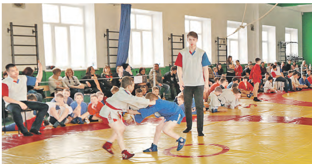
Размеры нового зала позволяют проводить схватки на двух коврах одновременно. Турниры стали динамичнее