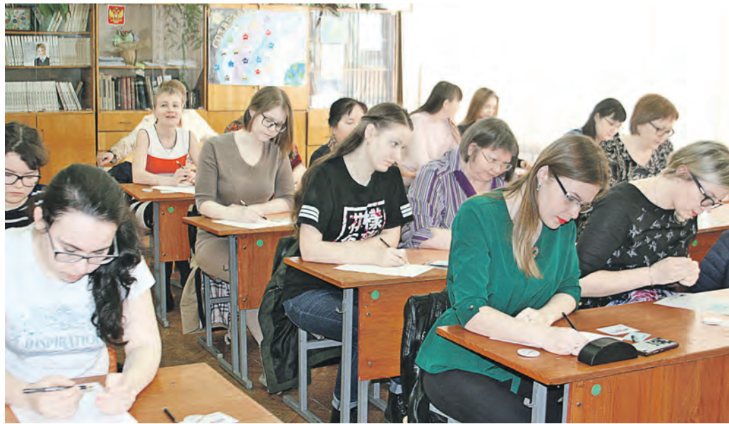
Площадкой Тотального диктанта может служить и обычный класс, как получилось в школе №22

И участники, и филологи признаются, что текст этого