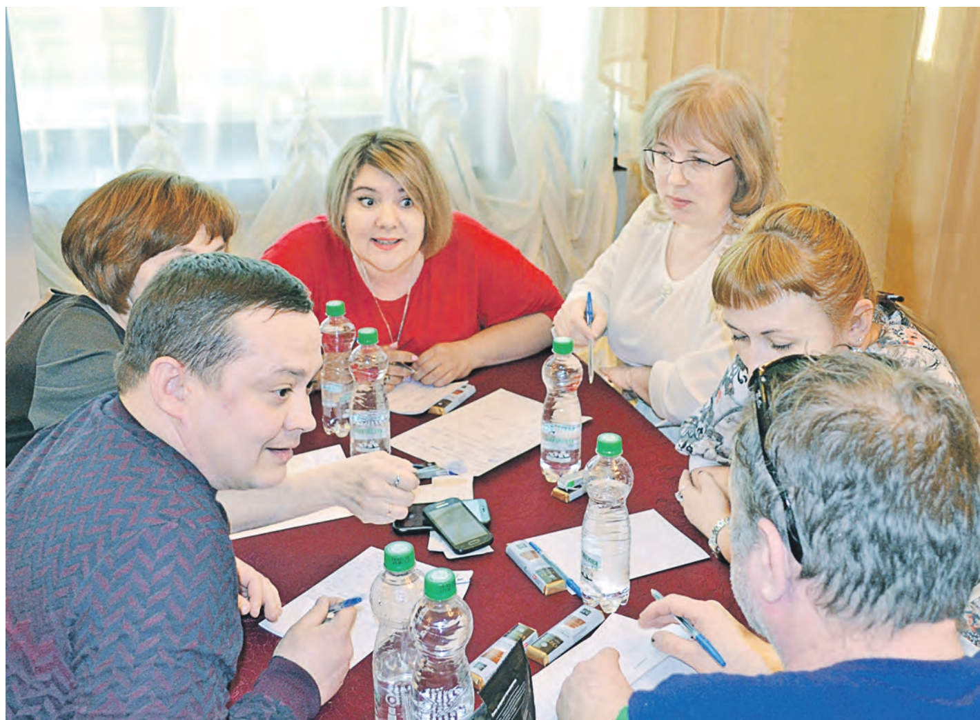
В жарких дебатах рождается истина: в игре – команда ЦРЭНО

В городском арт-кафе «Чехов» прошел интеллектуальный турнир в формате любимой многими игры «Что? Где? Когда?» среди членов профсоюза Уральской Стали.