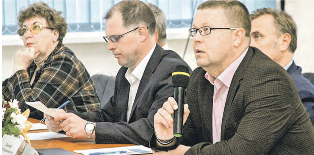
В финальном этапе НТК-53 лучшие работы участников будет оценивать строгое жюри

– Я бы отметила, что научно-техническая конференция в этом году отличается от предыдущих количеством заявок, – комментирует ситуацию начальник отдела