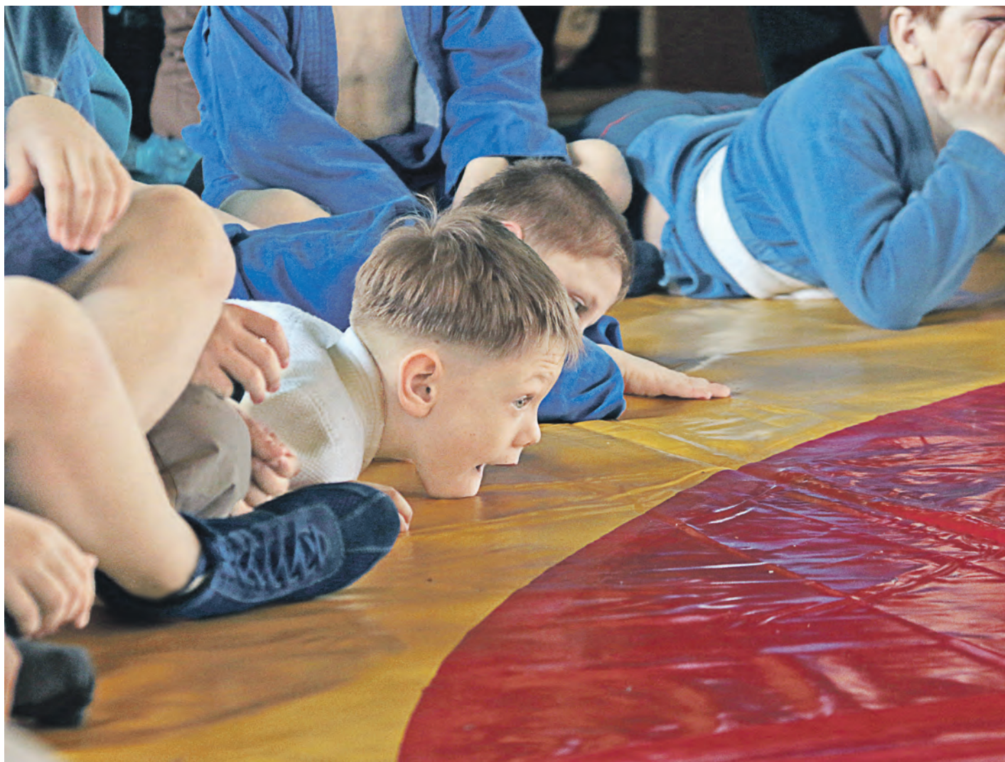
Это только кажется, что я за линией ковра. На самом деле я весь там, в схватке

Недавно борцовский клуб «Самбо-78» Центра развития творчества детей и юношества отпраздновал новоселье. Мальчишки и девчонки переехали в просторное помещение на Комсомольском проспекте, отремонтированное на средства Металлоинвеста.