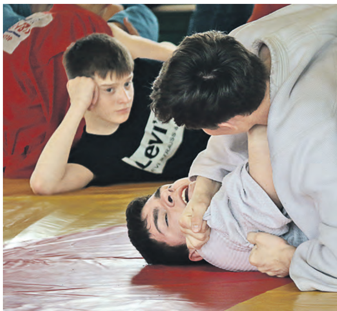
Самбо без болевых и удушающих приемов – не самбо!

Занимаюсь в клубе всего полгода. Секреты самбо мне пока раскрываются нелегко, но тренеры разрешили мне участвовать в турнире. Так что можете меня поздравить с первым соревнованием. Если проиграю, то расстроюсь, конечно. Но у меня все еще впереди, будут и победы.