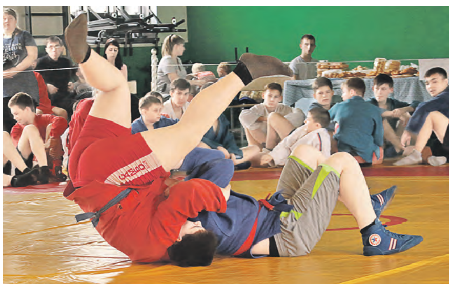
Там где-то «мельница» крутится-вертится...