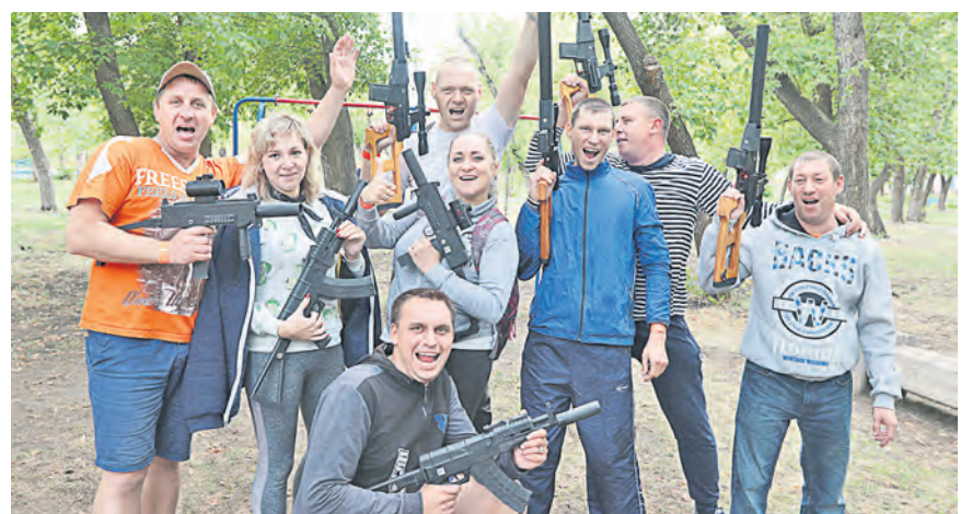
Лазертаг – игра для настоящих мужчин... и прекрасных девушек!