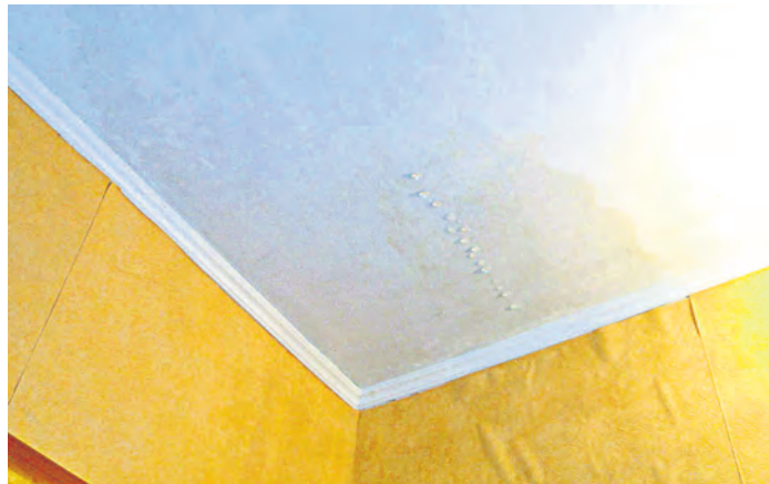
После кровельных работ в квартире случился потоп

После ремонта крыши многоквартирного дома во время капитального ремонта квартиры жительницы на девятом этаже дважды затапливало, едва только полили дожди. Хозяйка жилья подготовила иск к фонду капитального ремонта, потребовав возмещения ущерба за испорченное имущество. Причем гражданке пришлось доказывать, что вздувшиеся полы и мокрая мебель в ее квартире – это следствие ремонтных работ. Экспертиза подтвердила это и оценила стоимость приведения квартиры в порядок в 68 тысяч 394 рубля. Кроме этой суммы, дама требовала компенсацию за экспертизу. Фонд капремонта добровольно платить гражданке отказался, заявив, что мокрая квартира – вина подрядной организации, проводившей ремонт, – с ней и судитесь. И пошли судебные процессы в разных инстанциях, пока все точки над «i» не расставил Верховный суд