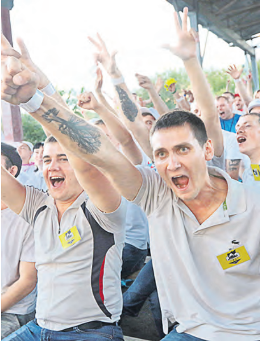
Молодежный профсоюзный фестиваль – время бурных эмоций и проявления чувств!

Апогеем профсоюзного фестиваля стали полевая игра лазертаг и квест «Форт Боярд». Последний – аналог популярного телешоу – во многом повторял задания оригинала. 11 станций предстояло преодолеть за 2,5 часа, цель каждого испытания – раздобыть ключ, который доставался далеко не всем.