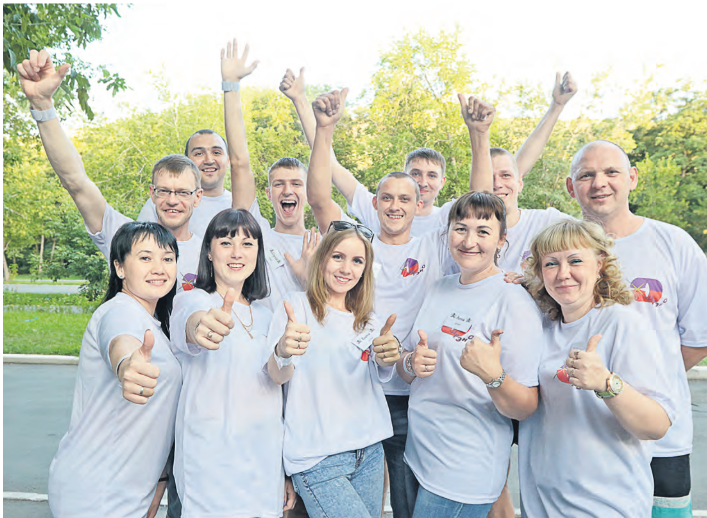
Команда ЦРЭНО получила приз в творческом конкурсе в номинации «Лучшее представление»

В минувшие выходные в загородном лагере «Родник» отгремел профсоюзный молодежный фестиваль. И даже погода не смогла подпортить впечатлений от происходящего!