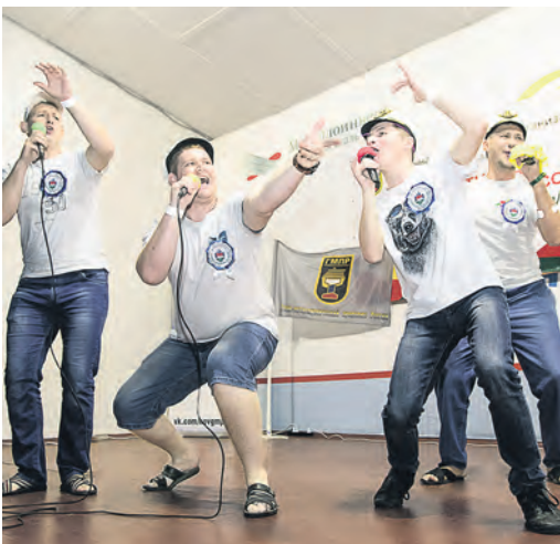
Чем не певец?! Карaoke-батл раскрывает таланты!