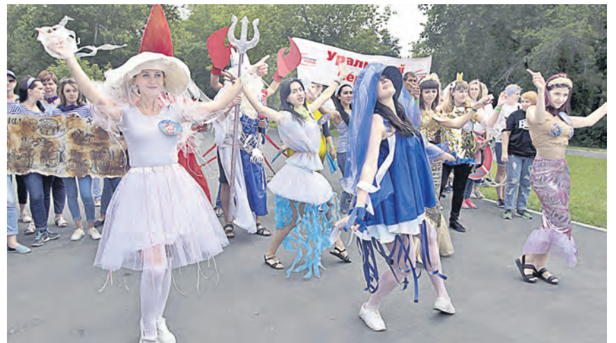
Зажигательные пляски морской «живности» от команды управления комбината