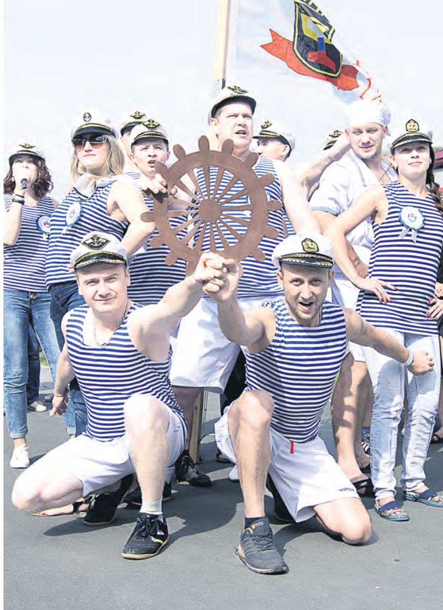
Эффектное представление листопркатчиков запомнилось всем!