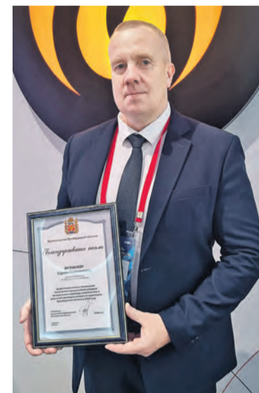
▲ Минувшей весной Уральская Сталь мгновенно пришла на помощь терпящим бедствие жителям Орска и Новотроицка. И этот вклад не остался незамеченным

По итогам работы выставки-форума «Газ. Нефть. Оренбуржье» Уральская Сталь собрала целую россыпь наград разного уровня.