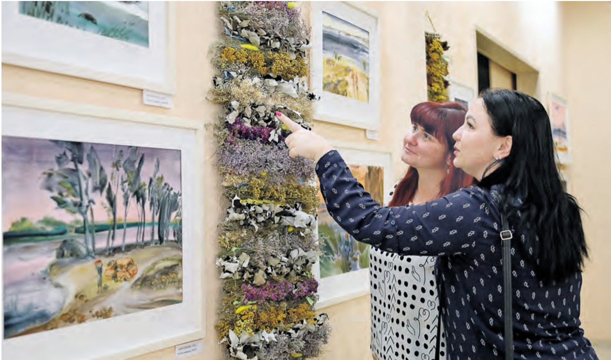
▲ На выставке зрители смогут поближе рассмотреть необычные композиции из трав, придуманные орской художницей