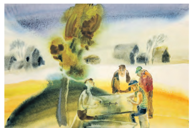
▲ Аquareль позволяет выделить только главное. Вот и эта картина буквально дышит летним зноем