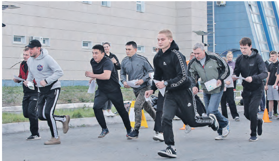
▲ Маршрут спортсмены выбирали сами. Чтобы добраться до финиша, победителю хватило неполных 23 минут

Каждую осень металлурги выходят на тропу для спортивного ориентирования