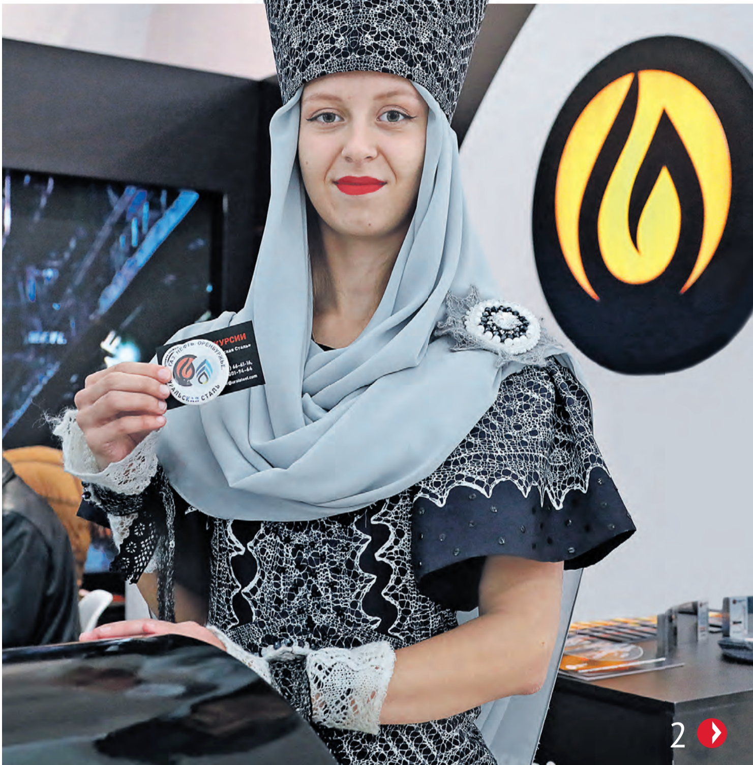
▲ В числе вопросов, которые обсуждали на выставке, — опыт Уральской Стали по продвижению промышленного туризма