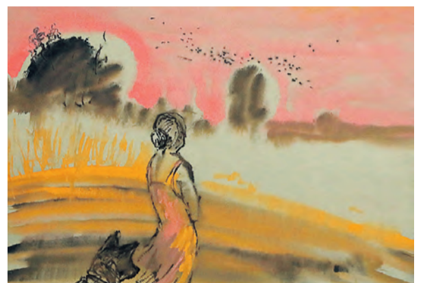
▲ Пожалуй, самая эмоциональная картина экспозиции — аллегория «Годы летят», написанная автором в прошлом году