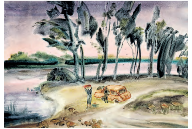
▲ Абсолютная достоверность изображения Изака не интересует: ей важнее передать настроение персонажей