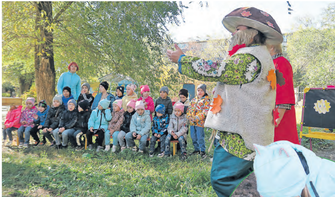
▲ Сказочный лесовик рассказал детям о привычках животных и о том, как правильно подкармливать их зимой