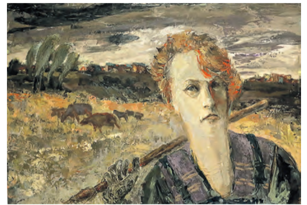
▲ Автопортрет Маргариты Изака пристально изучает зрителей с картины 2017 года «День художника»