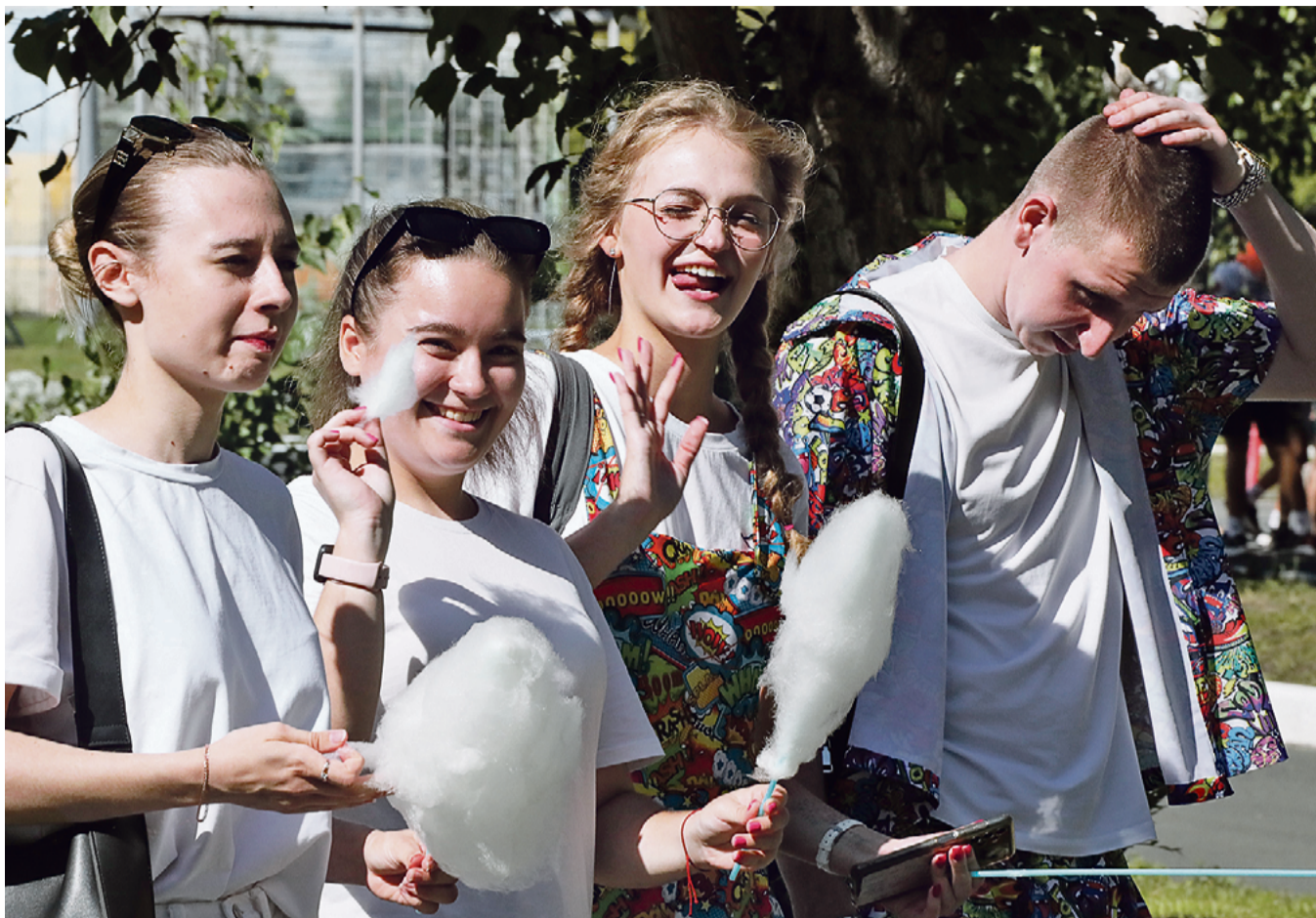
▲ В «Роднике» детей ждёт много спортивных и интеллектуальных игр: порция сахарной ваты даст для этого необходимый заряд энергии