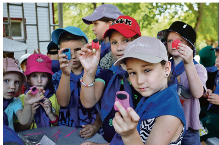
▲ Персонажей популярной игры Among Us дети вылепили из скульптурного пластилина. Застыв, он станет брелоком ручной работы