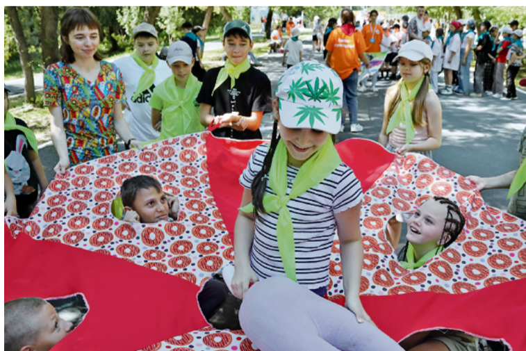
▲ В секторе для подвижных игр желающие могли проверить быстроту своей реакции, пытаясь уклониться от попыток ведущего осалить игрока

Лагерь «Родник» за лето примет пять детских смен по две недели каждая. Всего за лето в нём отдохнут и укрепят здоровье без малого 2 000 школьников.