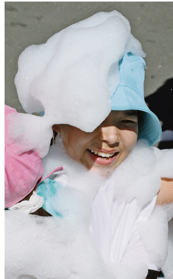
▲ Вернулась жаркая погода — самое время устроить пенное шоу без риска получить среди лета насморк или простуду