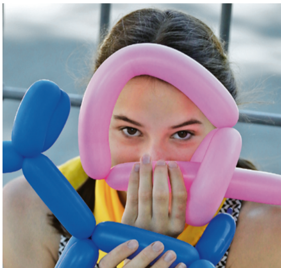
▲ Вернувшись из поездки в летний лагерь, дети смогут удивить родителей умением создавать забавные фигурки из надувных шариков

Путёвки в профильный заезд в этом году получили 336 детей. За двухнедельную смену их ждут оздоровительные процедуры и спортивные соревнования, интеллектуальные игры, конкурс рисунков на асфальте, познавательные мастер-классы и творческие конкурсы.