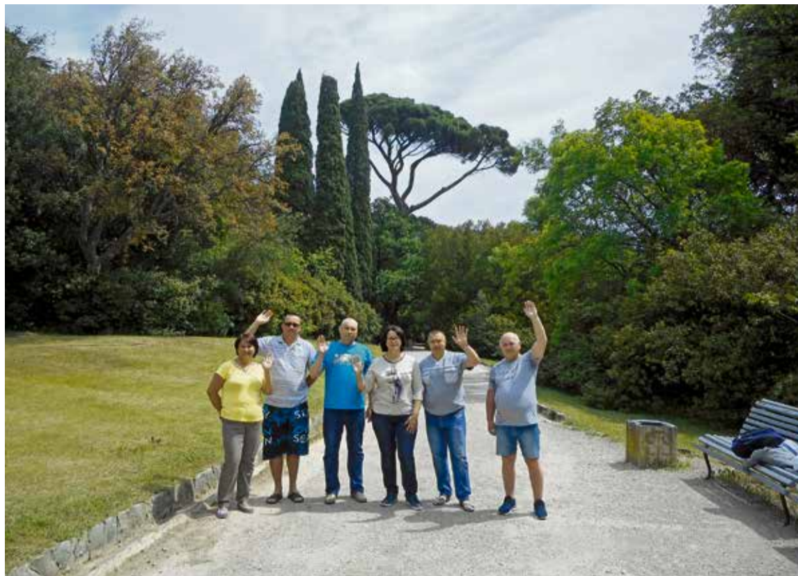
▲ Климат крымского побережья и эффективное лечение помогли новоотроицким металлургам в кратчайшие сроки вернуться к нормальной жизни

— Я ведь не только в Крым полетел впервые, — делится Но-