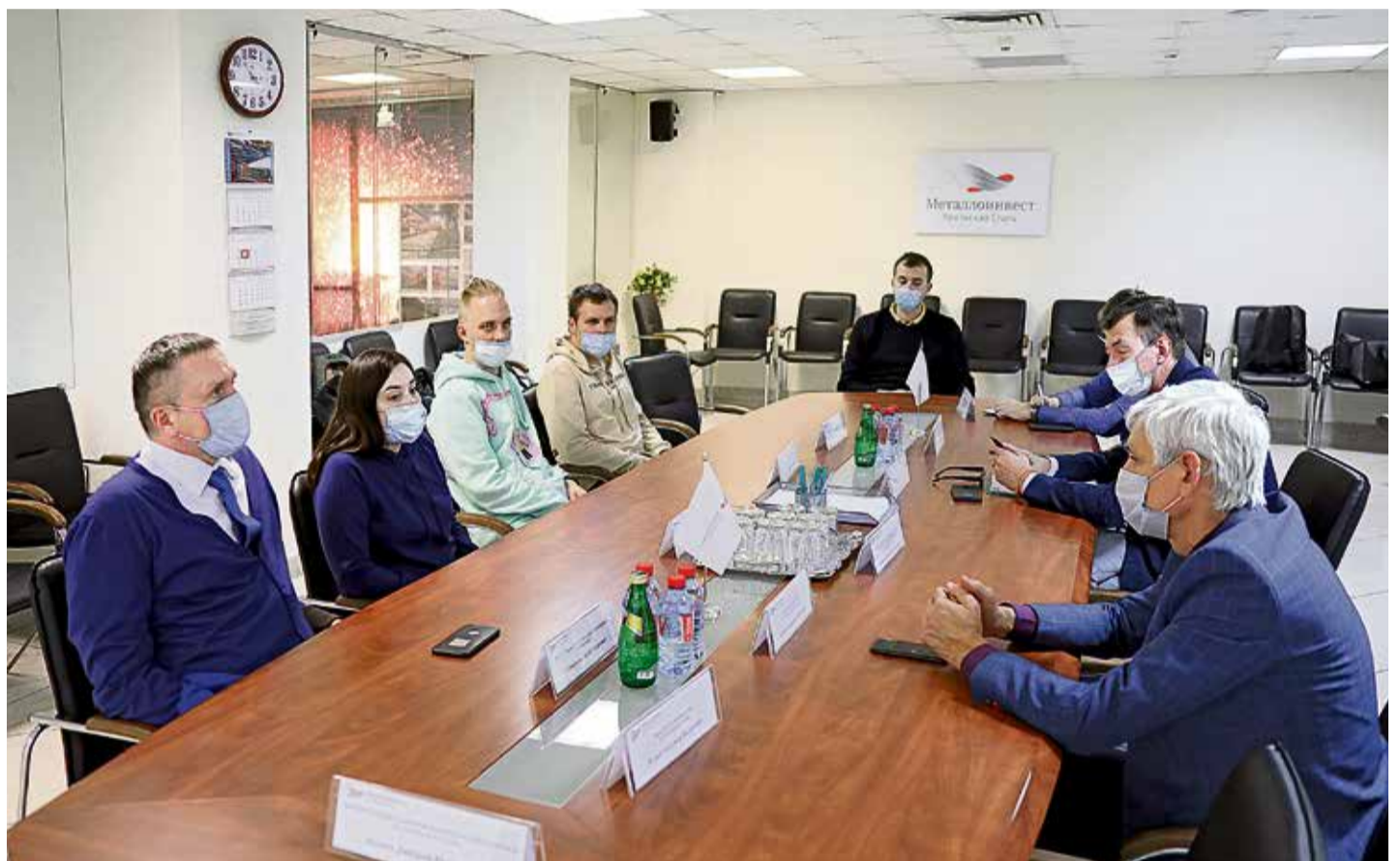
▲ Для гостей выдался очень насыщенным: экскурсия по комбинату, несколько рабочих совещаний, встречи с руководством и специалистами Уральской Стали