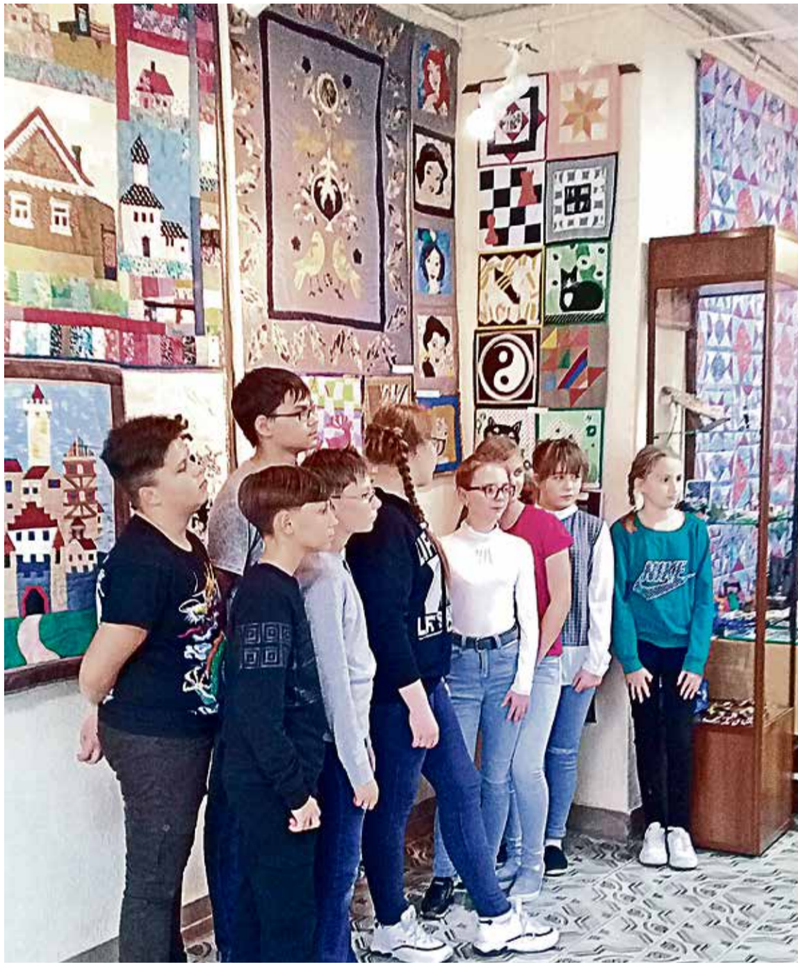
▲ Музейно-выставочный комплекс Новотроицка одним из первых в области стал работать с «Пушкинской картой»

— «Пушкинская карта» действует только при посещении мероприятий и выставок, одобренных Министерством культуры. Сейчас мы получили одобрение трёх начинаний — ознакомительного визита в МВК, экскурсии по