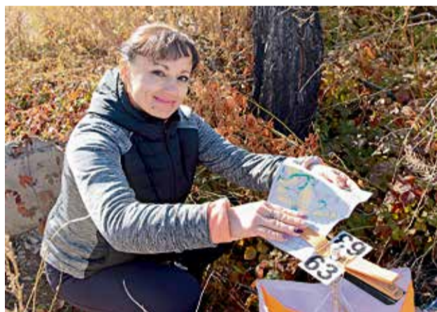
▼ Нашел КП, зафиксировал это в чек-листе — и вперёд, к следующей отметке на карте!

Какую бы тактику ни выбрали туристы, формула успеха в спортивном ори-