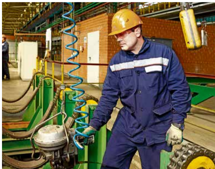
▲ Сегодня в цехе отделки проката 76 процентов идей по улучшениям подаются рабочими

Визуальной разметкой здесь выделены склады, дорожки, все опасные места, пешеходные зоны, участки, где работает оборудование. Все линии отделки оборудова-