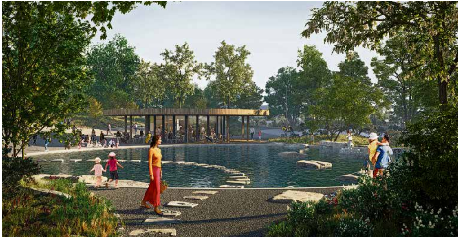
▲ Московское архитектурное бюро «Атлас» предложило необычный взгляд на формирование общественных пространств в Новотроицке

Новотроицк получит федеральный грант в размере 80 миллионов рублей на благоустройство Молодёжной аллеи.