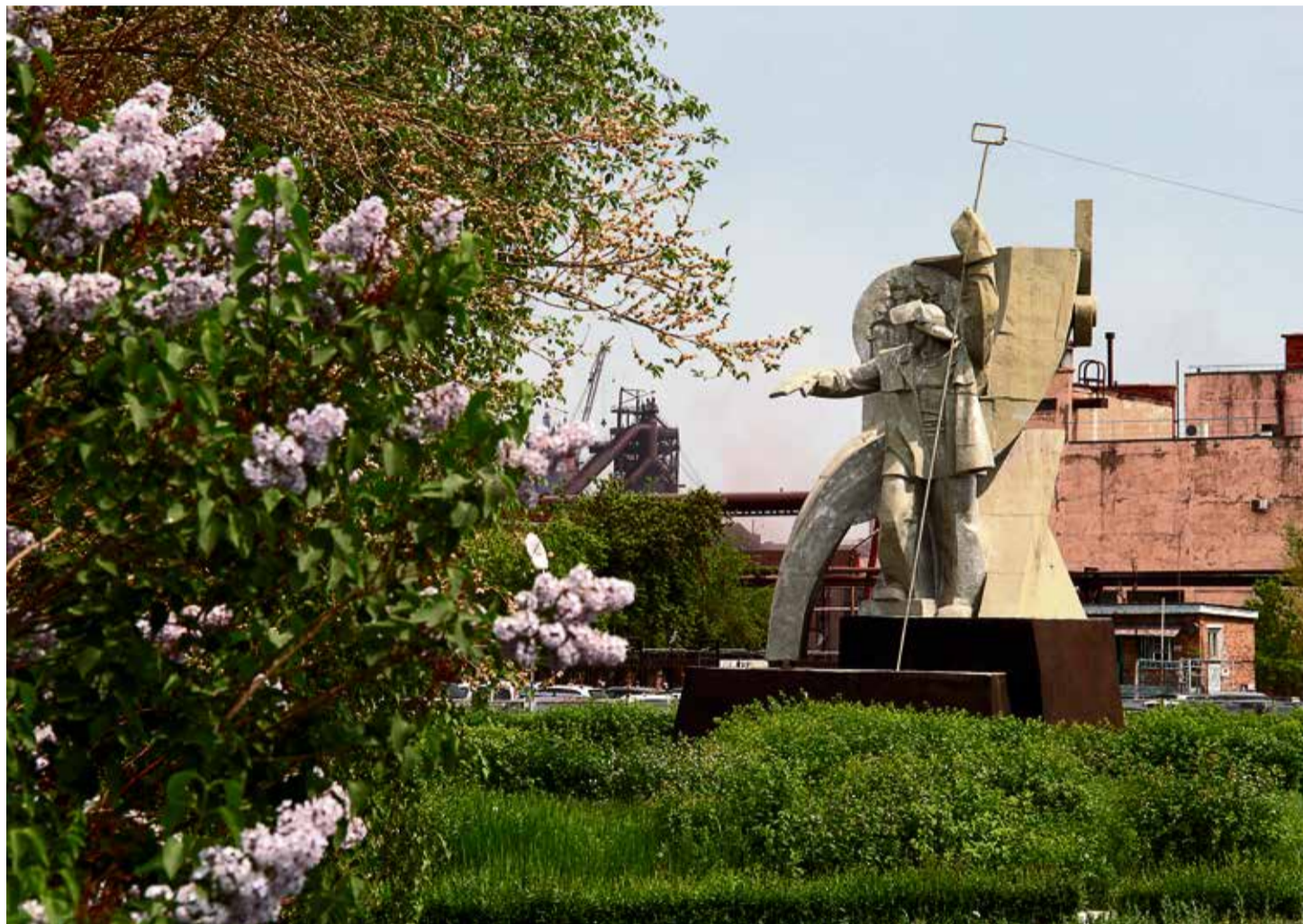
▲ При разработке дизайн-макета сквера у главной проходной авторам нужно руководствоваться идеями создания современной, комфортной и эстетически привлекательной среды