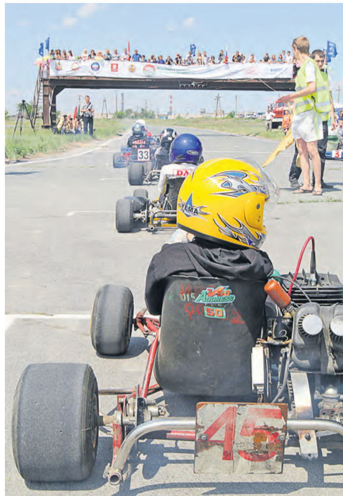
Организация соревнований в глубинке – дело почти неподъемное