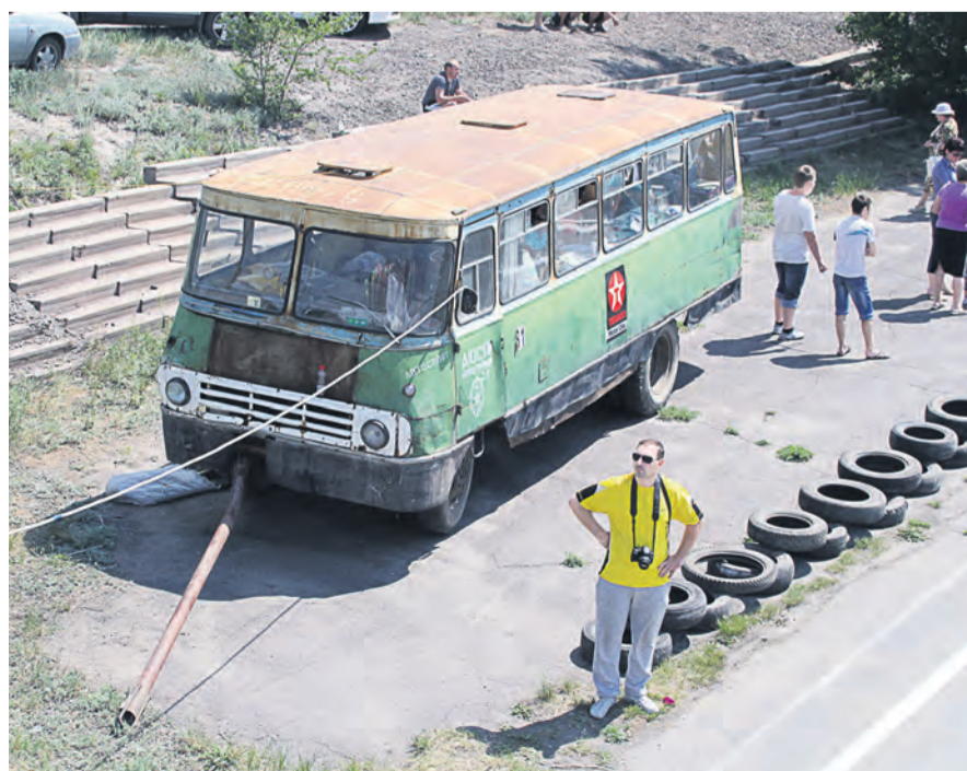
ДОСААФ давно испытывает проблемы с финансами

ДОСААФ было создано 91 год назад для помощи вооруженным силам в укреплении обороноспособности страны. Оно было кузницей защитников Отечества, которых с юных лет приобщали к этому через занятия самолетным, вертолетным, планерным, парашютным, автомобильным, мотоциклетным, радио-, подводным, водно-моторным, стрелковым, иными военно-техническими видами спорта. Сегодня о таких масштабах можно или вспоминать, или мечтать.