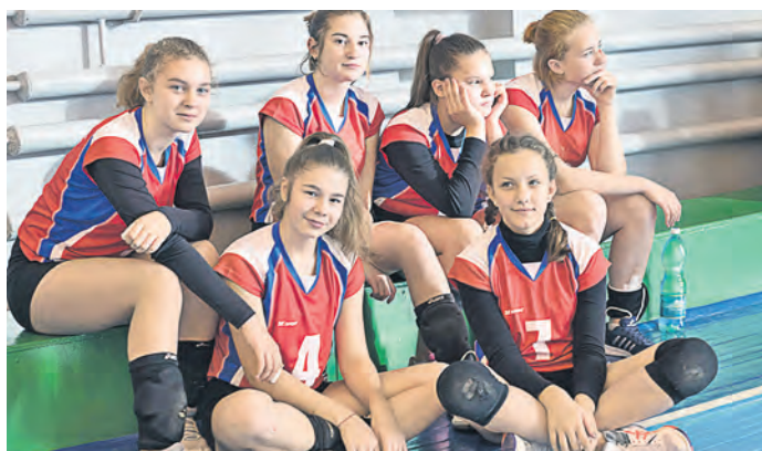
Оренбурженки ждут своей очереди сыграть, они очень довольны теплым приемом гостеприимного Новотроицка, встретившего хлебом-солью