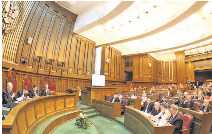
На заседании коллегии Верховного суда России