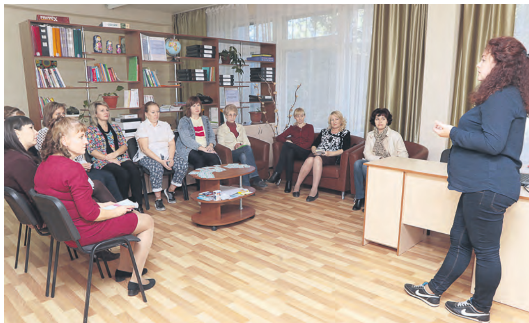
В клубе приемных родителей можно обсудить любую наблевшую тему

На сегодняшний день участниками программы стали 30 семей, где воспитываются не только приемные, но и собственные дети. Как показывает практика, у тех, кто взял под опеку ребенка, хватает трудностей, справиться с ко-