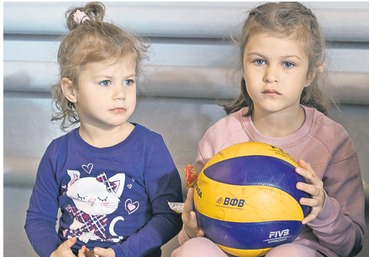
«В волейболе с молодых ногтей!» – так могут смело сказать о себе эти малышки. Сегодня они на зрительских местах. Но пройдет совсем немного лет, и они выйдут на площадку. А кто-то из них, возможно, затмит своей славой популярность Екатерины Гамовой