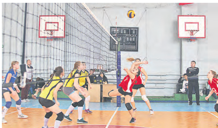
Мяч не пройдет! А если и приземлится, то только на половине соперниц