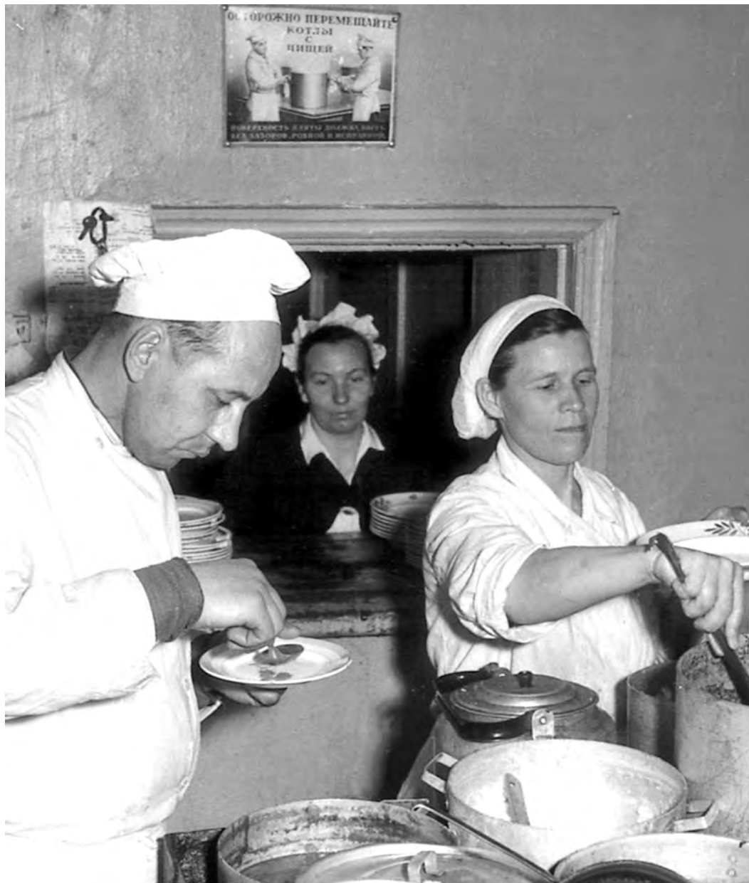
Работа в столовой в СССР означала доступ к дефицитным продуктам