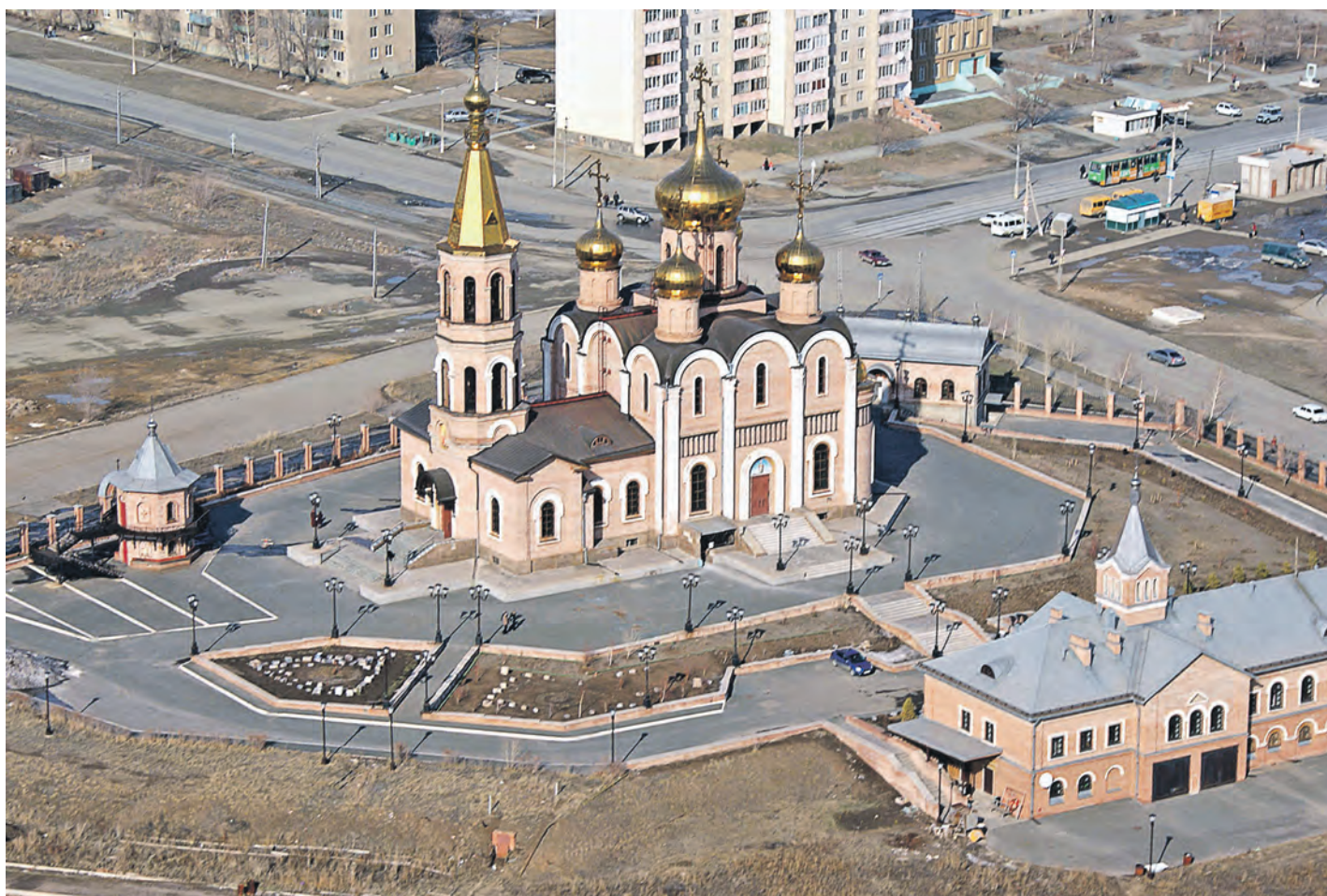
Уже четверть века здание храма венчает собой центральную улицу города – Советскую

Первого октября православные новотройчане отпраздновали 25-летний юбилей храма святых апостолов Петра и Павла, чьи золоченые купола и звонницы хорошо знакомы каждому.