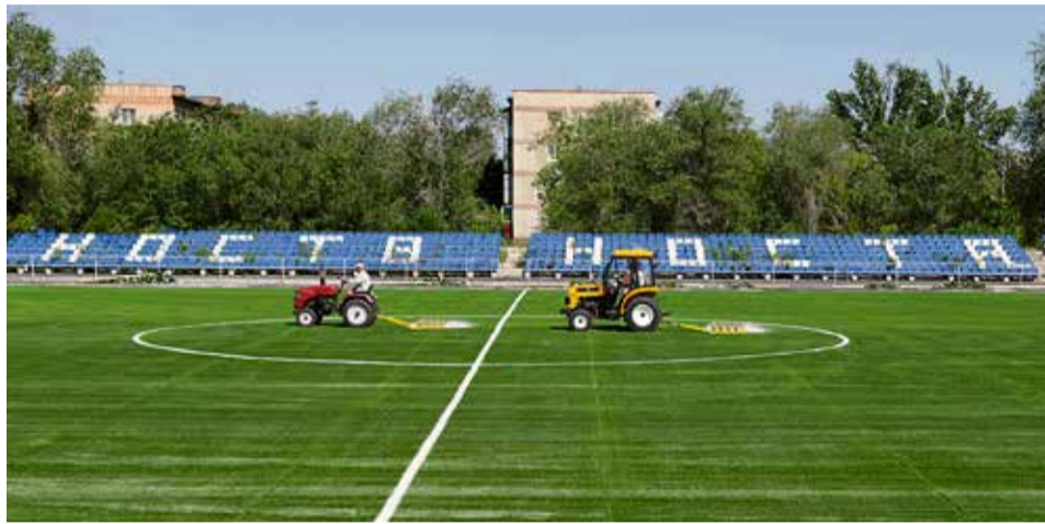
▲ Благодаря тщательному разравниванию под травинками искусственного газона не видно двухслойного «пирога» из кварцевого песка и резиновой крошки

Резиновая крошка — главное антитравматическое средство: её слой работает как амортизатор