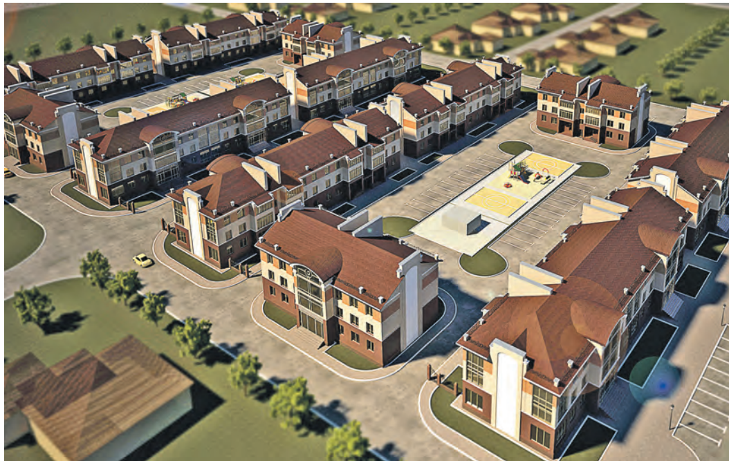
Конечный вид проекта будет учитывать особенности существующей планировки дворов

В Оренбурге назвали имена победителей областного конкурса архитектурных проектов по благоустройству дворовых территорий в области.