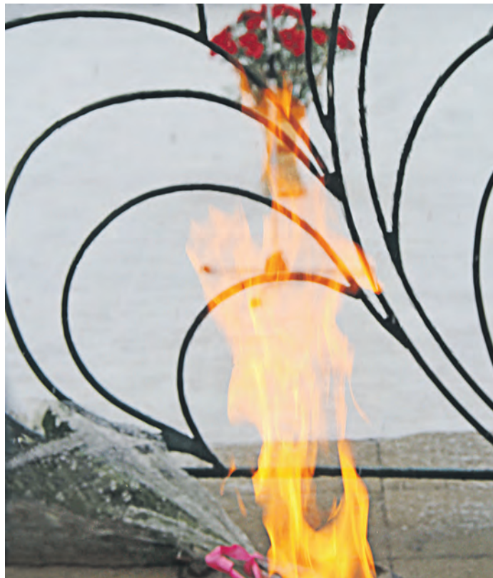
Память о каждом погибшем занесена на скрижали мемориала