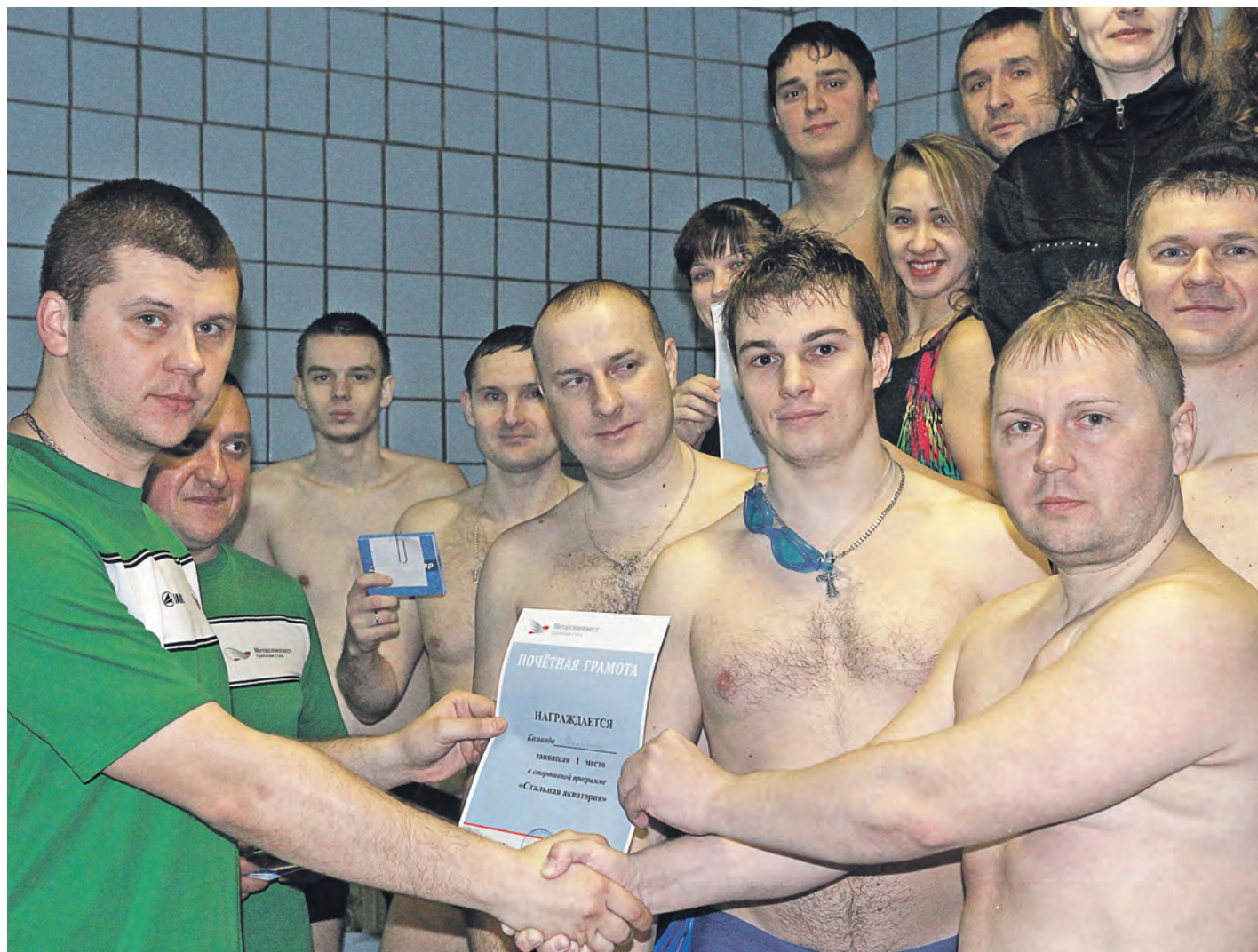
На пьедестале почета – сильнейшие. А ими три года подряд остаются спортсмены заводоуправления, фавориты «Стальной акватории»

Спортивная программа «Стальная акватория» давно стала традицией комбината. «Акватория» вновь вспенила голубую гладь «Волны». На старт вышли восемь команд от всех производственных переделов. Была даже дружина вспомогательных цехов!