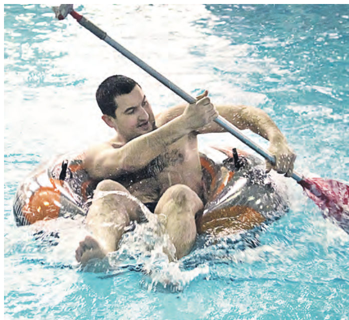
Переправа «без руля и без ветрил». Кажется, гребешь целую вечность

– В «Стальной акватории» участвую впервые. В школьные годы плаванием не занималась. Придя на комбинат, поняла: спорт здесь в почете. Теперь вот наверстываю упущенное в юности, плаваю за сборную ДИТ и финдирекции. Сегодня не всё получилось – буду тренироваться!