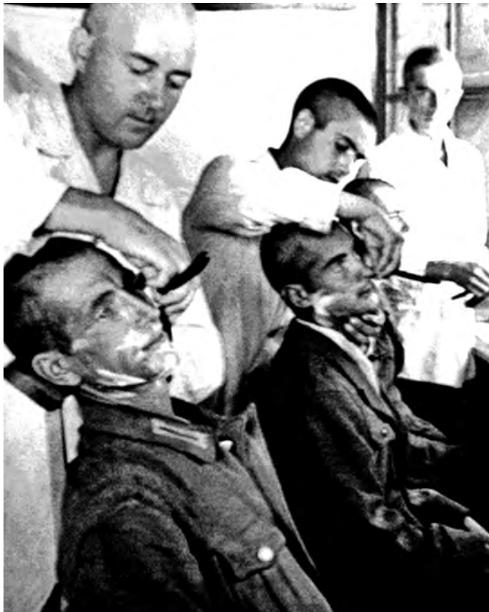
Так выглядело еженедельное посещение парикмахера