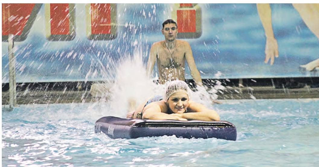
Фонтан брызг за спортсменкой создает капитан, буксирующий партнершу. Ей запрещено помогать мужчине