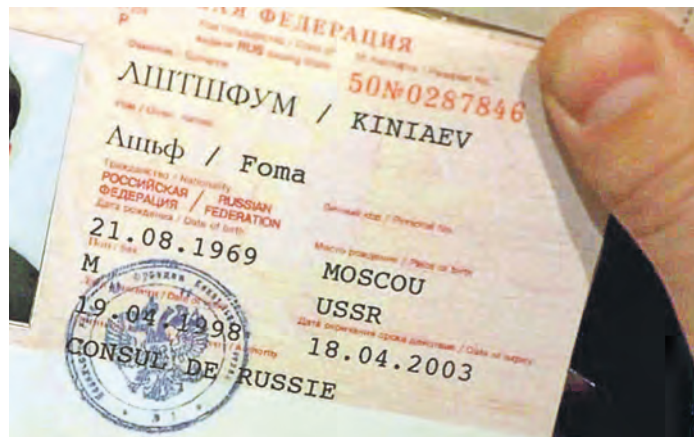
Даже когда ошибается машина – виноват в недосмотре человек