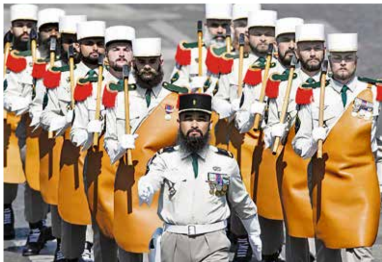
▲ Сапёры французского иностранного легиона — привет из Древнего Египта. Грубый фартук, в котором ходили ещё при фараонах, и топор — часть солдатского облика

непосвящённого на каждом шагу подстерегает опасность.