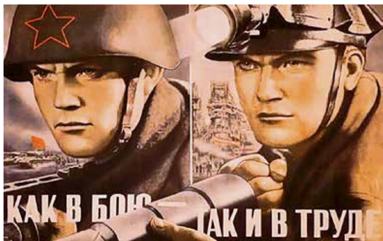
▲ «Как в бою — так и в труде» (1946 г.): плакат Виктора Корецкого передаёт яростное трудовое напряжение послевоенного времени. На шахтёре — экзотическая для нашего времени складчатая каска-«черепашка». Делали её из кожи и фиброкартона