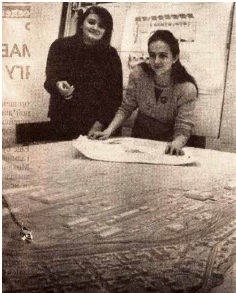
◀ Макет был задуман как центральный экспонат музея Уральской Стали и выполнен специалистами бюро гражданской и промышленной эстетики комбината

Газета начинает выпускать целые страницы с фо-