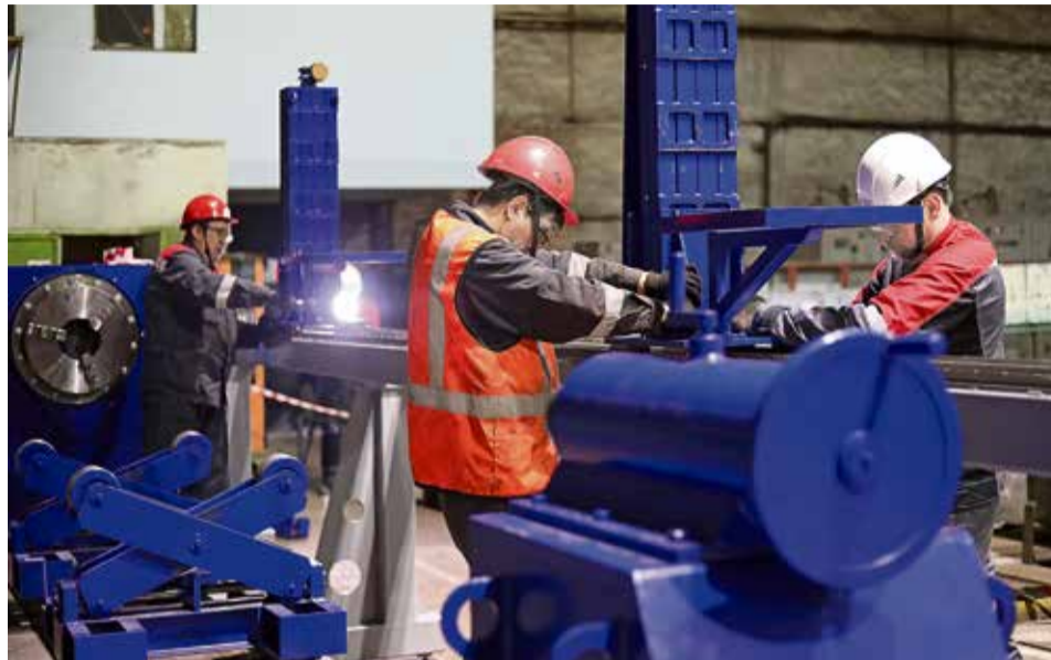
▲ Одновременно с монтажом оборудования цех заканчивает подготовку специалистов, которые будут работать на новом оборудовании

По сути, наплавка — родная сестра электродуговой сварки. Только служит она не для скрепления конструктивных элементов, а для воссоздания слоя утраченного металла. Специальную проволоку непрерывно подают по особому тракту. Касаясь детали, она расплавляет её поверхностный слой и образует на из-