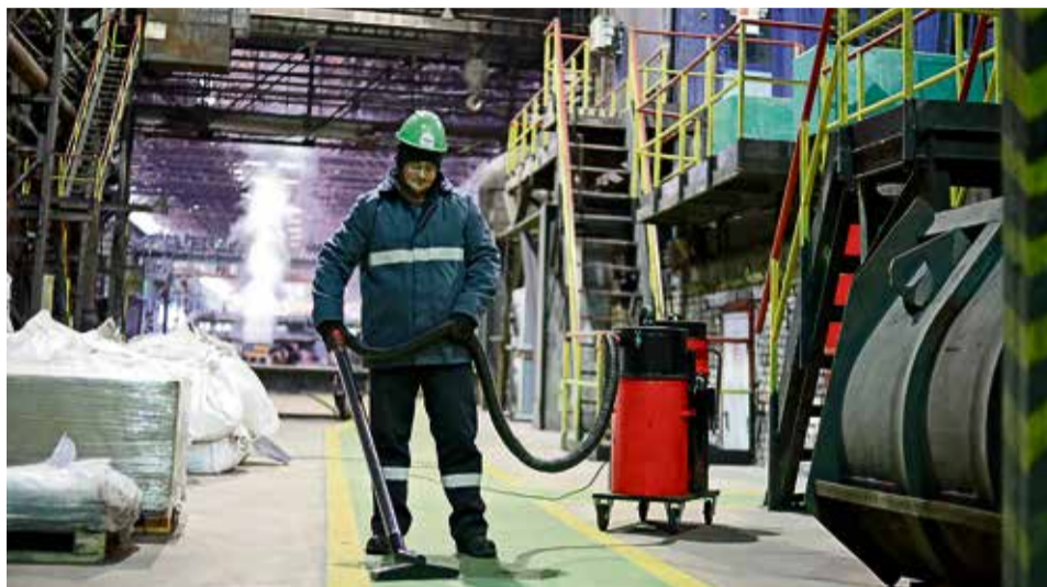
▲ Пылесос на участке методических печей недавно казался фантастикой. Сегодня это привычный аксессуар для поддержания чистоты на производстве

— Около трёх лет. Особенно много работы было в начале пути, когда пришлось наводить порядок в хранении инструментов и материалов, сортировать нужный инструмент от того, который лежал «на всякий случай». После этого мы приступи-