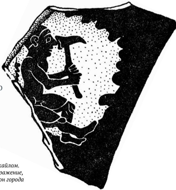
▲ Рудокоп в забое с кайлом. Древнегреческое изображение, VII-VI вв. до н. э., район города Коринф

В Англии четырёхлетние трубочисты пробивали дымоходы, залезая в камин и выбираясь из трубы на крыше. Чем тоньше трубочист, тем лучше, поэтому хозяева их плохо кормили. Массово использовать детей-трубочистов перестали только в конце XIX века.