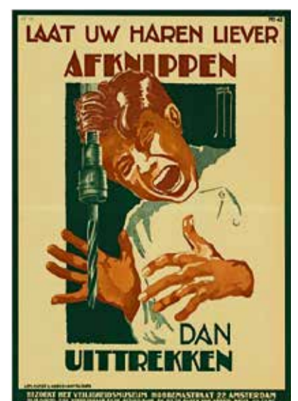
▲ «Спрячь волосы!»: индустриальные плакаты с призывами на русском, английском, немецком и голландском предупреждают об одном и том же