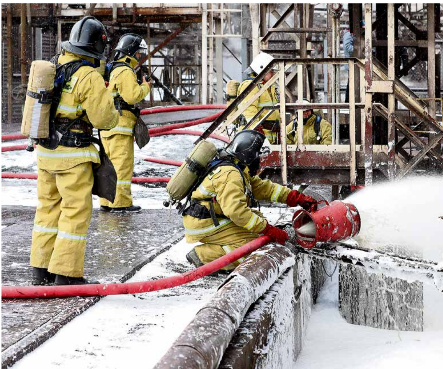
▲ Снизить риск возгорания разлитого топлива помогают генераторы пенной струи для формирования защитного слоя, который изолирует горячую смесь от доступа атмосферного воздуха