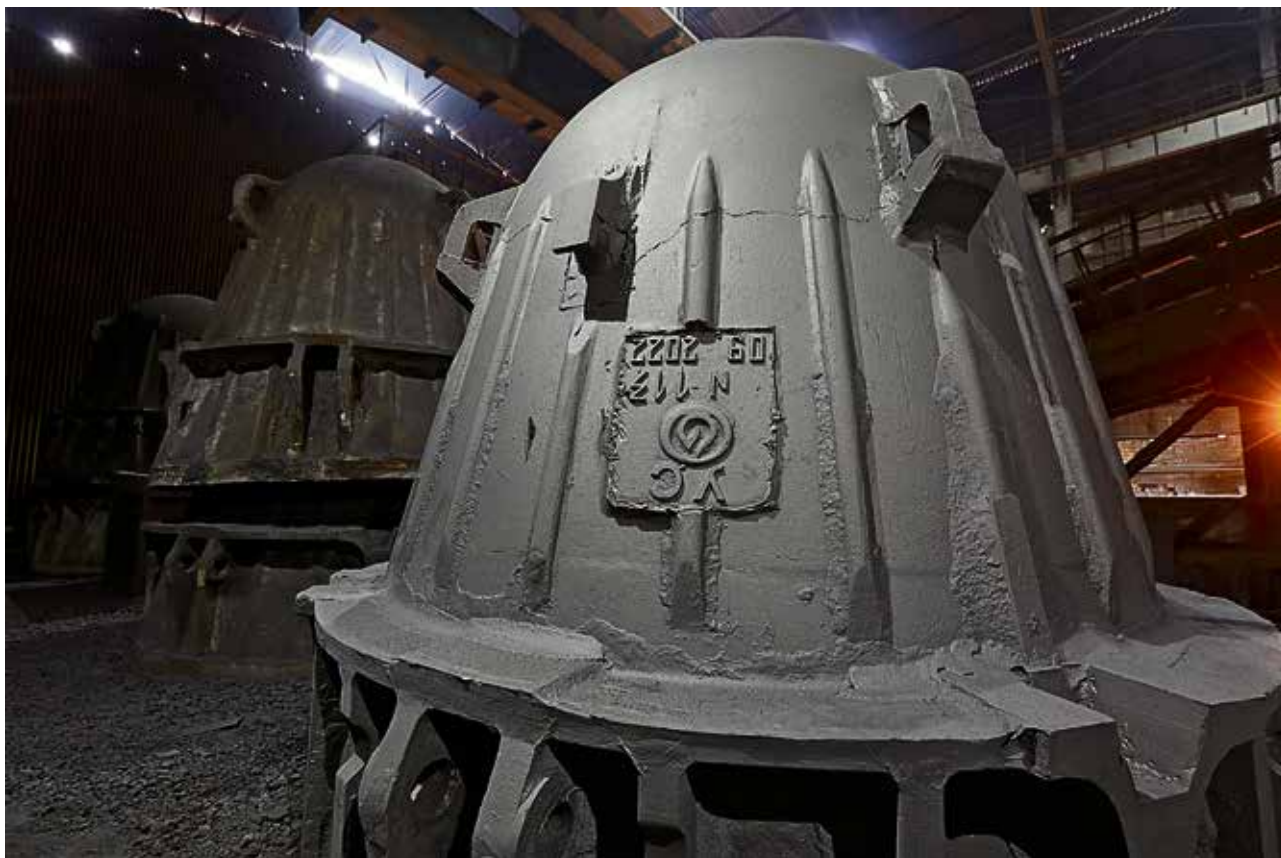
▲ До и после: чаша на переднем плане уже прошла через чистилище дробемётной камеры и получила благородную внешность, остальным это ещё предстоит

На участке крупногабаритного литья фасонно-литейного цеха Уральской Стали запустили в работу дробемётную установку