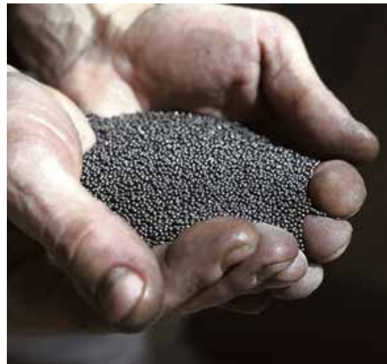
▲ Всего несколько десятков минут нужно этим стальным градинам, чтобы очистить любую металлическую поверхность

А самая передовая методика очистки поверхностей использует лазер. Такие аппараты бывают различной мощности, и сферы их применения очень разнообразны. Их используют в случае, когда критически важно не затронуть внутреннюю структуру изделия — например, если внутри есть электронные компоненты.