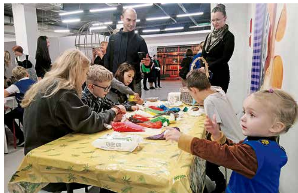
▲ В день открытия центра при содействии Загорского трубного завода в «Музее впечатлений» для будущих воспитанников состоялся большой праздник. Дети приняли участие в анимационном шоу и получили новые навыки на мастер-классах

В центре планируют обучать родителей детей с аутичным синдромом педагогическим методикам и психологическим приёмам для улучшения коммуникации, устранению нежелательного поведения, улучшению речи. В программе работы пред-