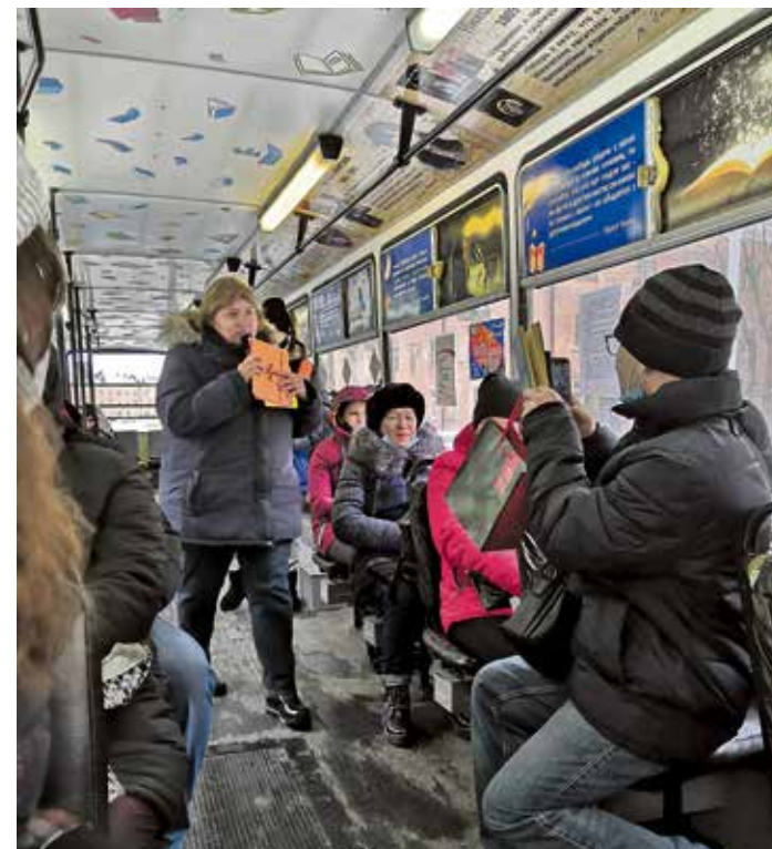
▲ Раз в неделю в Читай-трамвае с читателями-любителями встречаются читатели-профессионалы, которые рекомендуют новые книги и говорят о незаслуженно забытых классических произведениях