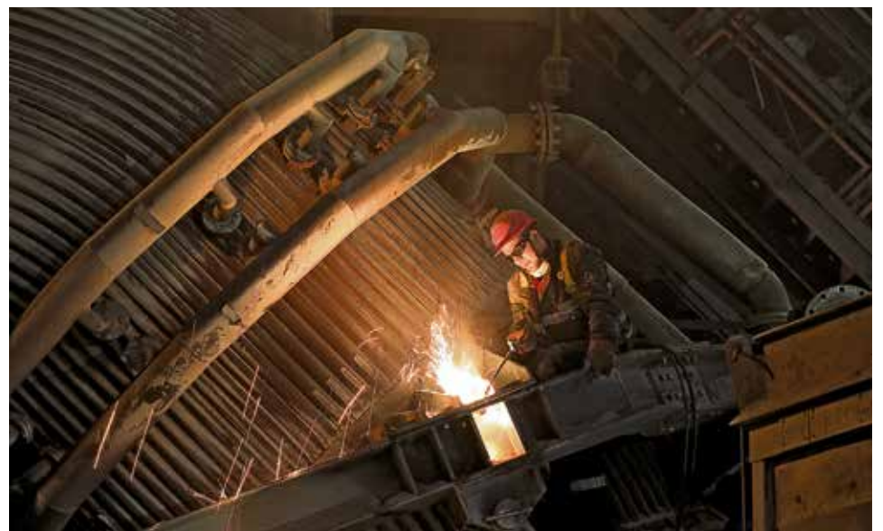
▲ Ремонт начали с демонтажа подвижного патрубка, расположенного в непосредственной близости от печи

Параллельно с основным объёмом работ сотрудники ЦТОиР ЭСПЦ проведут ревизию системы водяного охлаждения и капитально отремонтируют держатели высоковольтных электродов второй печи.