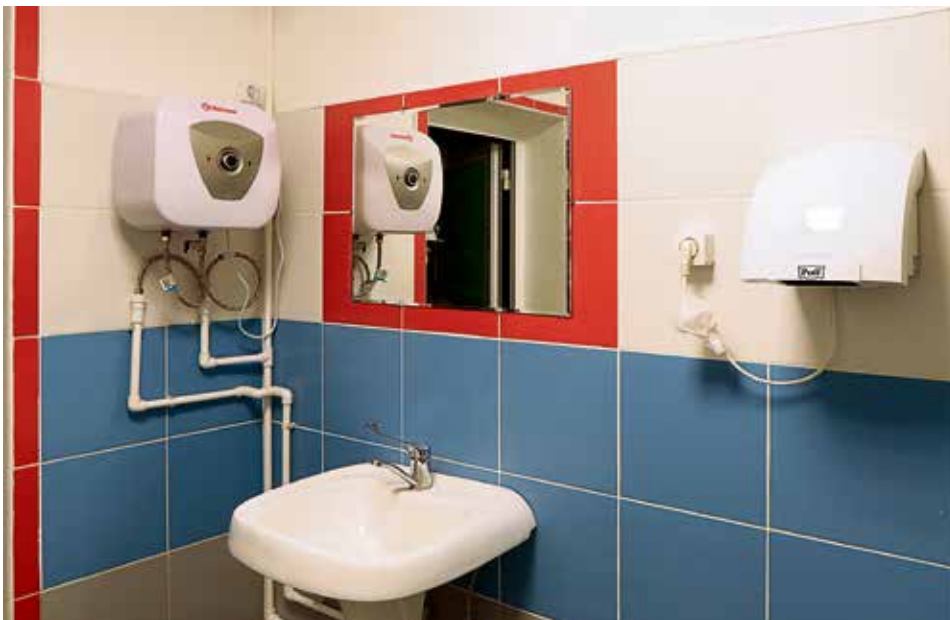
▲ Только в 2021 году по программе капитального ремонта помещений непромышленного назначения ремонтные службы отремонтировали более 140 объектов

Чем больше работников примет участие в исследовании, тем более объективную картину получит руководство Уральской Стали.