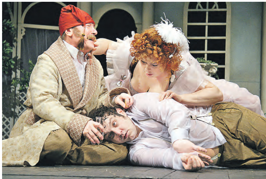
«Все-таки согласитесь хоть теперь: ваш Угадай хуже нашего Откатая...»