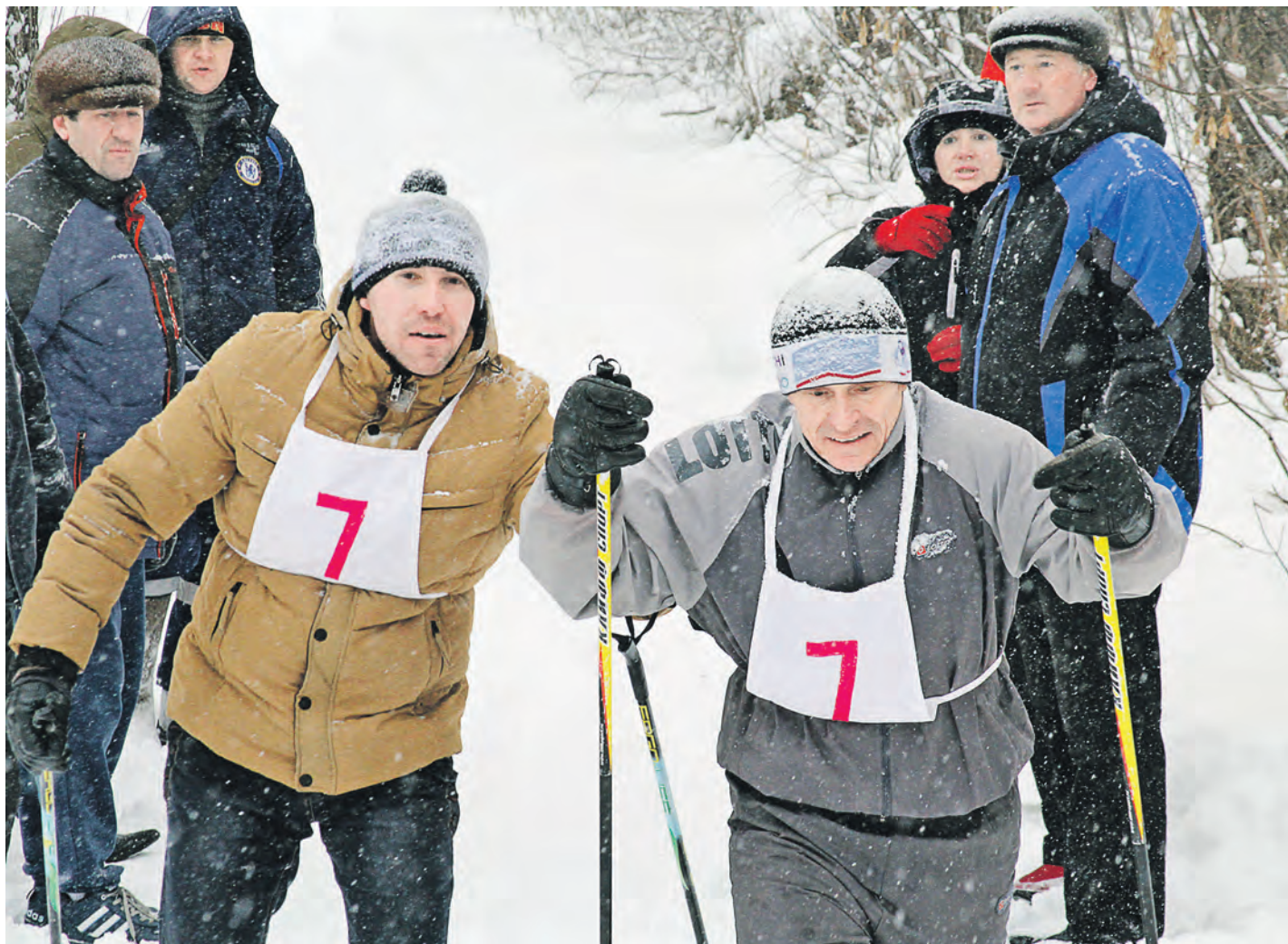
На старт лыжной эстафеты Уральской Стали выйдут как опытные атлеты, не раз завоевывавшие призовые места, так и новички

В ближайшую субботу, третьего февраля, состоится официальное открытие спартакиады-2018 Уральской Стали. По традиции начнется она с лыжной эстафеты и турнира по бадминтону.