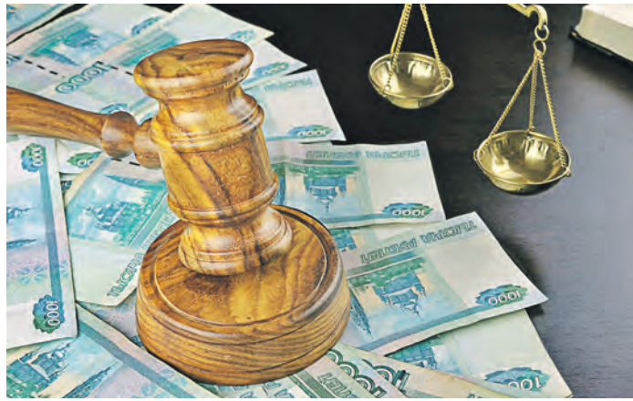
Суд счел штраф адекватным наказанием за дачу ложных показаний

Об этой истории знало руководство, но, желая не выно-