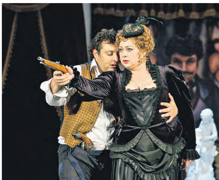
Дуэль проиграна, еще не начавшись: помещик Смирнов влюбился во вдову

Александр Проскуровский