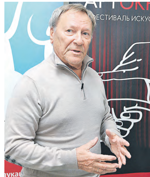
Сергей Шакуров: в Новотроицке я впервые...