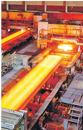
Борьба за рынок Европы в разгаре

С помощью новой линии термообработки Salzgitter планируется выпускать толстый лист из высокопрочных и износостойких марок стали, продукцию из легированных сталей, материалы для строительства ветроустановок и производства сосудов высокого давления. Новая линия термической обработки будет произ-