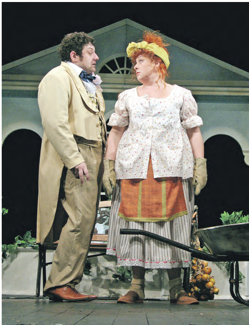
«А чой-то ты во фраке?»

Е го гастроль состоялись в рамках фестиваля АРТ-ОКНО при поддержке благотворительного фонда Алишера Усманова «Искусство, наука и спорт».