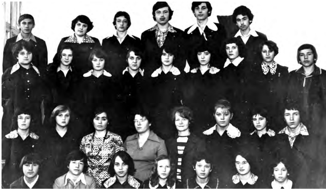
На встречу выпускников стоит захватить общую фотографию, тогда воспоминаниям не будет конца

Пятая школа в поселке Прогресс ждет гостей в пятницу в 18 часов. В шестой школе мероприятия начнутся в это же время, а в субботу пройдет эстафета с ветеранами Уральской Стали. Школа №7 встречает выпускников 2 февраля, с