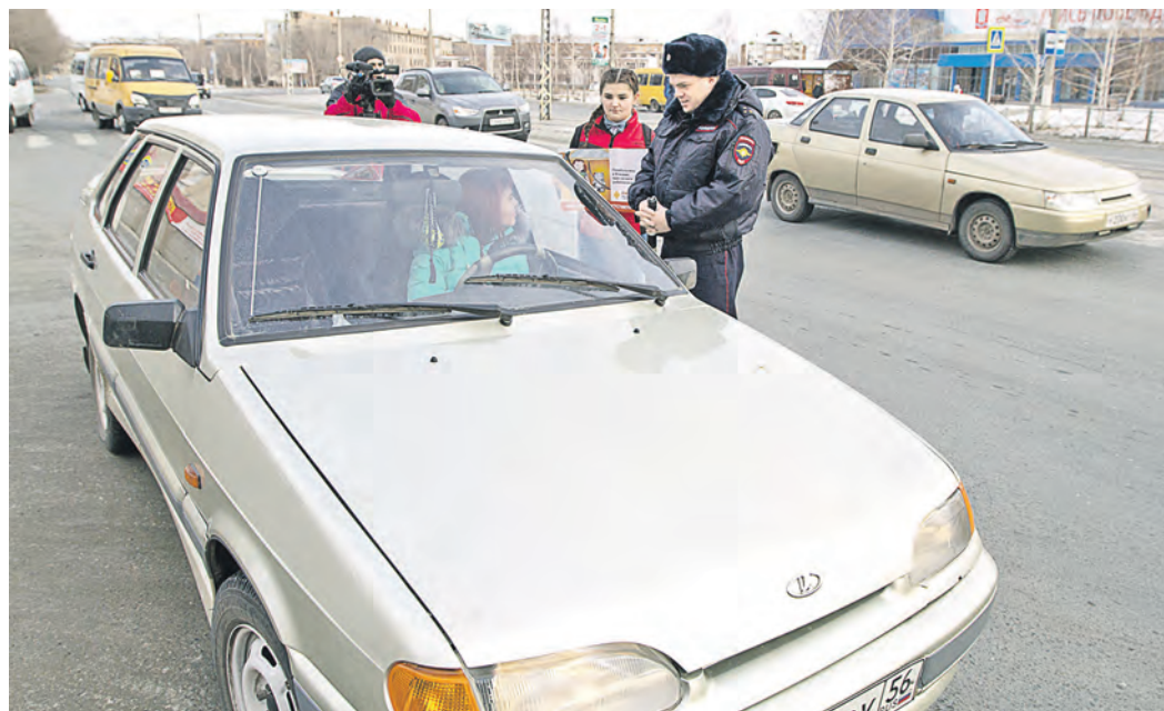
Рассказать водителям о нововведениях в правила полицейским помогут помощники-волонтеры

Статья 8 закона о полиции гласит, что доказательства гражданин может добывать любым законным способом. Здесь ничего не поменялось. Автолюбителей касаются другие изменения. К примеру, теперь для проверки инспектору нужно передавать только непристегнутые скрепками документы, без обложки, а не как некоторые – отдают портмоне полностью, а полицейский сам ищет там права, страховку. Кстати, предъявлять документы водитель обязан везде, а не только на постах. Единственное исключение, если ночью где-нибудь на трассе вас остановит патруль