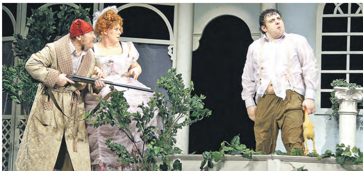
Спор о принадлежности Волыных Лужков и превосходстве Угадай над Откатаем накалился до предела