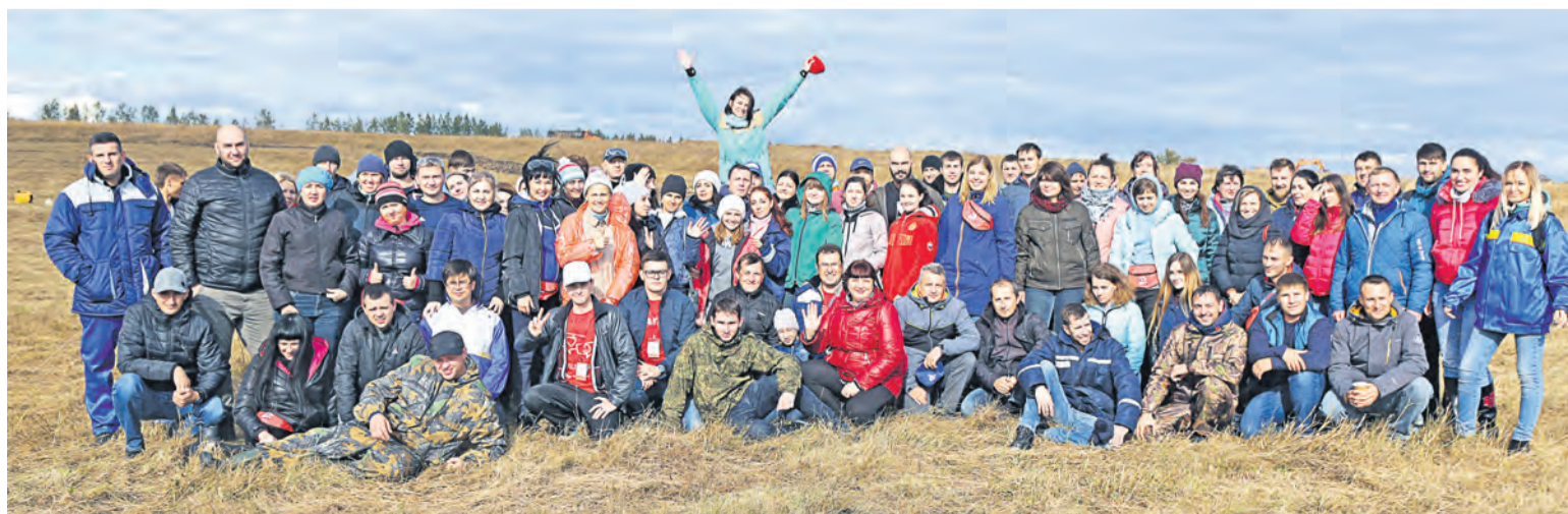
▲ В сентябре прошлого года состоялся первый Слёт волонтеров Металлоинвеста, объединивший более 120 добровольцев со всех предприятий компании. Волонтеры провели экологический субботник: расчищали от ясенелистного клёна площадку в «Ямской степи» (один из пяти участков, входящих в заповедник «Белогорье»)

Департамент корпоративных коммуникаций УК «Металлоинвест»