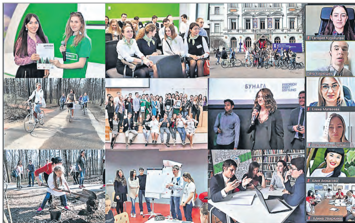
▲ Во время вебинаров волонтеры и эксперты обменялись идеями: как сделать окружающий мир чище и лучше

Под таким девизом в компании «Металлоинвест» стартовал масштабный экомарафон в рамках корпоративной волонтерской программы «Откликись!». 9 и 10 июля прошли первые вебинары, посвящённые экологической теме.