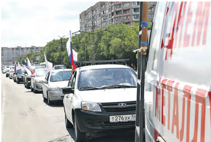
Спустя полчаса к Дворцу культуры металлургов – отправной точке пробега – вернулось больше машин, чем отъезжало

Предложение Уральской Стали поздравить металлургов, торжественно проехав автомобильной колонной по городским улицам, активно поддержали студенты и преподаватели МИСиС. Именно