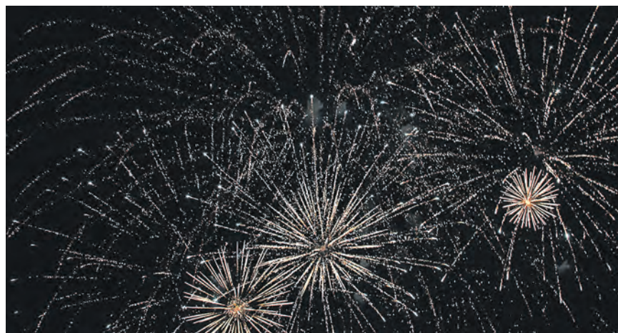
Финал всякого Дня металлурга – красочный салют