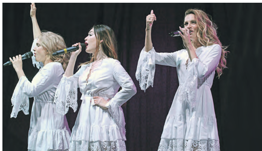
Трио «Фабрика» зрители встречали очень тепло