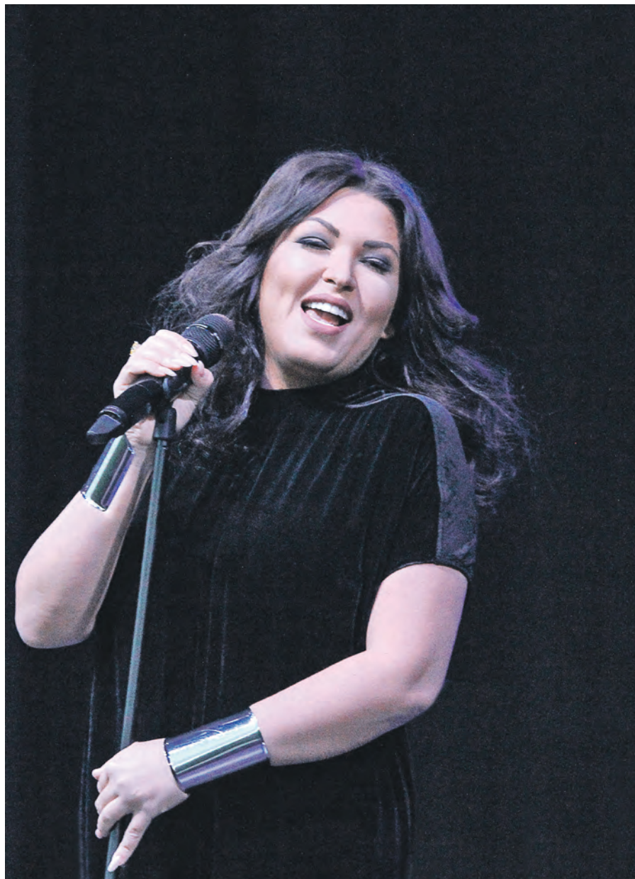
Впервые на новотроицкой сцене – Ирина Дубцова