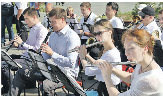
Живое исполнение отлично сыгранного духового оркестра всегда оставляет незабываемые впечатления