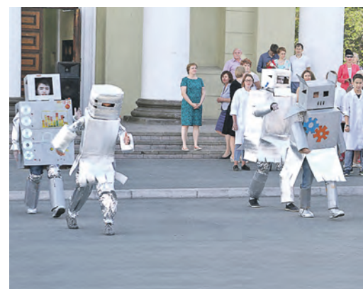
Роботы – они кто, помощники, соперники? Это зрители узнали в финале