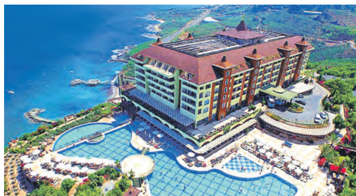
... а турецкое – уровнем комфорта и сервиса