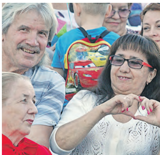
Нашей любви хватит на всех!