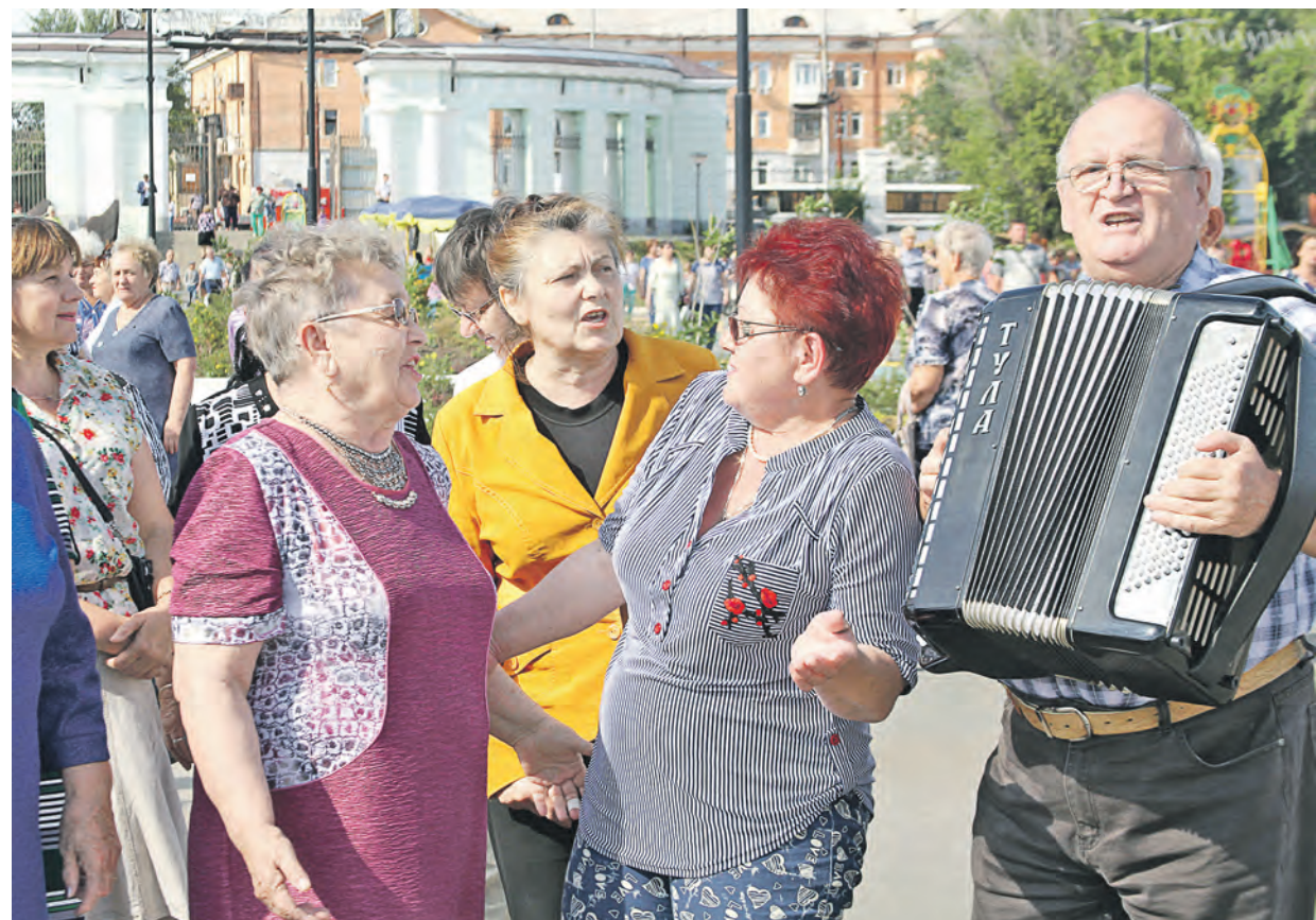
Духовой оркестр – это прекрасно, но частушки под него петь затруднительно. А иногда так этого хочется!