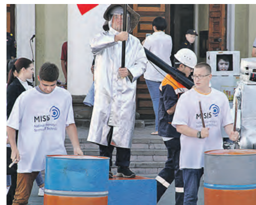
Ритм происходящему на площади задавала группа молодых барабанщиков