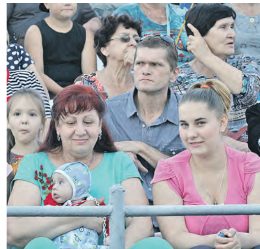
Самый маленький металлург на стадионе