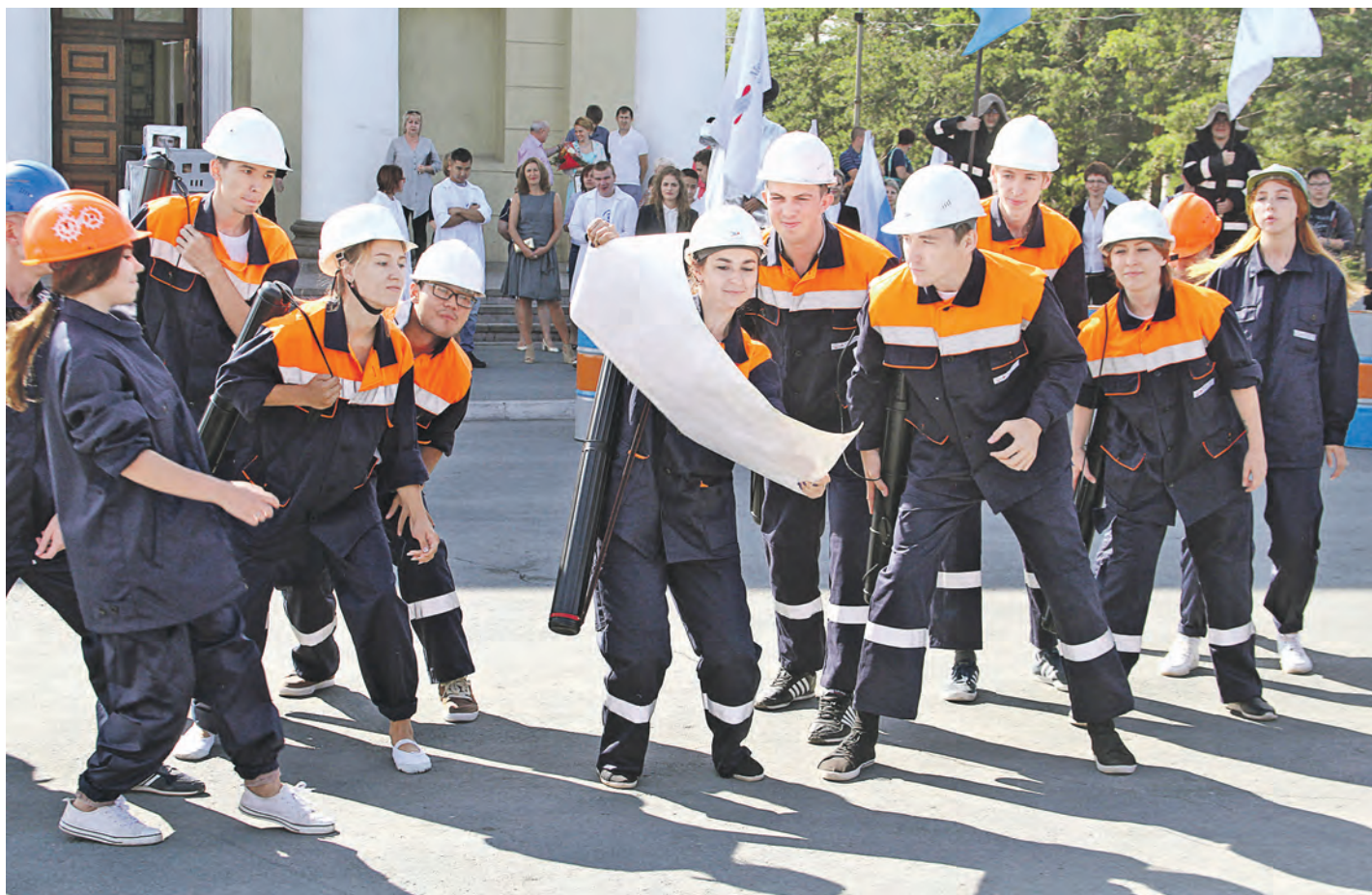
Танец студентов с самого начала очаровал зрителей своим динамизмом

Как только во Дворце культуры металлургов закончилось торжественное награждение металлургов-передовиков, праздник выплеснулся на улицу. Новотройчан и гостей города ждало феерическое шоу от студентов МИСиС.