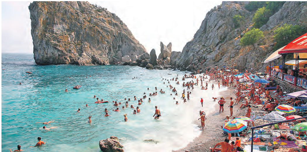
Российское побережье может привлечь своей первозданностью...

Одна из веских и, наверное, главных причин заключается в том, что отдых в России иногда выходит дороже, чем за границей, в той же Турции, которая после отмены санкций снова обрела былую популярность у российских туристов. Конечно, всё зависит от выбранного места и обстоятельств, и если в Анапе или Сочи у вас живет бабушка, то вам придется раскошелиться исключительно за перелет. Если же сравнивать стоимость по путевкам, то провести каникулы в Турции окажется выгоднее, чем в Сочи или в