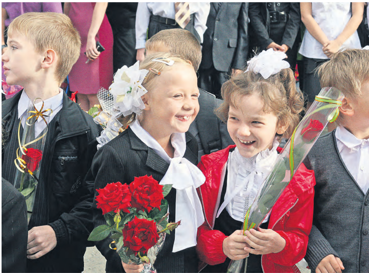
Первый раз в первый класс! Этот волнующий момент останется в детской памяти на всю жизнь

Заливистый школьный звонок прозвенит сегодня для почти десяти тысяч мальчишек и девчонок Новотроицка, которые после летних каникул готовы сесть за парты.