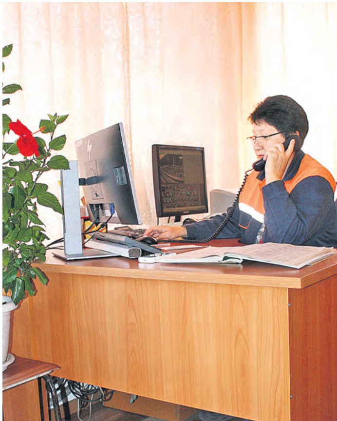
В операторской на весовой станции кипит работа в уютной атмосфере

наблюдения. Все данные – где, что, когда повесили – отображаются на каждой станции и хранятся определенное время. Как справляются с этим потоком информации весовщики-технологи, остается только догадываться.