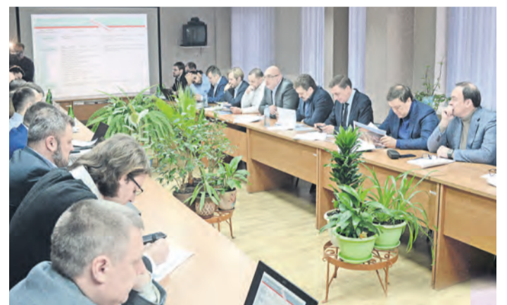
Первое заседание Управляющего комитета по развитию Бизнес-СистемыMetalloinvest

а также из управляющей компании. Одна из основных задач экстрас-группы – создание единых методологических основ и организационно-распорядительных документов Бизнес-СистемыMetalloinvest.