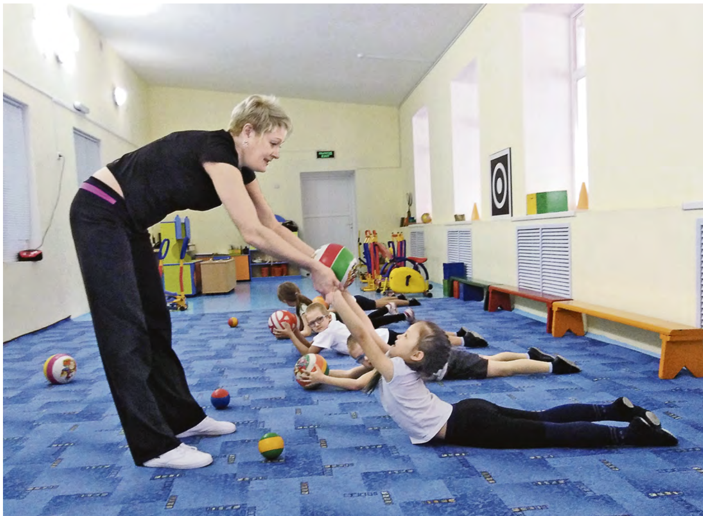
Тренировочный процесс построен на результатах кропотливого подбора упражнений, индивидуальных для каждого ребенка

Проект «Физкультура для всех!» помогает дошкольникам с ограниченными возможностями здоровья познать радость занятий физической культурой.