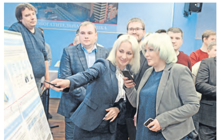
Пользоваться инструментами Бизнес-Системы с помощью мобильного приложения – легко!