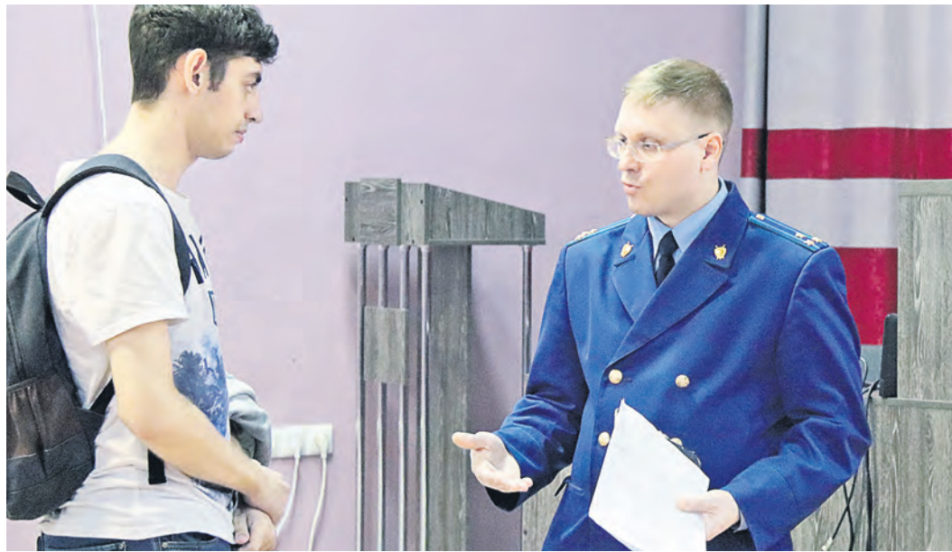
После лекции у студентов была возможность задать уточняющие вопросы

О своем направлении и итогах надзорной деятельности рассказал прокурор Орской межрайонной природоохран-