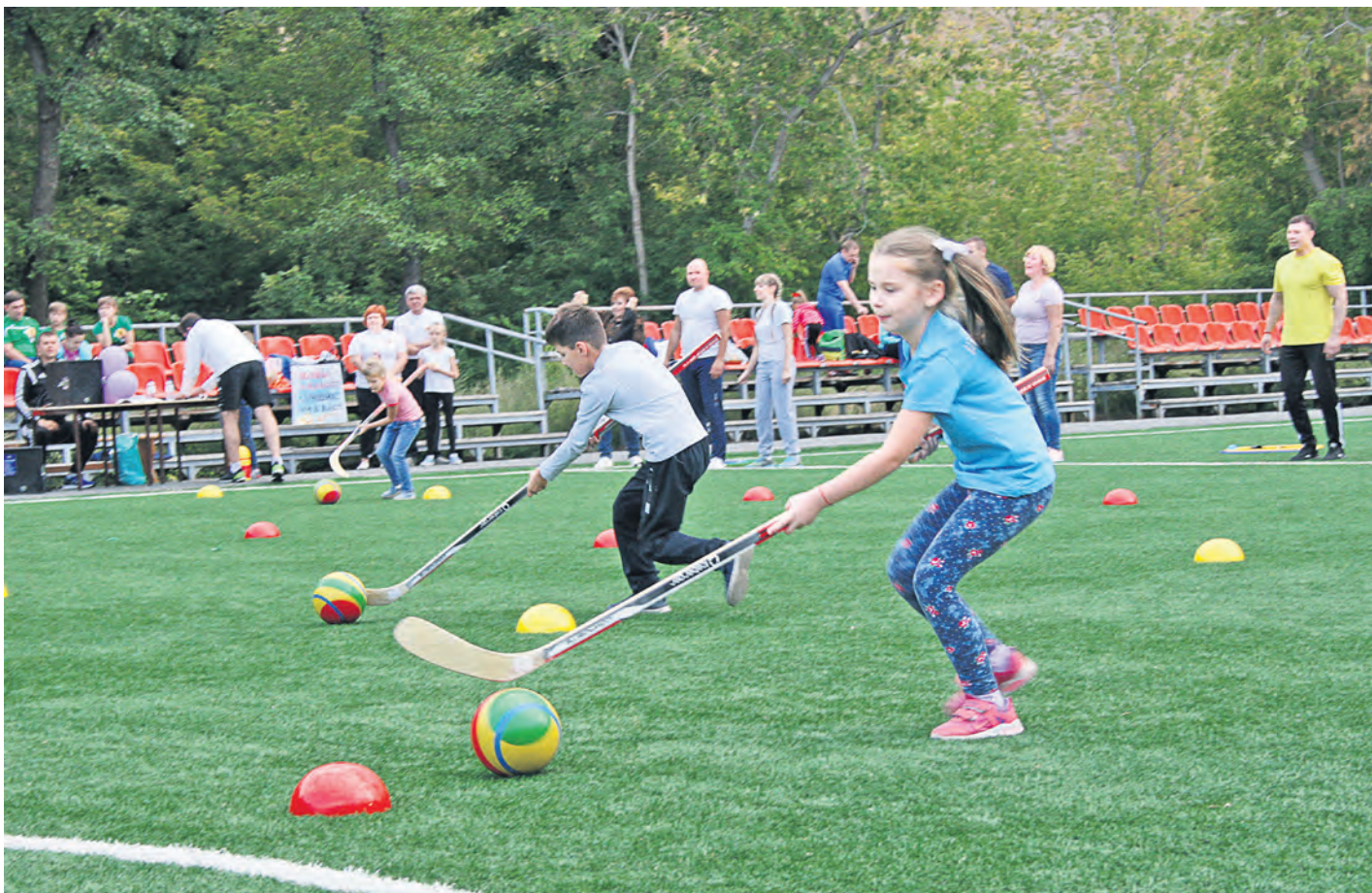
Девочки доказали, что в хоккей на траве играют не хуже мальчиков