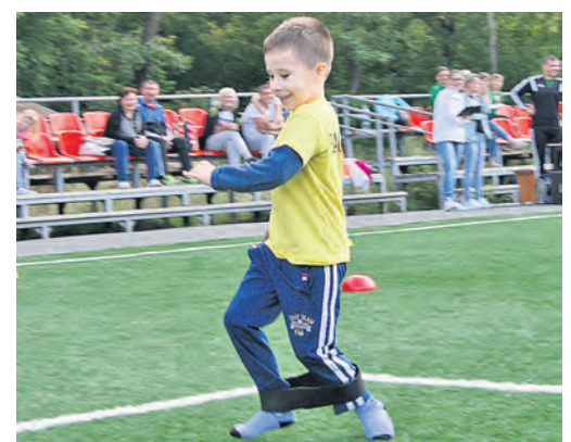
Один из самых смешных забегов – перебирать ногами, когда на лодыжках резинка