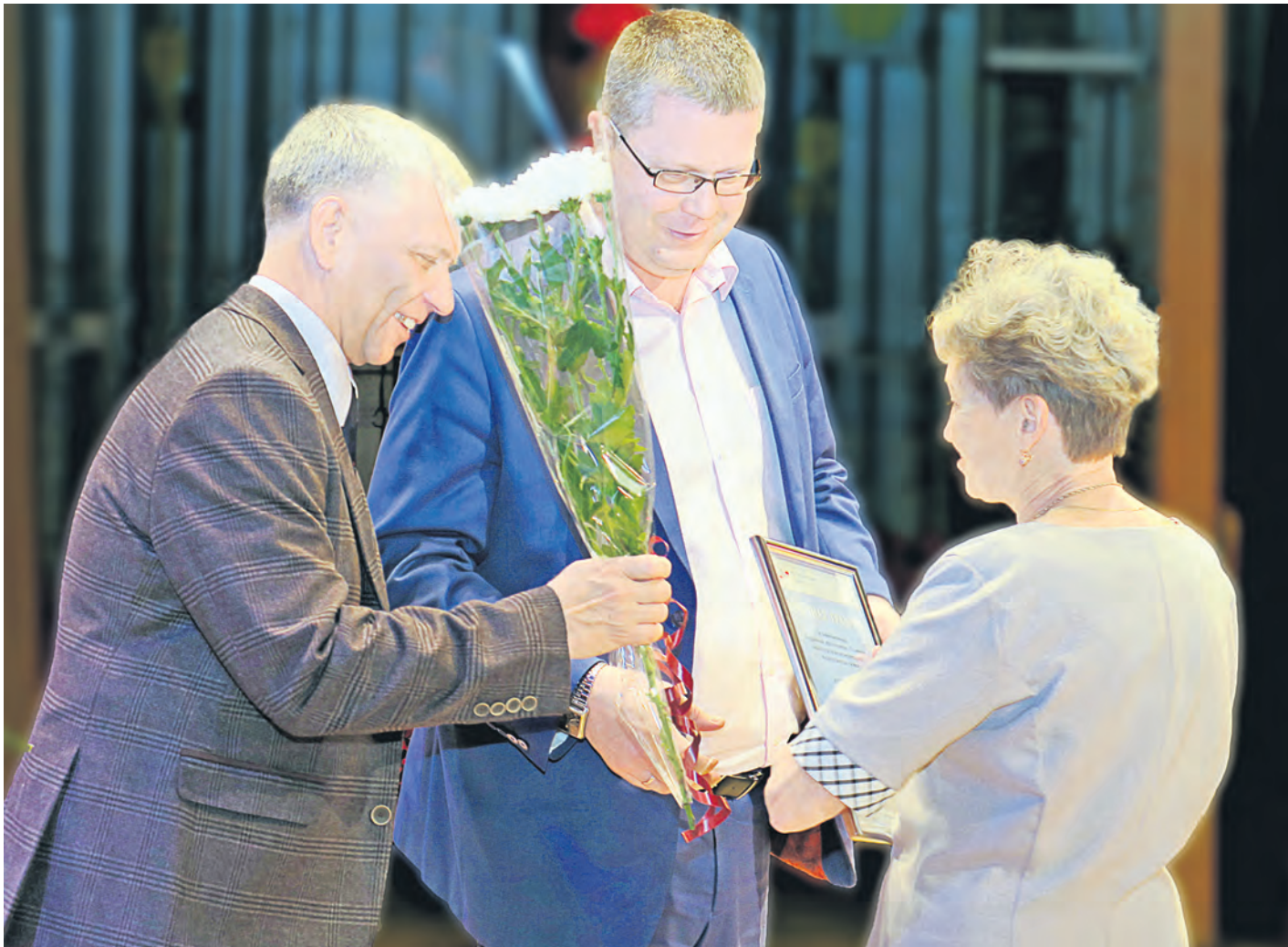
В этот вечер заслуженные награды получили несколько десятков человек

Во Дворце культуры металлургов прошло торжественное собрание, посвященное юбилеям сразу двух цехов: весовщики праздновали 35-летие, а метрологи – 40-й день рождения.