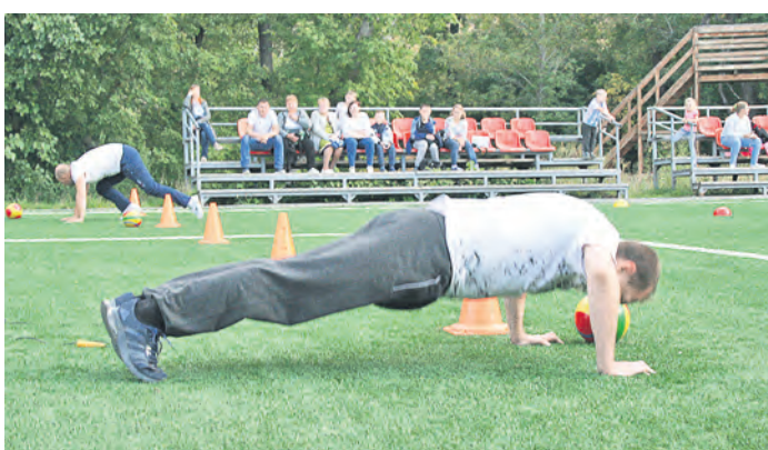
После пробежки на одном из этапов соревнований папы должны были отжаться по десять раз, и у всех получилось