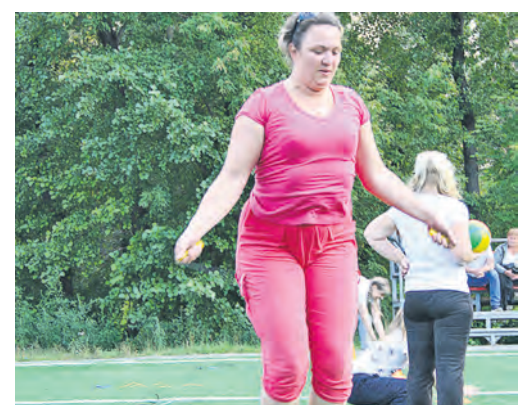
На эстафете со скакалкой мамы смогли вспомнить свое дворовое детство