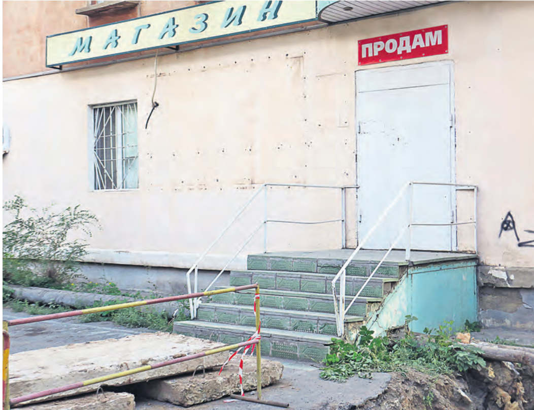
Пока внешних признаков жизни пекарня не демонстрирует. Надолго ли?