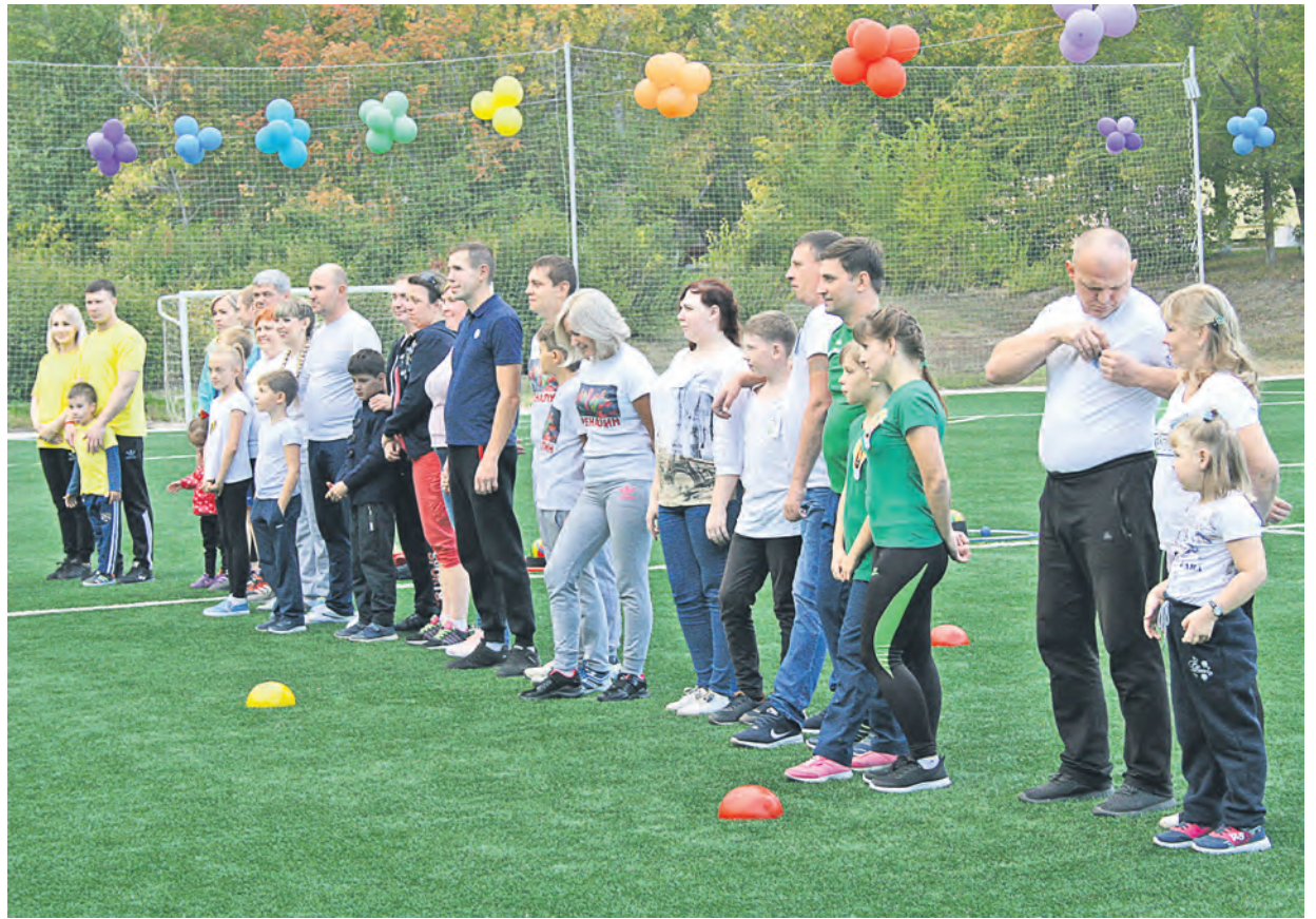
Перед стартом на общем построении участники соревнований «Папа, мама, я – спортивная семья» еще не догадывались, какие сюрпризы им приготовили организаторы мероприятия – дирекция по соцвопросам