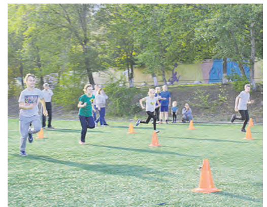
Ну и что, что «Веселые старты» – это не олимпийские игры, победить хочется всем