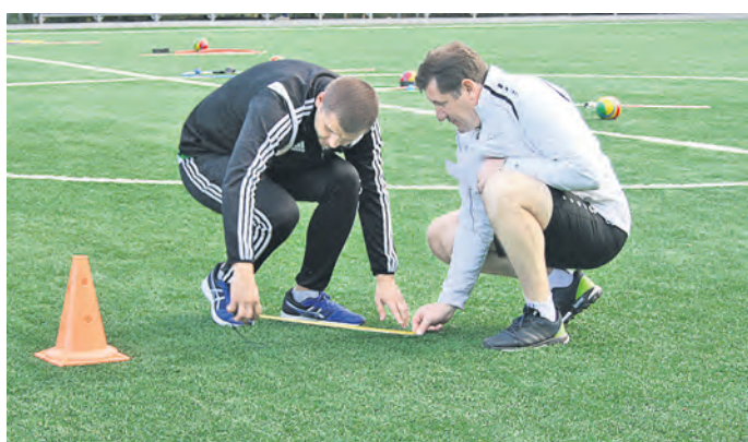
Неподкупные судьи после эстафеты замеряли длину прыжков с максимальной точностью