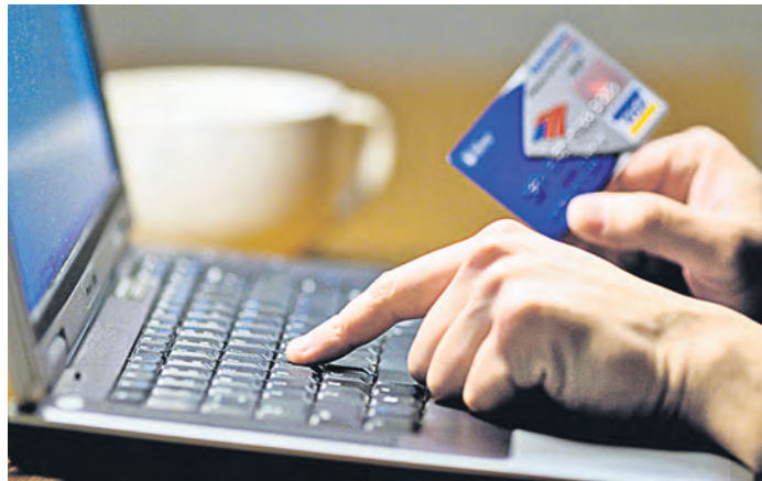
Мошенники всегда в поиске все новых схем отбора денег

Они отправляют sms-сообщения о имевшей место блокировке их банковской карты за подозрительные операции. При этом они ссылаются на новый федеральный закон и просят перезвонить по указанному телефону, в ходе разговора мошенники узнают у потерпевшего данные карты и CVV-код, после чего человек лишается денег. По данным экспертов в области кибербезопасности, около ста человек уже стали жертвами новой схемы мошенничества. Причиненный ущерб достиг двух миллионов рублей. Принципиальным новшеством данной мошеннической схемы является ссылка на реально существующий федеральный закон. Злоумышленники внимательно отслеживают изменения в работе банка и мастерски их копируют. Для того чтобы не лишиться денег, нельзя сообщать третьим лицам данные банковской карточки и ее CVV-код. Полу-