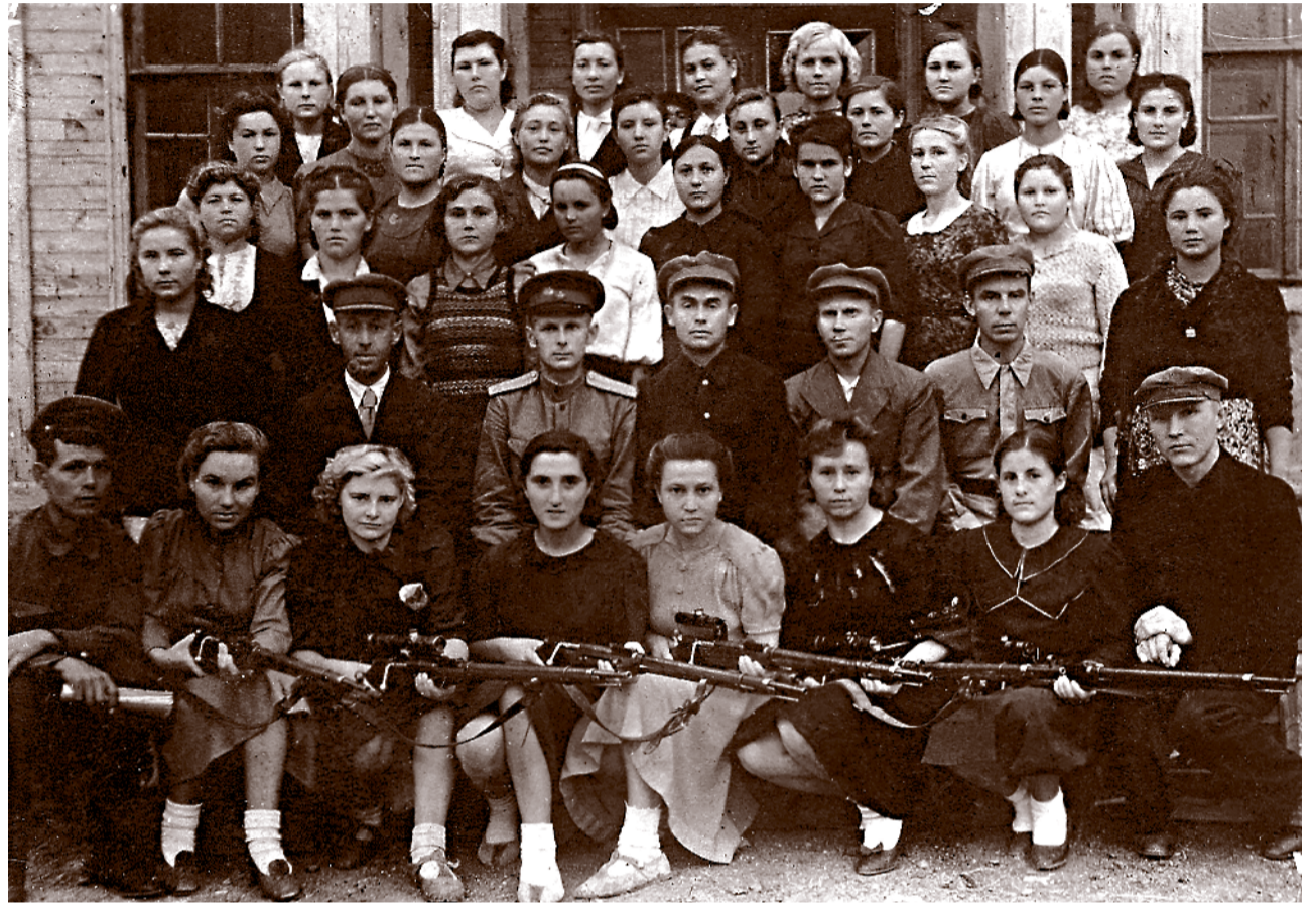
▲ Историкам удалось установить фамилии всего двух девушек с этой фотографии. Приглядитесь, возможно, на ней есть и ваши родственники

В годы войны лучшими снайперами становились люди с большим боевым опытом, отличными оценками на стрельбах, безграничной выдержкой и стальными нервами. Один из них наш земляк, выходец из деревни Еленкина Оренбургской губернии Василий Григорьевич Зайцев. С раннего детства умел обращаться с оружием, вместе с дедом ходил на охоту, бил дичь, обитавшую в южно-уральских перелесках. Летом 1942 года после нескольких рапортов с просьбой отправить на фронт Василий Зайцев попал в 284-ю стрелковую дивизию. В сентябре