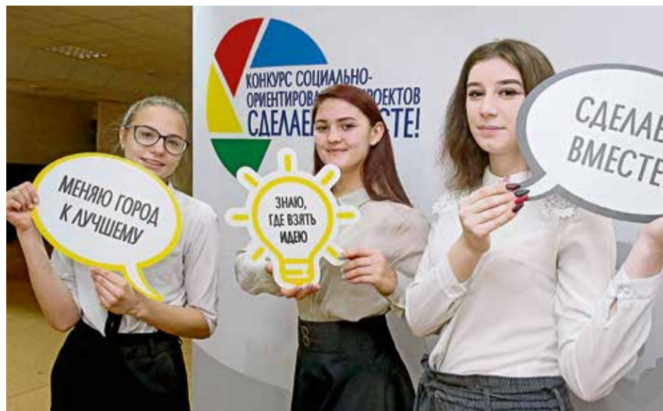
▲ Конкурс «Сделаем вместе!» объединяет инициативных и неравнодушных людей, кто заинтересован в улучшении города и качества жизни в нём

Основные направления конкурса «Сделаем вместе!» — развитие спорта и здорового образа жизни, образования, научного и технического творчества, волонтерского движения, культуры и народных традиций, популяризация семейных ценностей и помощь социально незащищённым слоям населения.