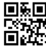
▶ Больше информации на Ntr.city