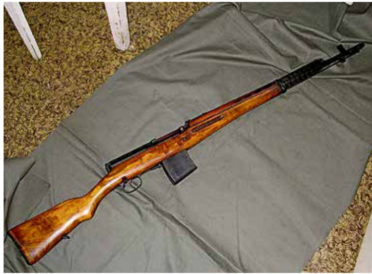
◀ Снайперский вариант винтовки Токарева СВТ-40 в начале войны заменил заслуженного ветерана — винтовку Мосина