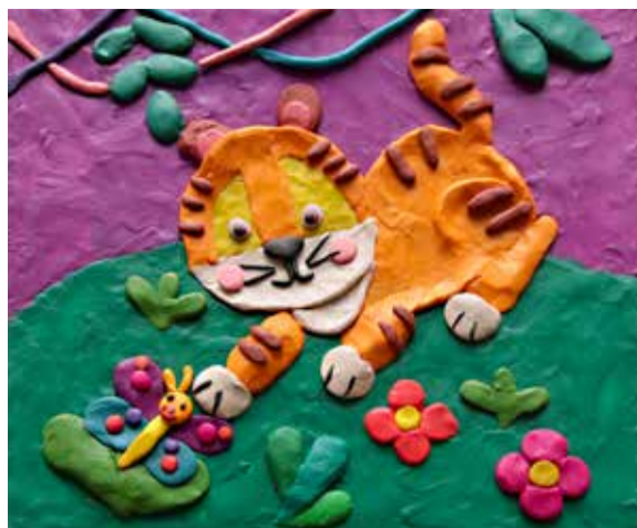
◀ Вариант рельефной пластилинографии от Ксении Вуйчич (7 лет)