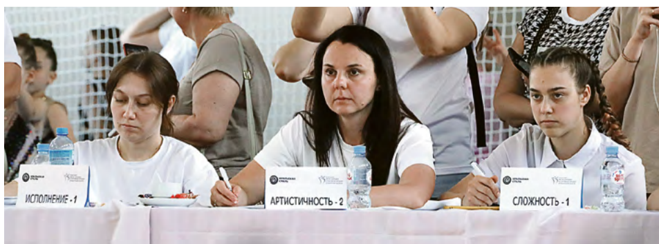
◀ Если спортсменам нужна концентрация только в момент показа номера, то жюри нельзя было терять сосредоточенности до последнего выступления