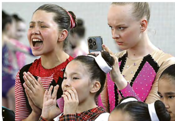
▲ На площадке ты максимально сосредоточен. А вне её можно дать волю эмоциям, переживая за каждый элемент, который исполняют участники твоей команды

Для меня год вышел результативным. Практически на всех выездных соревнованиях я была в тройке призёров. Думаю, толчок дал прошлогодний турнир, где я не попала в призы из-за сильной конкуренции. После него мы с тренером пересмотрели содержание программы, и всё получилось: у меня золото в индивидуальном выступлении, трио, группе и гимнастической платформе.