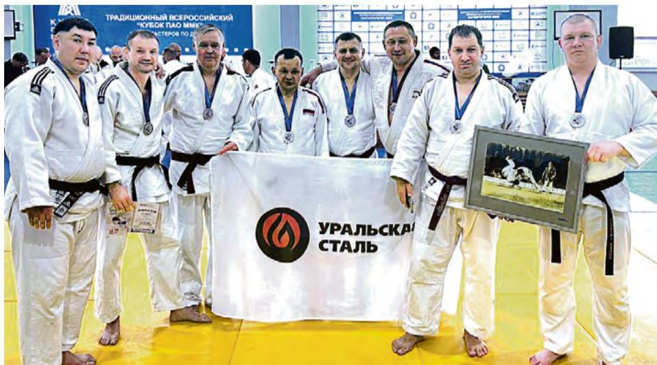
▲ Новотроицкая команда, костяк которой состоит из металлургов, на каждый выезд берёт с собой знамя с логотипом Уральской Стали

Сборная Новотроицка выставила на турнир 12 человек. Среди них традиционно были и работники Уральской Стали. Борьба за медали шла в семи весовых и трёх возрастных категориях: 30-39 лет, 40-49, а также ветераны старше