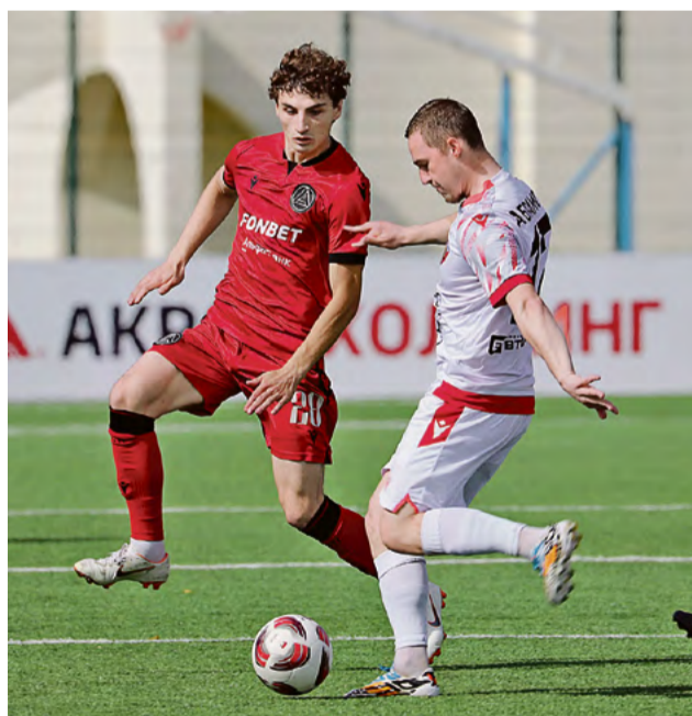
▲ «НОСТА», по мнению болельщиков, показывает неплохую комбинационную игру. При этом за восемь туров у команды лишь две победы над аутсайдерами таблицы — Акроном 2 и барнаульским «Динамо»

Александр Проскуровский Фото пресс-службы ФК «НОСТА»