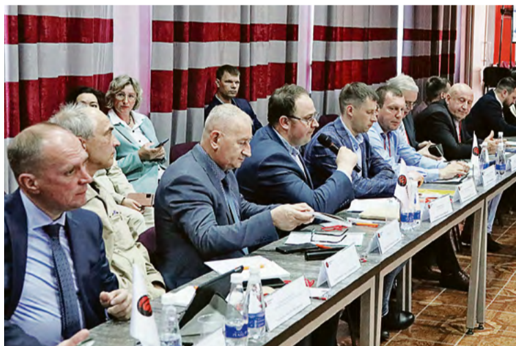
▲ Десятки руководителей предприятий откликнулись на призыв комбината встретиться, чтобы найти точки обоюдных интересов

— Строительство собственных объектов требует большого количества металлоконструкций, — говорит начальник инжинирин-