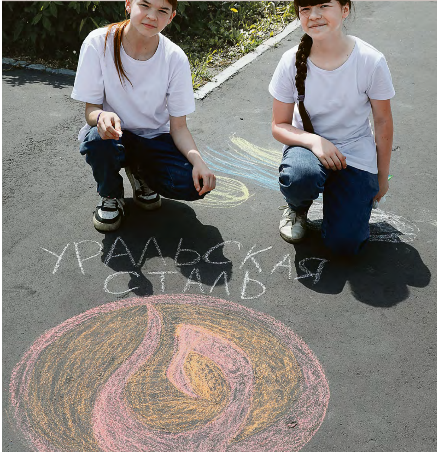
▲ В наборе для рисования не было чёрного мела, поэтому логотип Уральской Стали юные гости комбината выполнили в несколько непривычной гамме