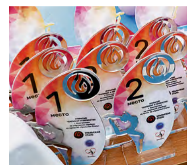
▲ Спортивная аэробика — очень медальный вид спорта. На соревнованиях в Новотроицке своих владельцев обрели 100 комплектов наград