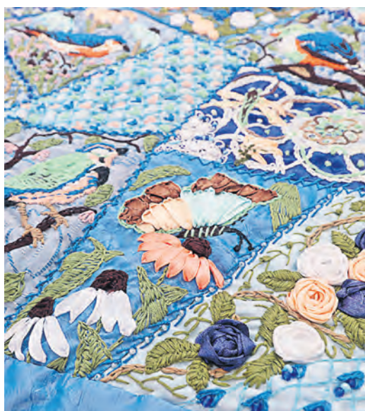
Вышивка лентами преобразит любой кусочек ткани