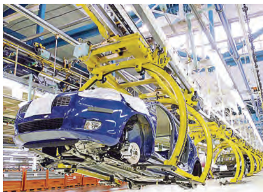
Европа начинает испытывать дефицит автостали