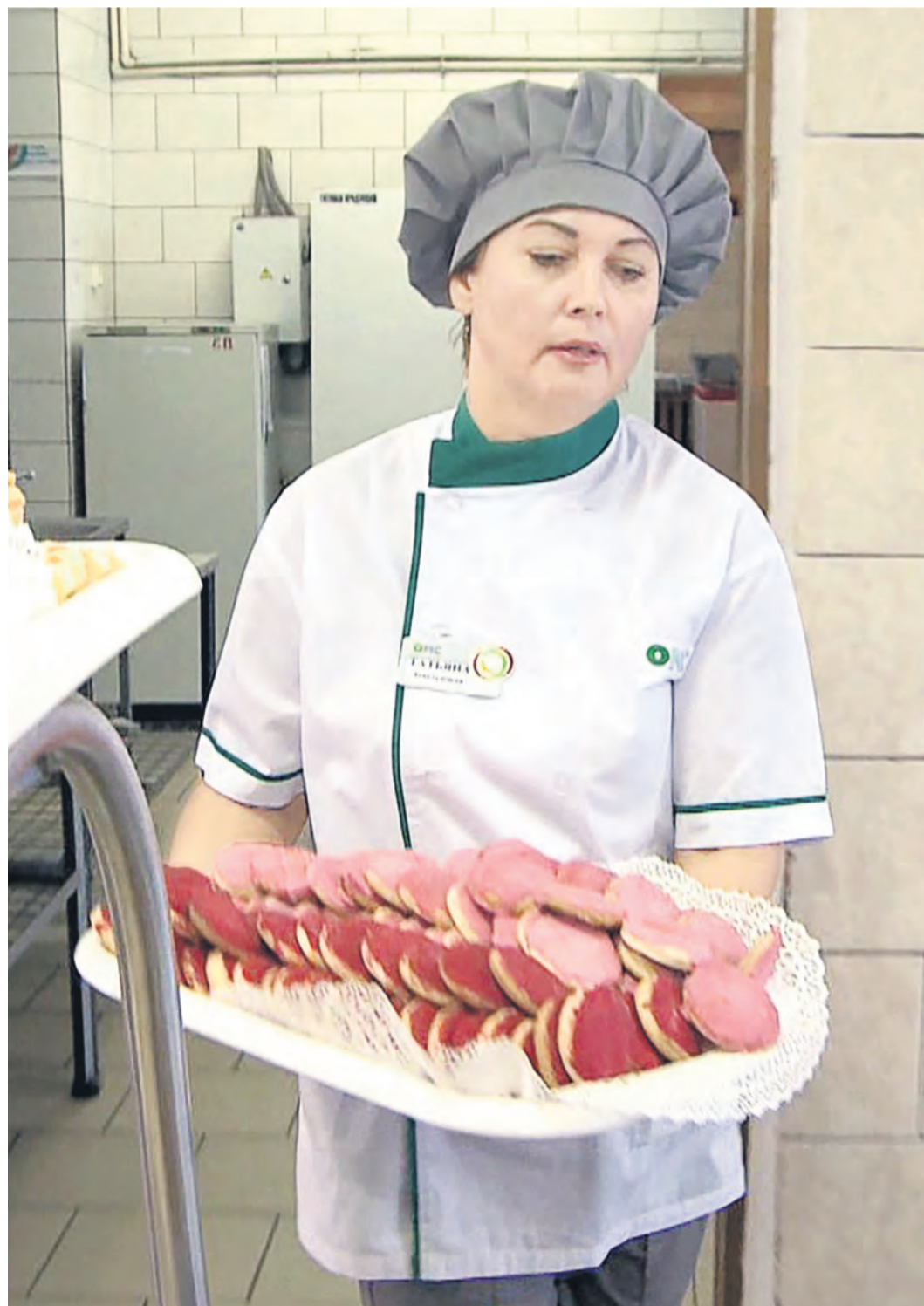
Небольшие презенты в столовых Уральской Стали создали предпраздничную атмосферу

Родившийся в России как дань памяти участию ЖЕНЩИН В ПЕТРОГРАДСКОЙ ДЕМОНСТРАЦИИ 8 МАРТА 1917 ГОДА СО ВРЕМЕНЕМ ПРАЗДНИК НЕСКОЛЬКО РАЗ МЕНЯЛ СВОЕ СМЫСЛОВОЕ НАПОЛНЕНИЕ.