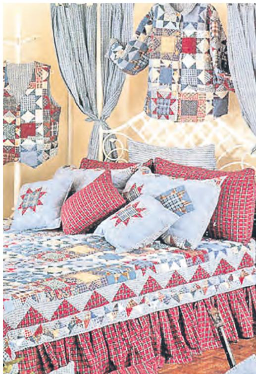
Пэчворк – мир безграничной фантазии