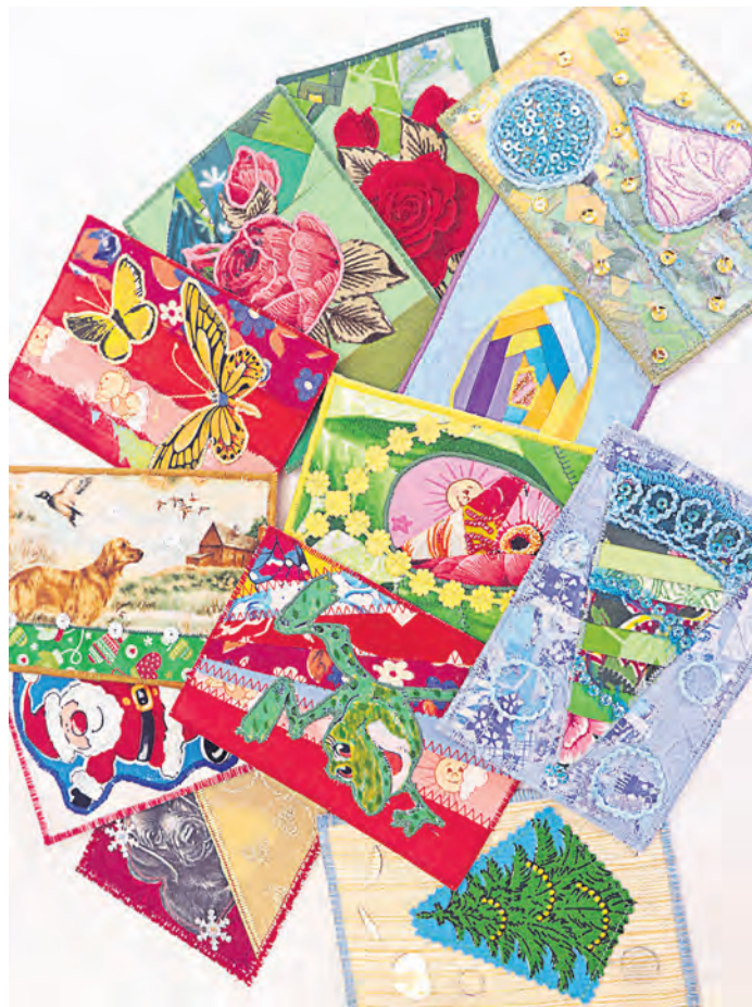
Оригинальные открытки из лоскутков