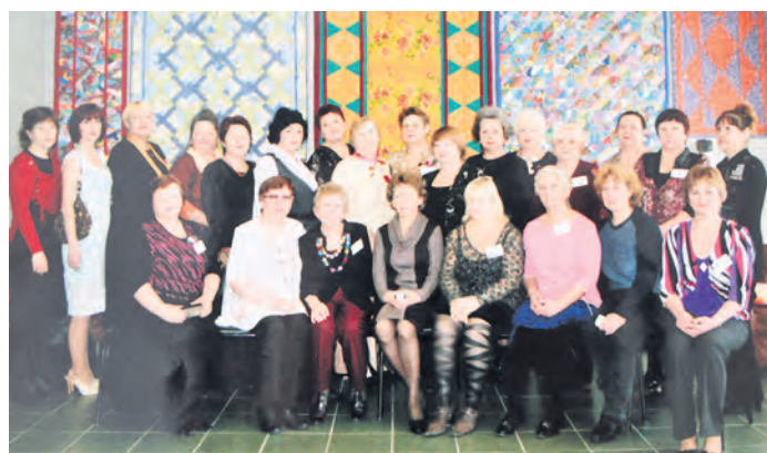
Участницы клуба «Степные узоры», 2011 год