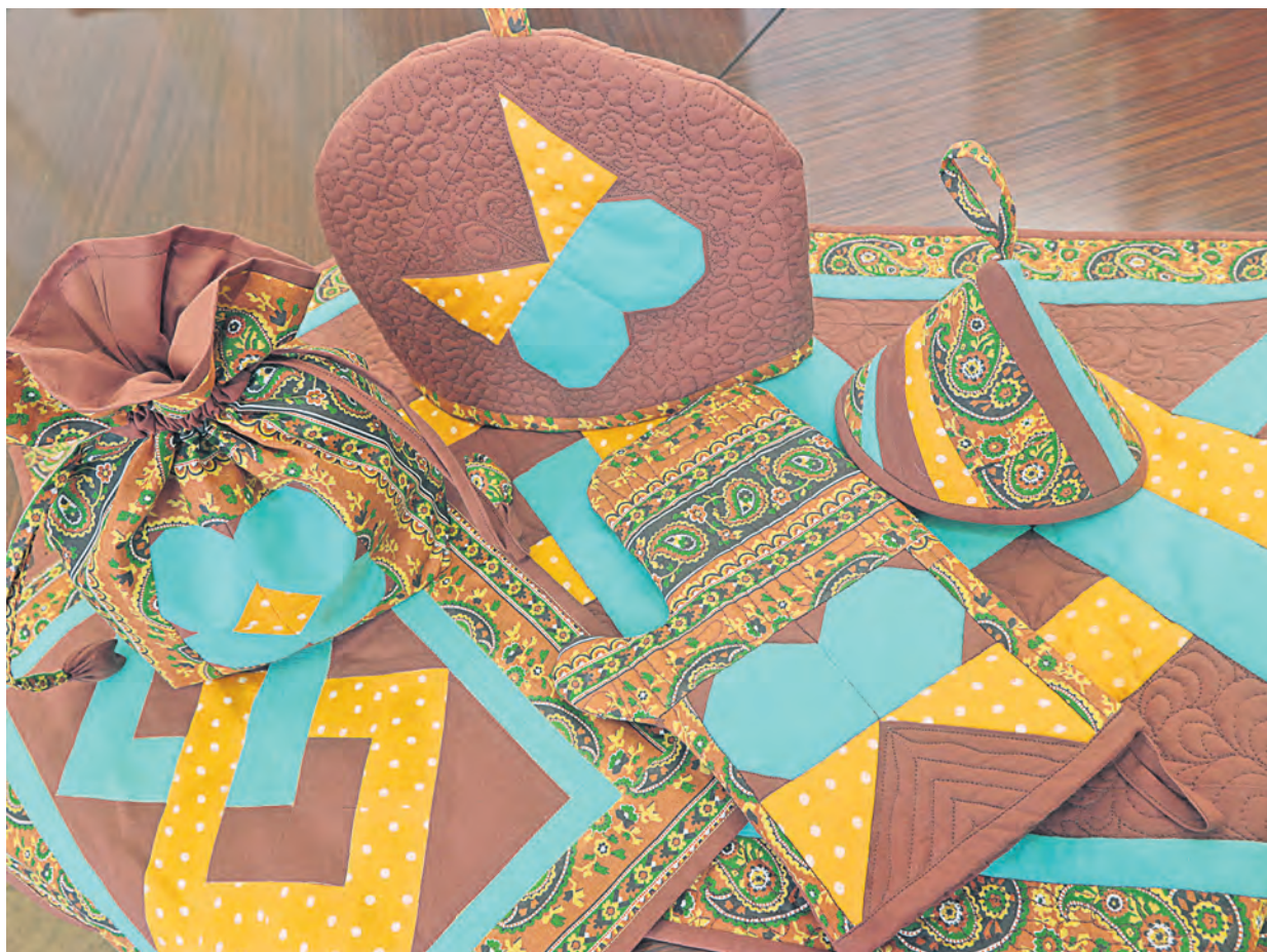
Лоскуты на кухне. Принадлежности для сервировки стола и хранения продуктов

Клуб любителей лоскутного шитья отметил десятую годовщину с момента создания сообщества единомышленниц. Все началось в конце 2008 года, когда в музее прошла выставка поклонниц пэчворка, а через месяц появились «Степные узоры».