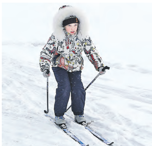
Любви к лыжам все возрасты покорны