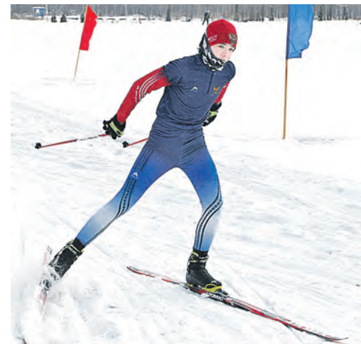
Молодежь отдает предпочтение коньковому ходу перед «классикой» даже на рыхлых участках трассы