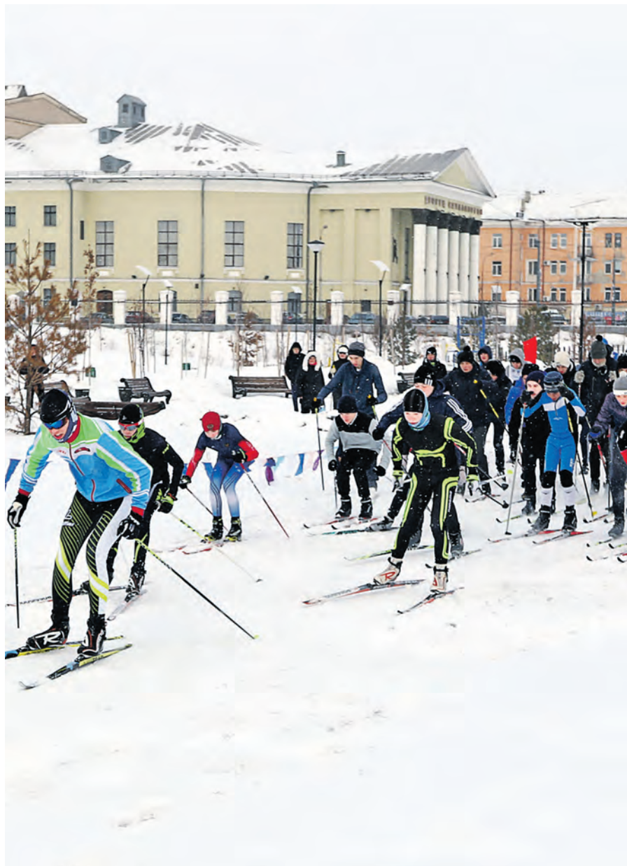
Самый массовый старт получился, как обычно, у юношей-школьников