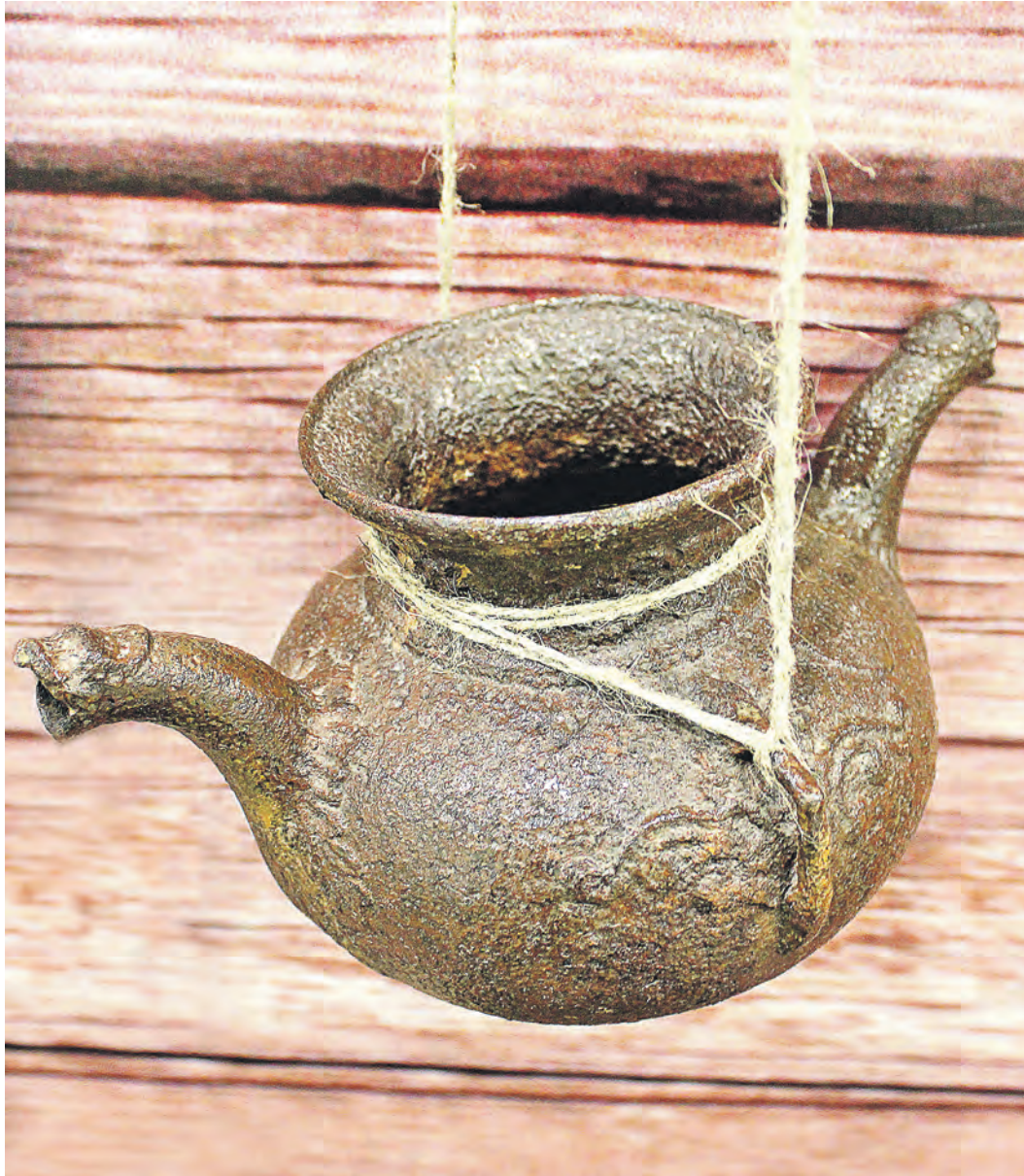
Необычный горшок с двумя носиками – лишь один из вариантов оформления специальной посуды для умывания, созданных нашими предками

Русская традиция предписывала обязательность мытья рук перед молитвой и едой. В царских палатах использовались фигурные рукомои в виде изящных кувшинов, инкрустированных драгоценными камнями. В простых домах их за-