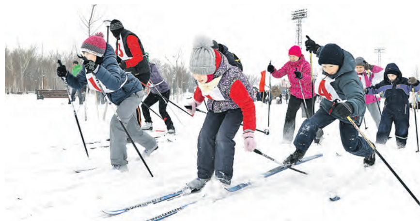
В гонке бывает всякое, но лыжника из команды Савиновых падение не выбьет из борьбы