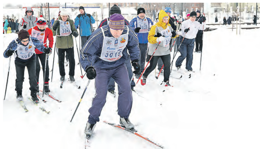
Этих людей старость точно дома не застанет

Александр Проскуровский