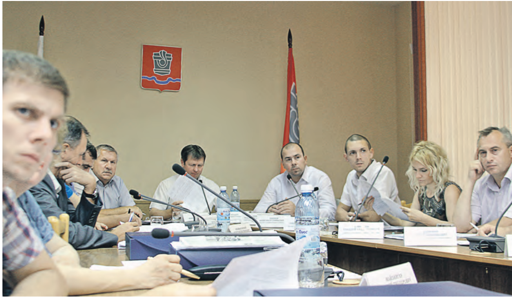
Дюжину вопросов повестки заседания депутаты обсуждали чуть больше часа

Кстати, с темы правопорядка заседание и началось – рассматривался отчет о деятельности полиции за первое полугодие. Возможно, местным силовикам получение