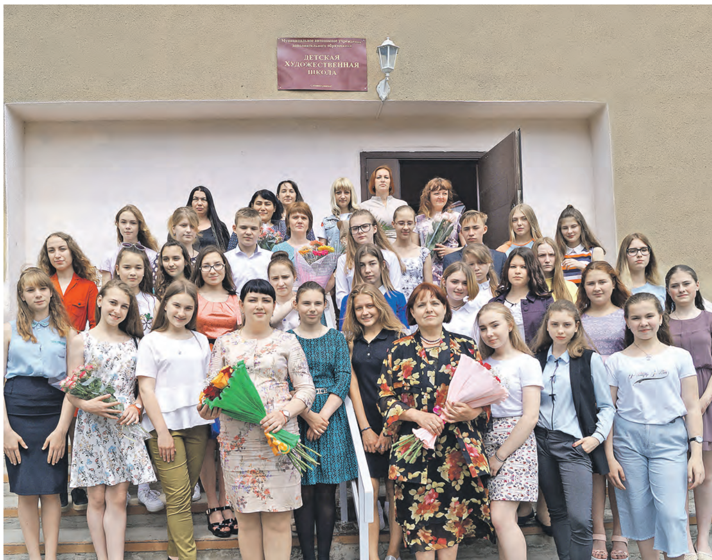
Запомните этих одаренных подростков из 25 выпуска детской художественной школы – они себя еще покажут!

В прошлом году городская детская художественная школа отметила 30-летие. И вот новое знаменательное событие: юбилейный, 25-й по счету, выпуск. Прежде чем получить свидетельство об окончании ДХШ, каждый из 31 выпускника представил на суд авторитетного жюри дипломную работу.