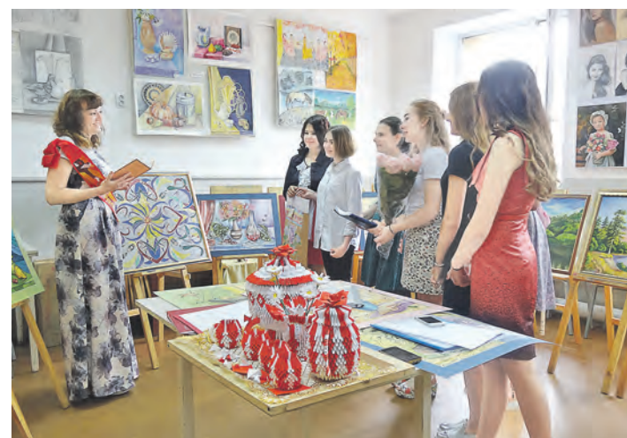
Для вас, мои любимые выпускники, всегда открыта в школу дверь