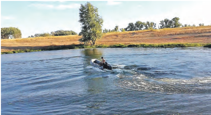
Участники форума обсудят роль и вклад женщин в улучшение экосистемы

Участники форума, приуроченного к проведению Дня Урала, обсудят роль и вклад женщин в улучшение экосистемы и сохранение биоразнообразия бассейна реки Урал, в