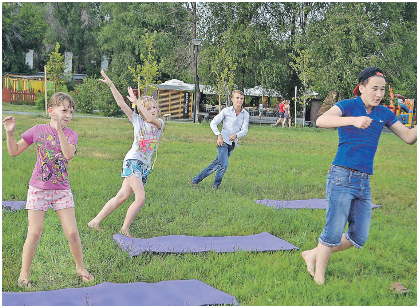
Пробный выход на газон в парке собрал немало желающих приобщиться к фитнес-аэробике

В Молодежном центре продолжается активная подготовка добровольцев для работы по проекту «Фитнес в парке», который реализован в городе при поддержке Metalloinvesta.