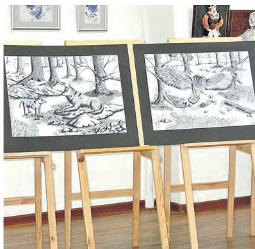
Художник начинается с умения рисовать карандашом