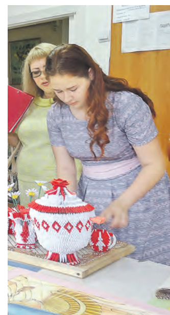
Все жанры декора – в практику!