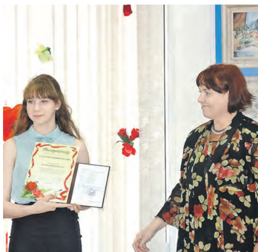
Ребята шли к этому моменту долгих восемь лет

В городской детской художественной школе состоялся 25 выпуск. Ребята защитили дипломные работы и получили свидетельство об окончании ДХШ.