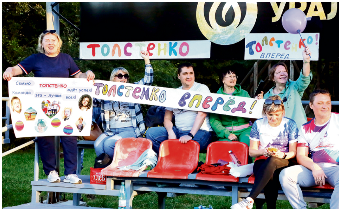
▲ Пожалуй, в следующем году жюри стоит подумать над специальным призом для команд с самой активной группой поддержки