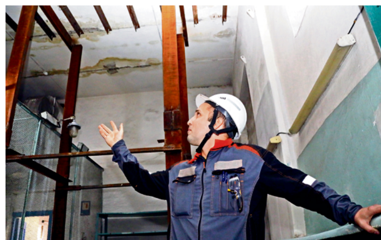
▲ В ближайшие дни ремонтники уберут страхующие конструкции. О ремонте будет напоминать только ряд уголков на одной из плит перекрытия

Все работы заняли одну смену и не отразились на функционировании одного из предприятий Уральского сервиса. А через несколько дней подрядчик восстановил герметичность крыши, уложив на ней новое покрытие.