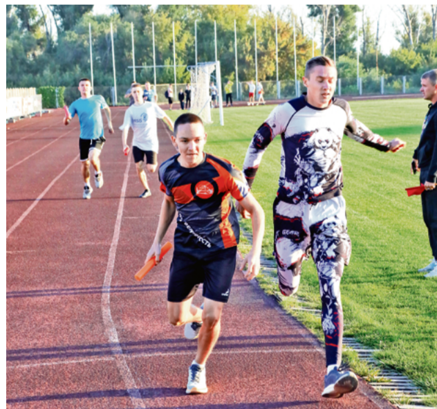
▲ Команда НПК в этот раз не оставила шансов студентам НФ НИТУ «МИСИС» и листопрокатчикам

Женщинам предстояло пробежать равные стоме-