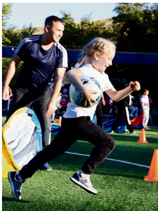
▲ Половина этапа, на котором есть препятствия, позади. А значит, можно со всех ног лететь к финишу, на котором тебя ждут родители