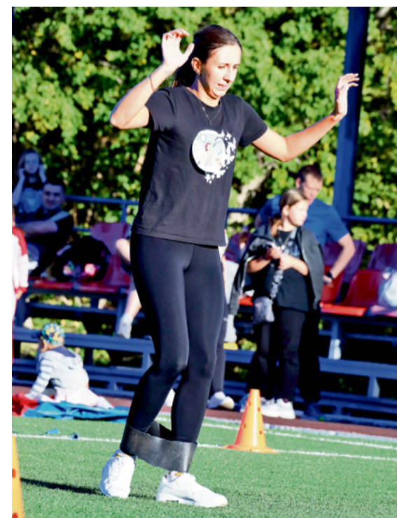
▲ Когда тебя от широкого шага удерживает резиновое кольцо на ногах, важна уже не скорость перемещения, а способность сохранить равновесие