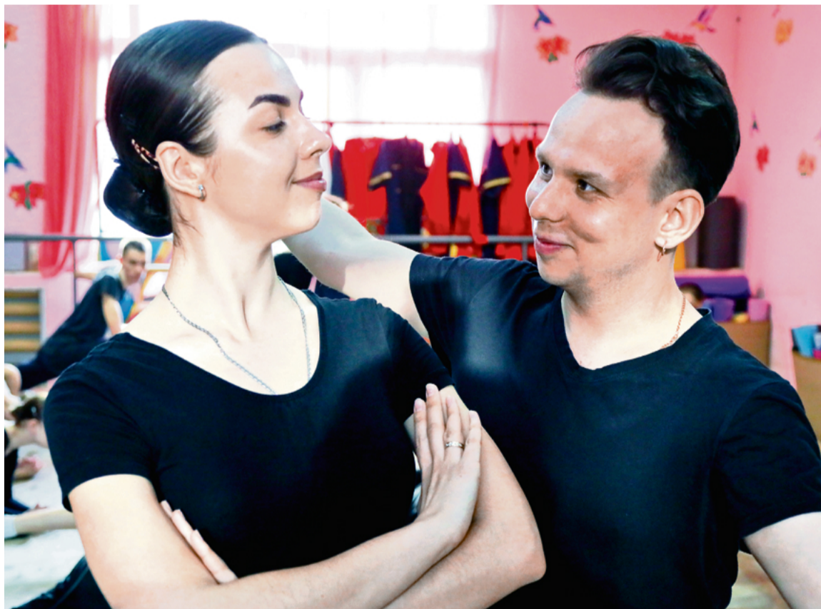
▲ Пока во Дворце металлургов идёт капитальный ремонт, ансамбль «Молодость» перенёс репетиционную площадку в Молодёжный центр

— А сами о профессиональной карьере в танцах не мечтали?