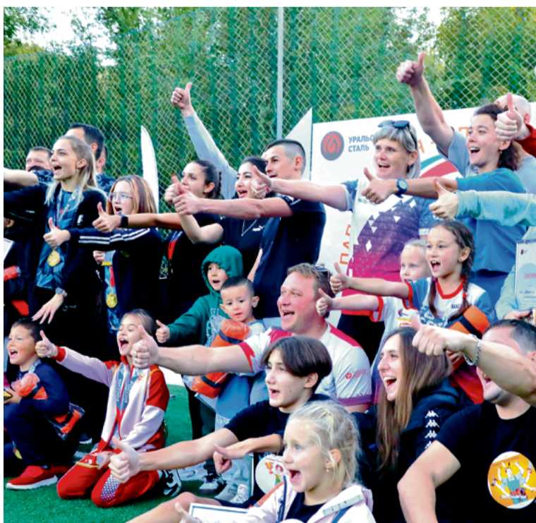
▲ Семьи, чьи дети не перерастут обозначенные жюри возрастные рамки, смогут сделать такую фотографию и на следующий год