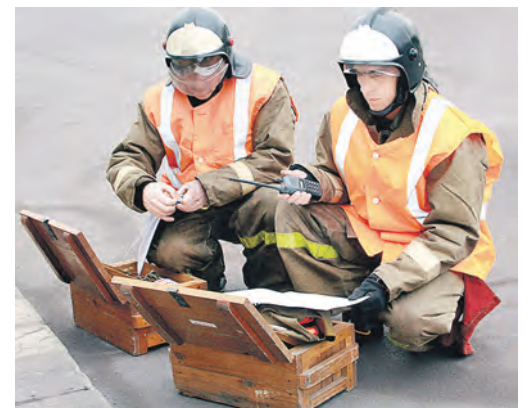
Штаб, развернувшийся возле входа в здание, координирует действия спасателей и пожарных