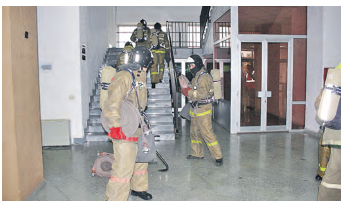
В фойе заводоуправления огнеборцы готовятся подключить пожарные рукава, чтобы подняться на второй этаж здания для ликвидации пожара