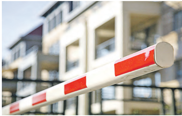
Нарушение границы чревато тюремным сроком

Но запреты и границы любви не помеха. Очарованная женщина, подобно жене декабриста, отправилась в след за любимым в сопредельное государство. Там они поженились. При регистрации брака мужчина, понимая, что