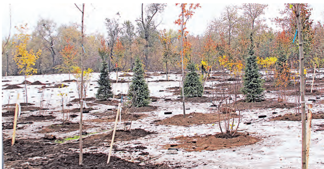
Вроде бы ель обыкновенная, а какую красоту вносит в окружающий ландшафт своей вечнозеленой краской!