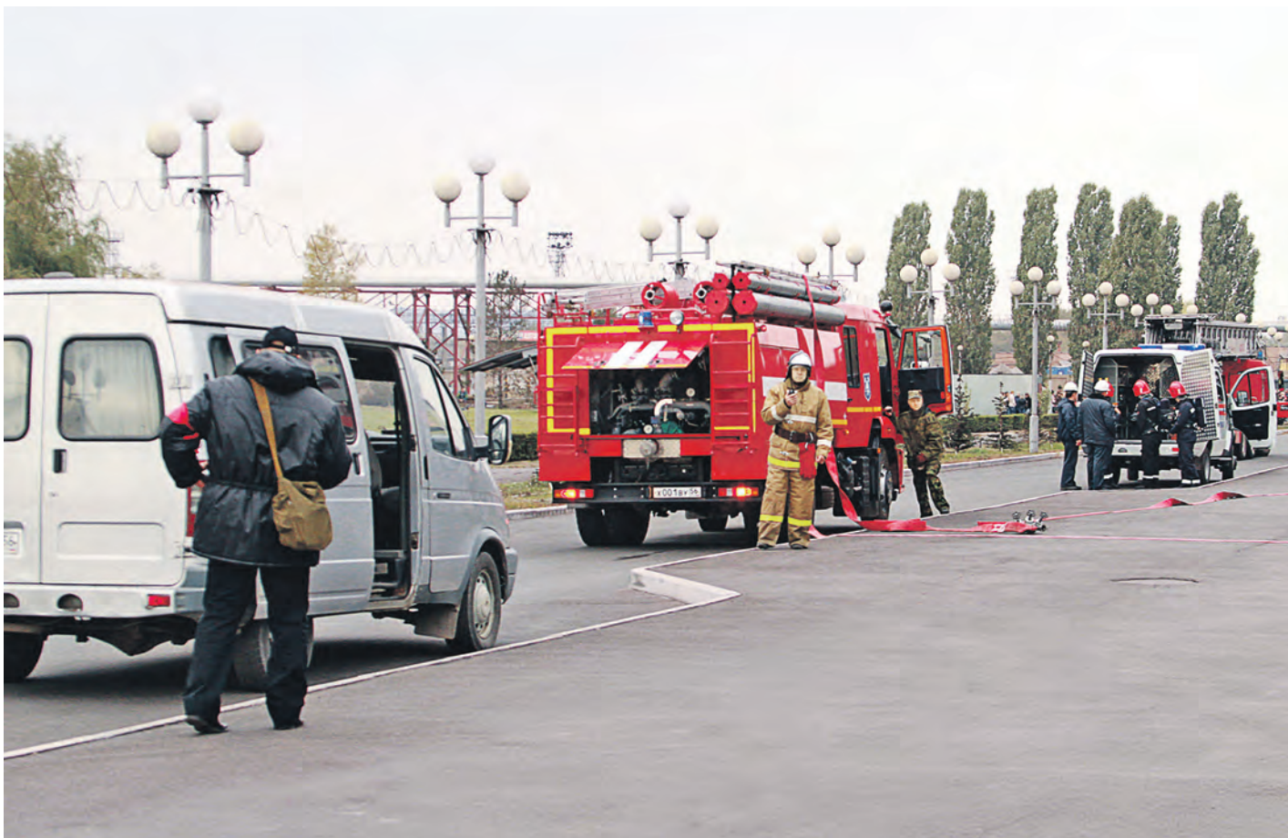
Прибывшие пожарные принимают руководство спасательной операцией на себя

Они не ропщут на судьбу, она дана им от рождения... Покой сменили на борьбу – по зову сердца, вдохновенья. Отбросьте смех на все года – в пожарных доля не простая: в ней риск присутствует всегда, им в лица смерть смеется злая