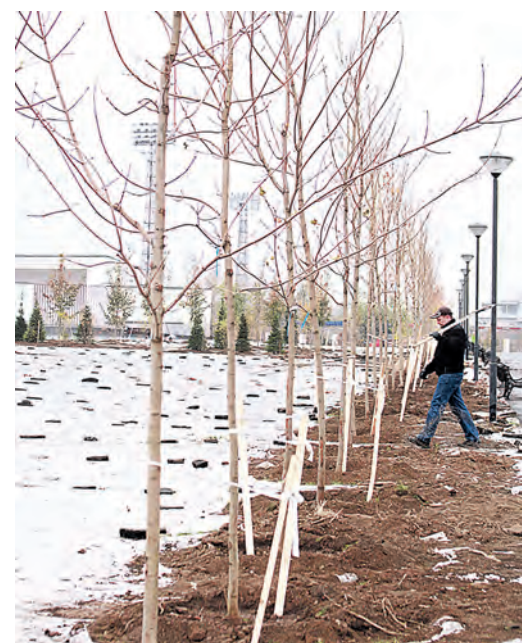
Парк – это наш вклад в акцию «Миллион деревьев»

Александр Проскуровский