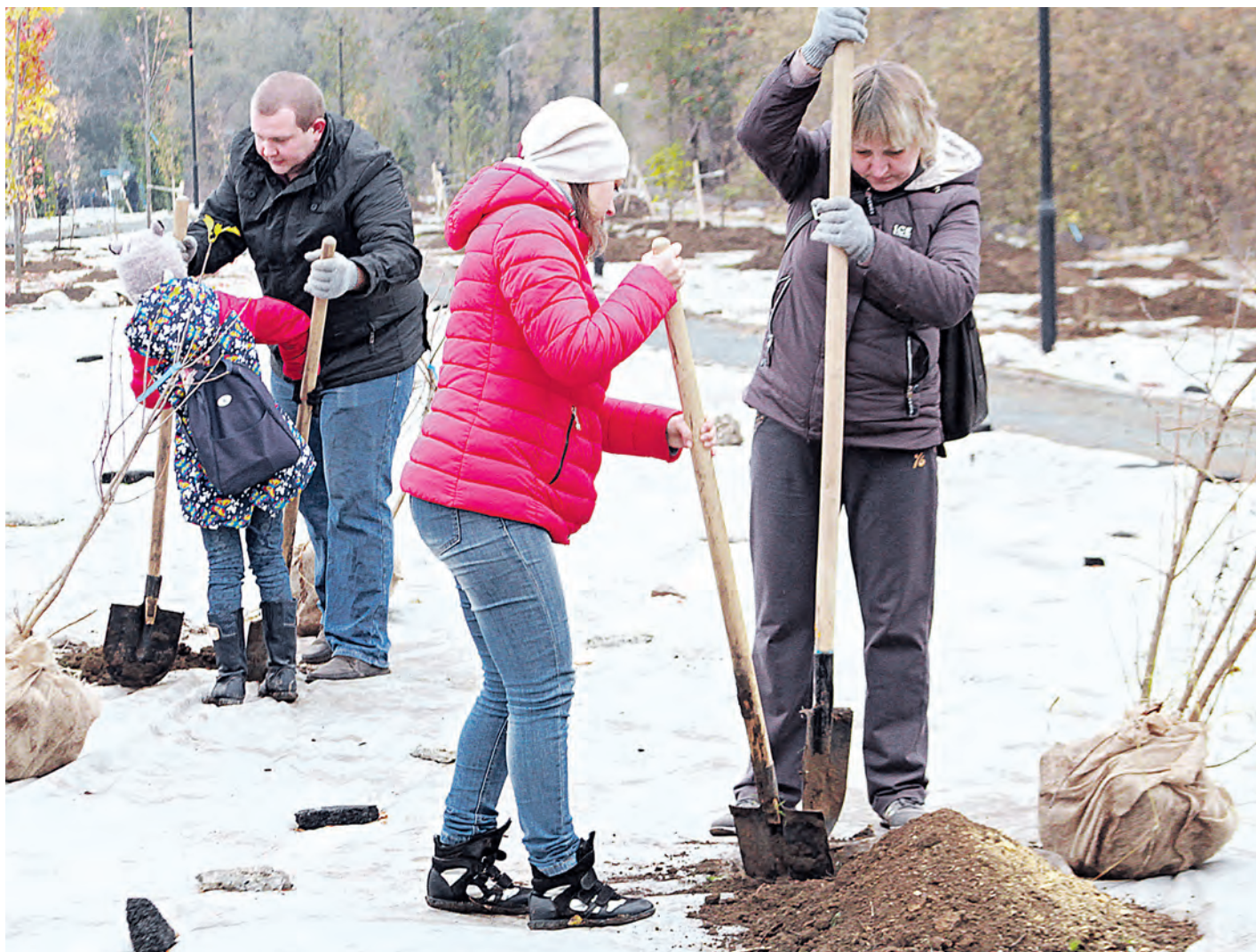
Акции Металлоинвеста по озеленению парка помогают каждому новотройчанину внести свою лепту в благоустройство города

В городском парке завершился третий этап озеленения. Он прошел в лучших традициях субботников. Новотройчанам всех поколений высажены около 450 различных деревьев и кустарников. Зеленый ландшафт парка всё больше приобретает законченный вид.