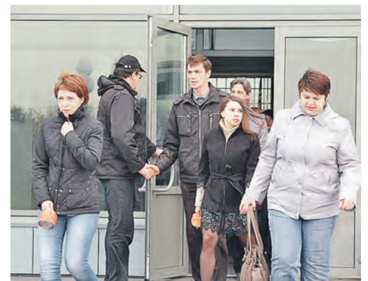
Во время учений по ЧС на 15 минут сотрудники заводоуправления лишились своих рабочих мест