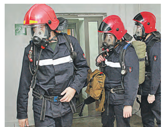
Газоспасатели выполнили свою часть работы, пострадавших не обнаружили