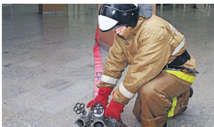
Алгоритм действий пожарных расчетов отработан. Здесь знает каждый свое дело и место в команде. А по рации ведется связь со штабом