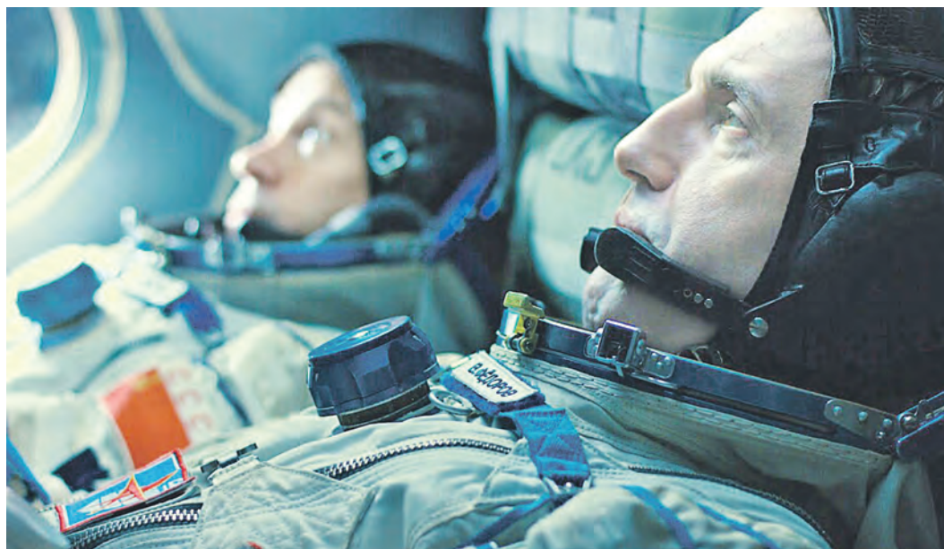
Если вдуматься, то во всяком труде есть большая доля ежедневной рутины, но некоторые профессии заслуженно имеют ореол романтических, потому что в них очень часто тяжесть решения нужно нести в одиночку

Подвиг советских космонавтов, естественно, был, но в удачно завершившемся (без жертв) труде двоих ученых, которым, к тому же, не мешали ни американцы, ни