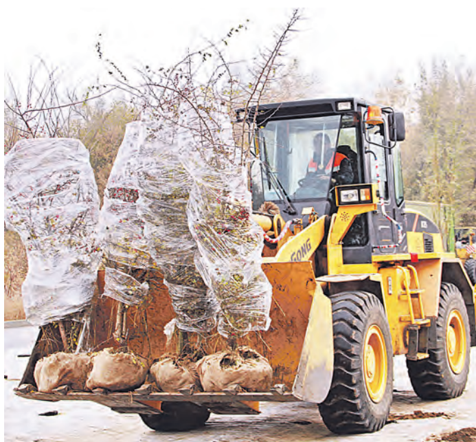
Погрузчик в этот день накрутил не один километр, развозя саженцы