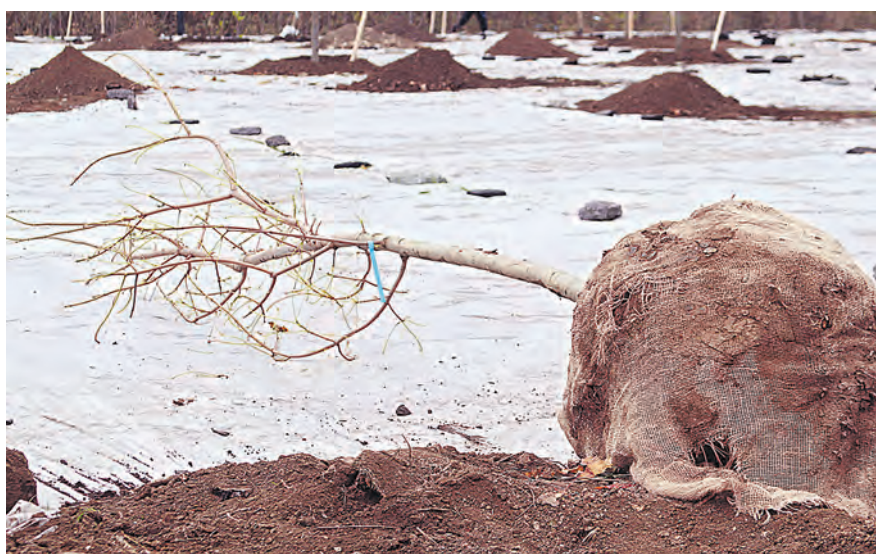
Саженец только готовят к посадке, а трава под специальной пленкой уже дает всходы