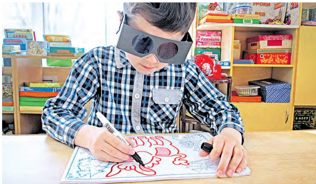
Комплект «Радуга» с очками из разных стекол позволяет почувствовать себя юным волшебником