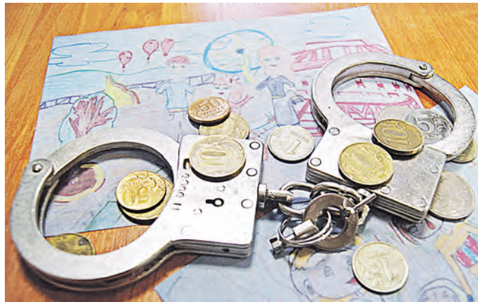
Верховный суд определил, кто кому должен