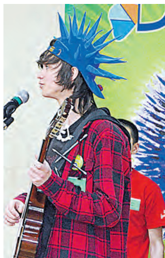
Ёжик стал талисманом фестиваля