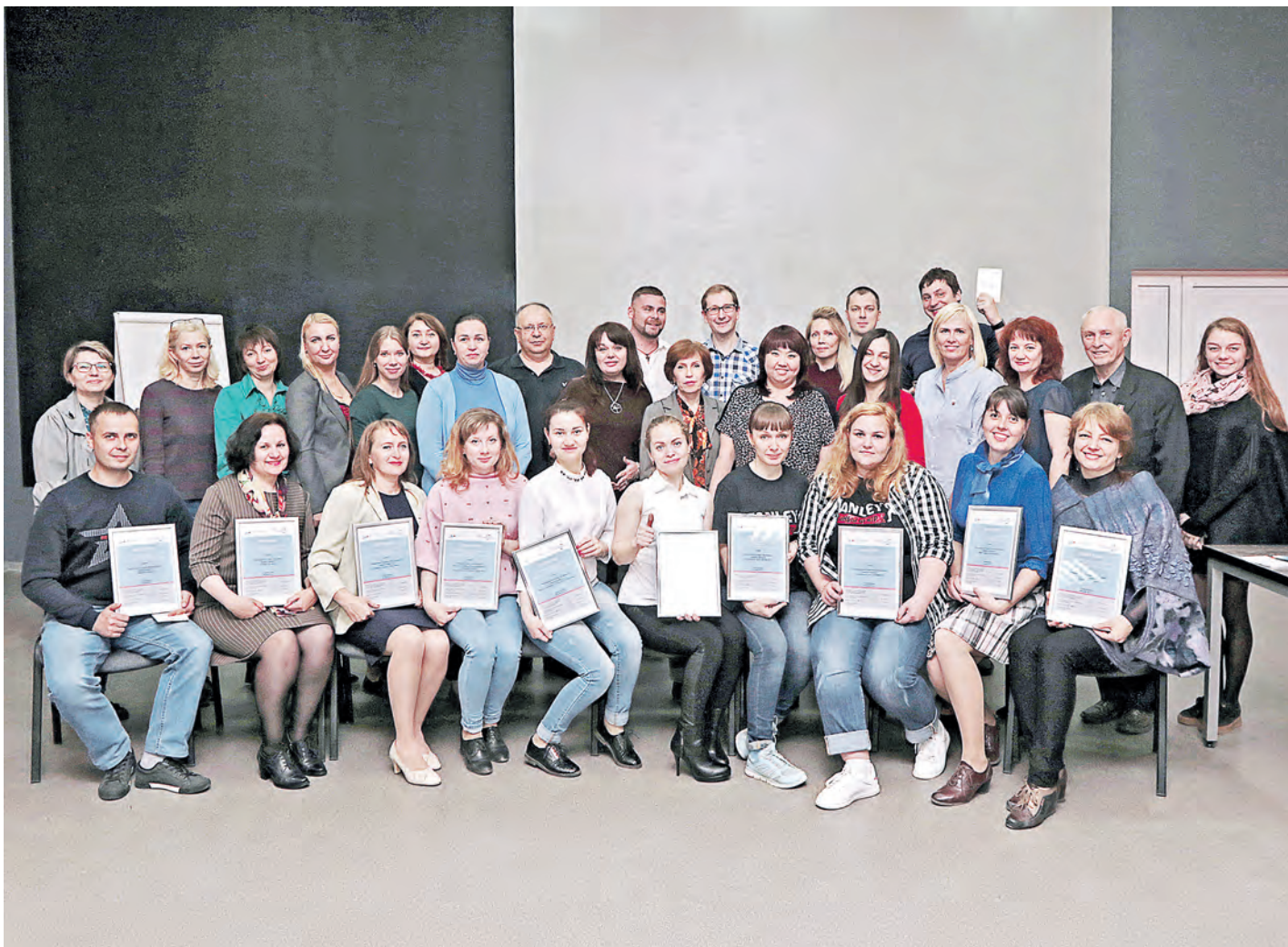
Проекты нескольких выпускников уже доказали свою состоятельность, остальные готовы сделать это в ближайшее время

В минувшие выходные свои бизнес-проекты защитили участники Школы предпринимательства, которая действует на базе новотроицкого филиала НИТУ «МИСиС».