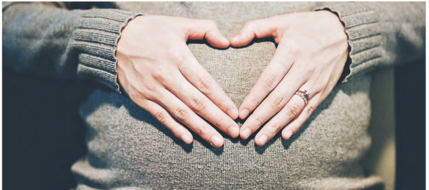
Женщина радовалась первым толчкам в животе, потихоньку обустроила детскую, накупила пеленок, оставалось подождать и ехать в роддом