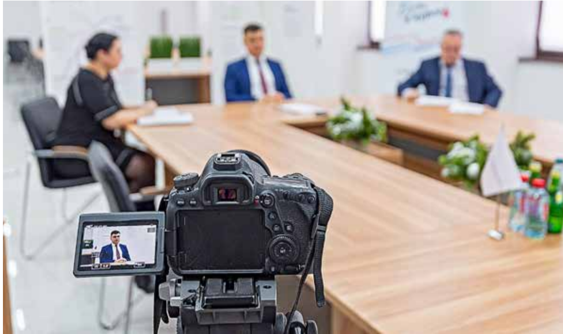
▲ День информирования «Будь в курсе!» позволил работникам Уральской Стали ещё раз проанализировать (а кому-то — и переосмыслить) итоги 2021 года

Р уководитель сообщил о предстоящем техническом перевооружении предприятия, на которое Металлоинвест планирует выделить 1,3 млрд рублей. Среди основных проектов этого года — ремонт доменной печи № 4, демонтаж зданий и сооружений, ремонт помещений непроизводственного назначения, природоохранные мероприятия. Финансирование программы капитальных затрат на 2022 год составит 4,4 млрд рублей.