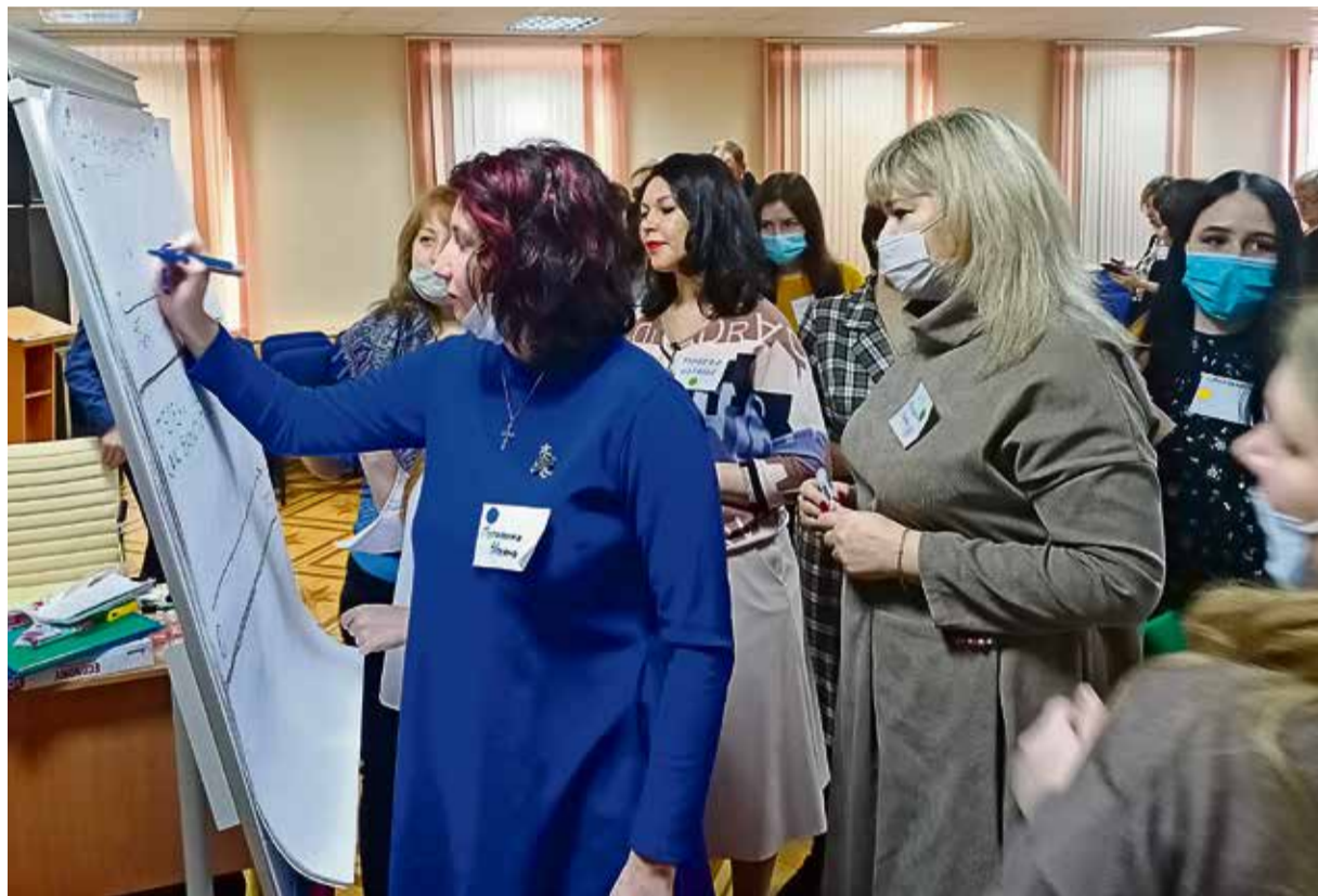
▲ В развитии программы заинтересованы все: от руководителей Металлоинвеста до горожан самого разного возраста и профессий

На встречу, посвящённую перспективам развития городских проектов, пришли представители Металлоинвеста, Уральской Стали, городской администрации, некоммерческих организаций, а также победители, участники и бизнес-партнёры программы «ВМЕСТЕ! С моим городом».