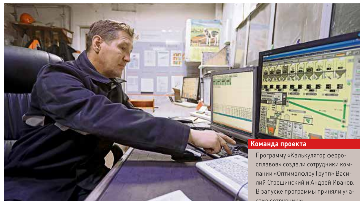
▲ Даже внешне новая компьютерная программа похожа на калькулятор своими строго расчерченными квадратиками таблиц

Вторым этапом внедрения «Калькулятора ферросплавов» будет сортамент для МНЛЗ-2. Как и в первом случае, подготовка предстоит длительная: в базу данных нужно внести технологические