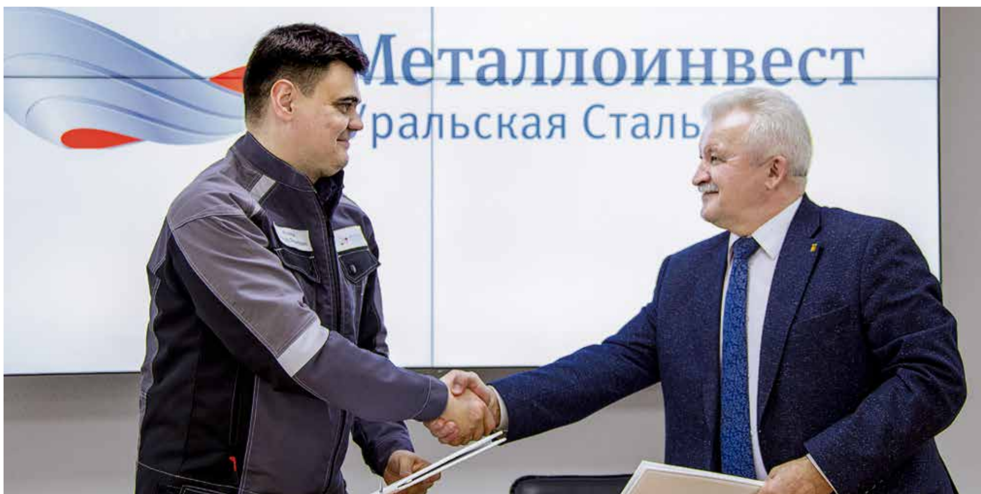
▲ Крепкое рукопожатие в знак того, что все интересы работников Уральской Стали, прописанные в Коллективном договоре, будут неукоснительно соблюдаться