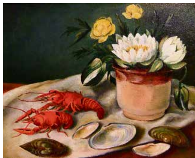
▲ Даже от уменьшенной копии этого натюрморта текучт слюнки — настолько точно автор поймала колорит

ным обойным клеем! Даже до покрытия лаком они сверкали краше драгоценных камней. А мозаика из яичной скорлупы — практически ваше ноу-хау.