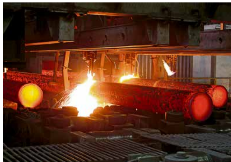
▲ «Нарастили объёмы производства стали более чем на два процента и почти на пять процентов реализацию товарной литой заготовки в адрес Выксунского металлургического комбината»

Комбинат всегда был и будет надёжной опорой Новотроицка. Помимо исполнения наших обязательств по отчислению налогов, мы продолжим поддерживать развитие города, где живут и работают наши сотрудники и их семьи. Совместно с руководством города и региона будем преобразовывать Новотроицк, чтобы сделать его комфортным и интересным.