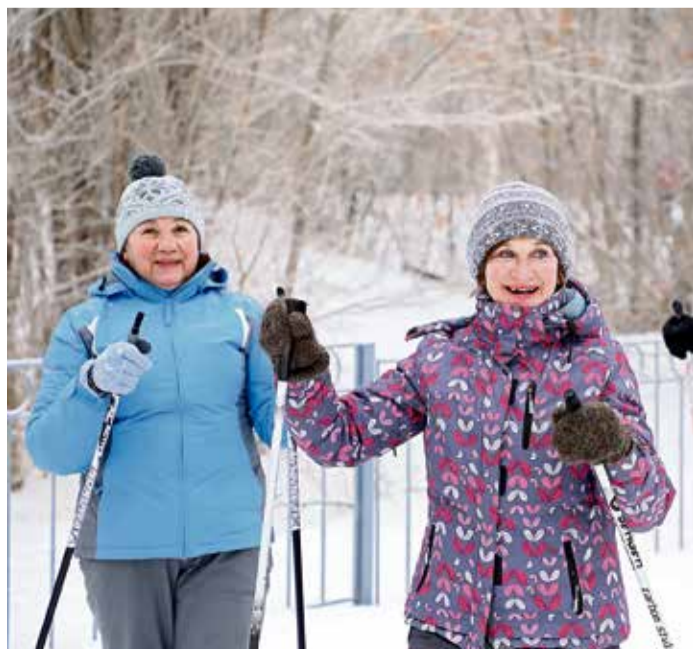
▲ Мороз и солнце... и хорошее настроение!