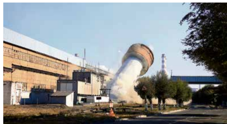
▲ «В 2021 году мы приступили к реализации программы по улучшению облика предприятия... с демонтажем устаревших, не используемых зданий и сооружений»