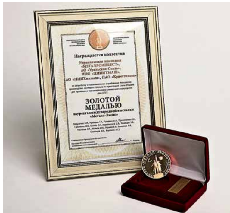
▲ «Наша криогенная сталь неоднократно отмечена золотыми медалями на международных промышленных выставках «Металл-Экспо»