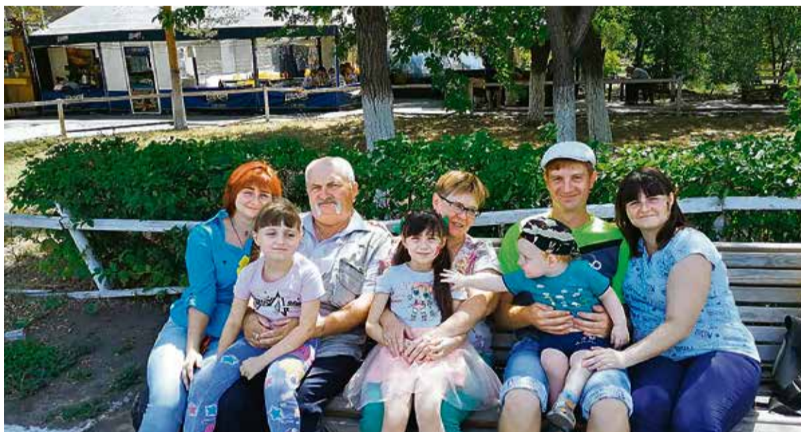
▲ Встречи в родительском доме в Новоорске — всегда праздник!