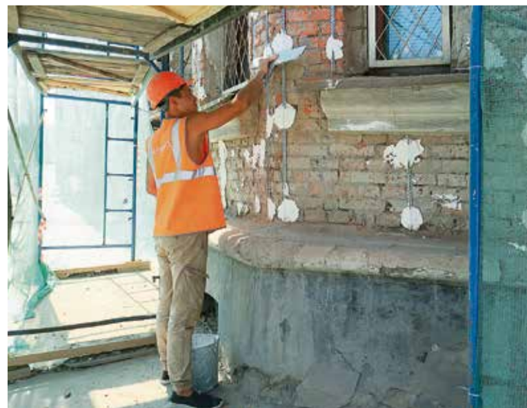
▲ «Совместно с руководством города и региона продолжим преобразование Новотроицка, чтобы сделать его комфортным и интересным»

Для удержания позиций на рынке необходимо обеспечить снижение себестоимости производства, ориентироваться на выпуск высокомаржинальной продукции. Но главный ориентир — это решать задачи клиента, в конечном итоге определяющего твою востребованность на рынке.