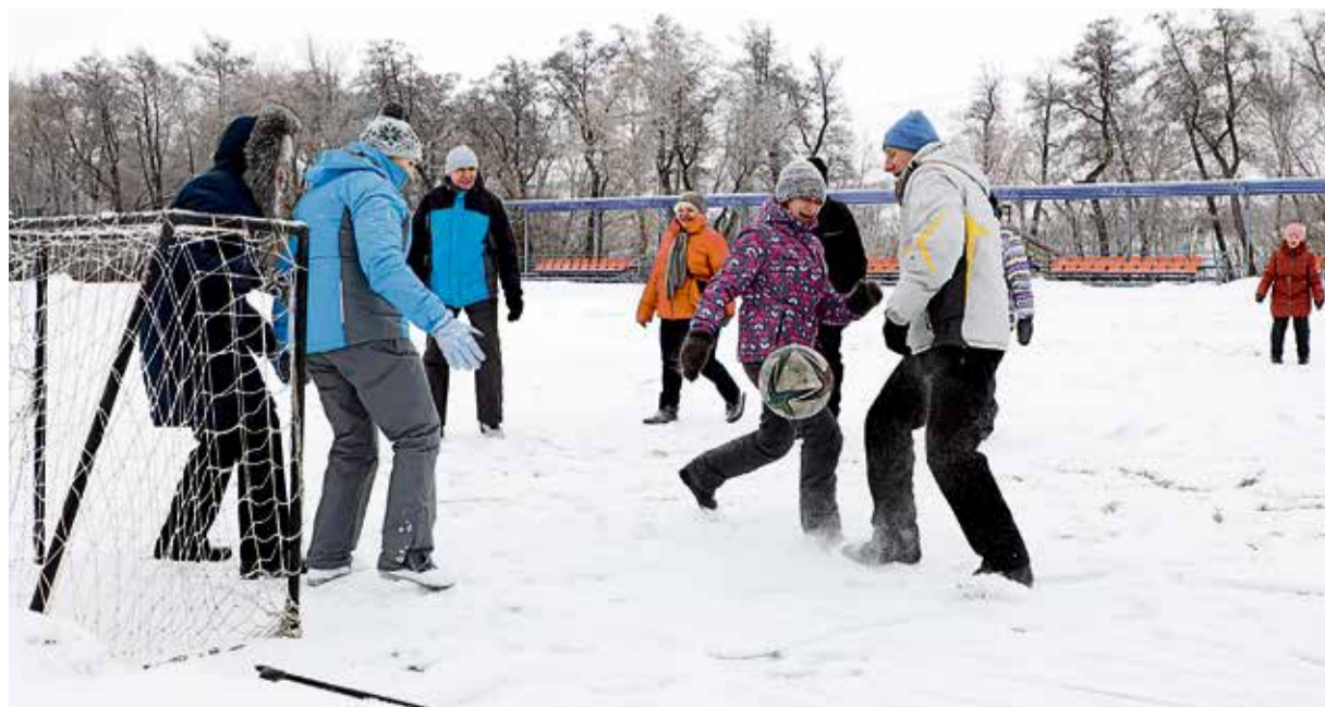
▲ Футбол, как и металлургия, — дело командное