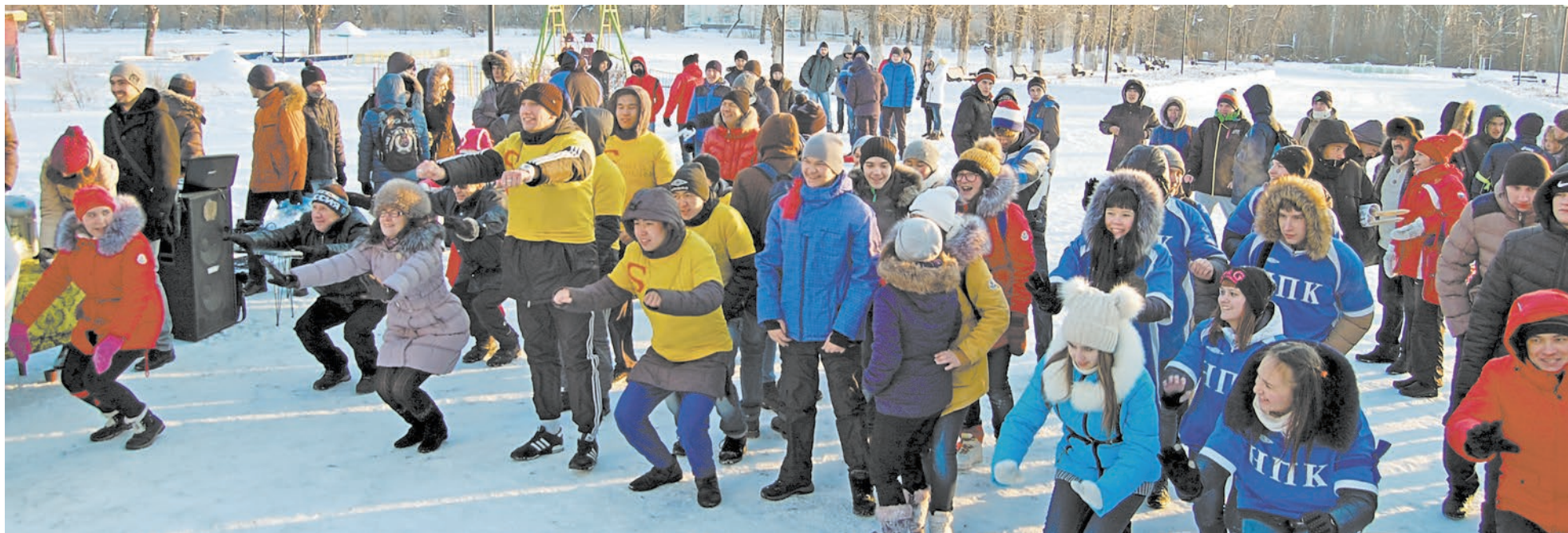
Участники флешмоба «Зарядка» улыбались и приговаривали: «В каких только местах ни делали гимнастику, а в зимнем парке довелось впервые!»

Каждая акция городской общественной организации «Союз ветеранов физической культуры, спорта и туризма Новотроицка» радует новизной и креативностью.