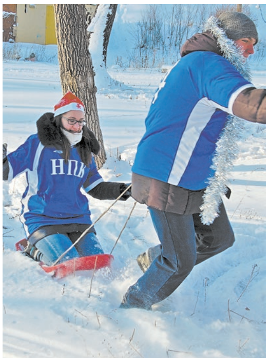
Станцию «Эх, прокачу!» преодолевают студенты НПК

Поначалу на эстафетной дистанции сборная Школьной лиги КВН не была фаворитом. Веселье и находчивые даже внешне выглядели менее атлетично по сравнению, допустим, с высокими и плечистыми миссовцами. Но потерянные в спортивных заданиях очки кавээнщики добирали в заданиях интеллектуальных. И