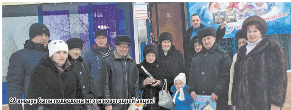
26 января были подведены итоги новогодней акции!

С 1 февраля 2016 года по 1 февраля 2017 года все клиенты, заключившие сделки в нашем агентстве, участвуют в розыгрыше недвижимости!!! Все вопросы по телефону.