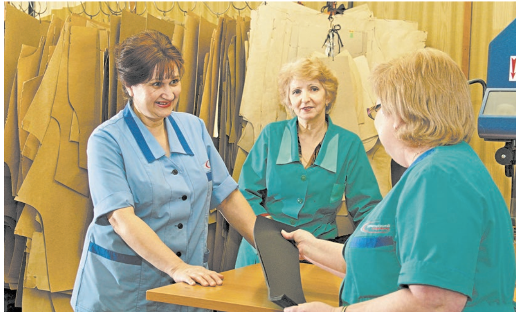
Ни одно изделие не уходит в массовый пошив, не пройдя предварительного тестирования