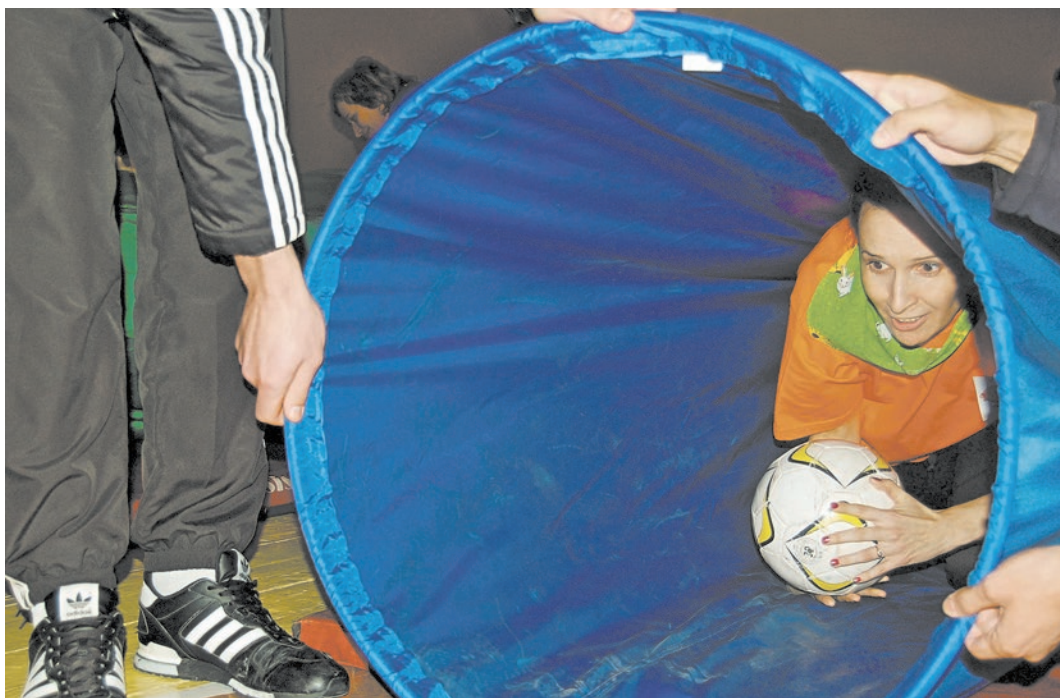
Всё на свете когда-нибудь кончается. Вот и в конце этого туннеля свет забрезжил

в итоге победили. На втором месте миссовцы, на третьем — студенты политехнического колледжа. За волю к победе отмечены студенты строительного техникума и сборная молодежная команда местных организаций Всероссийского общества инвалидов.