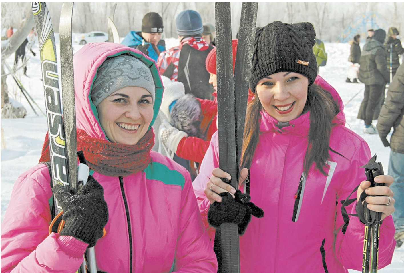
На лыжах за здоровым образом жизни

Победу в первом этапе корпоративной спартакиады-2016 праздновали женщины-спортсменки ветеранской организации комбината и мужчины сборной дирекции по ИТ и финансовой.