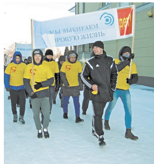
Заявляем всему городу: мы за здоровый образ жизни!

Александр Проскуровский