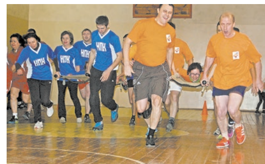
После свежего воздуха — соревнования в зале