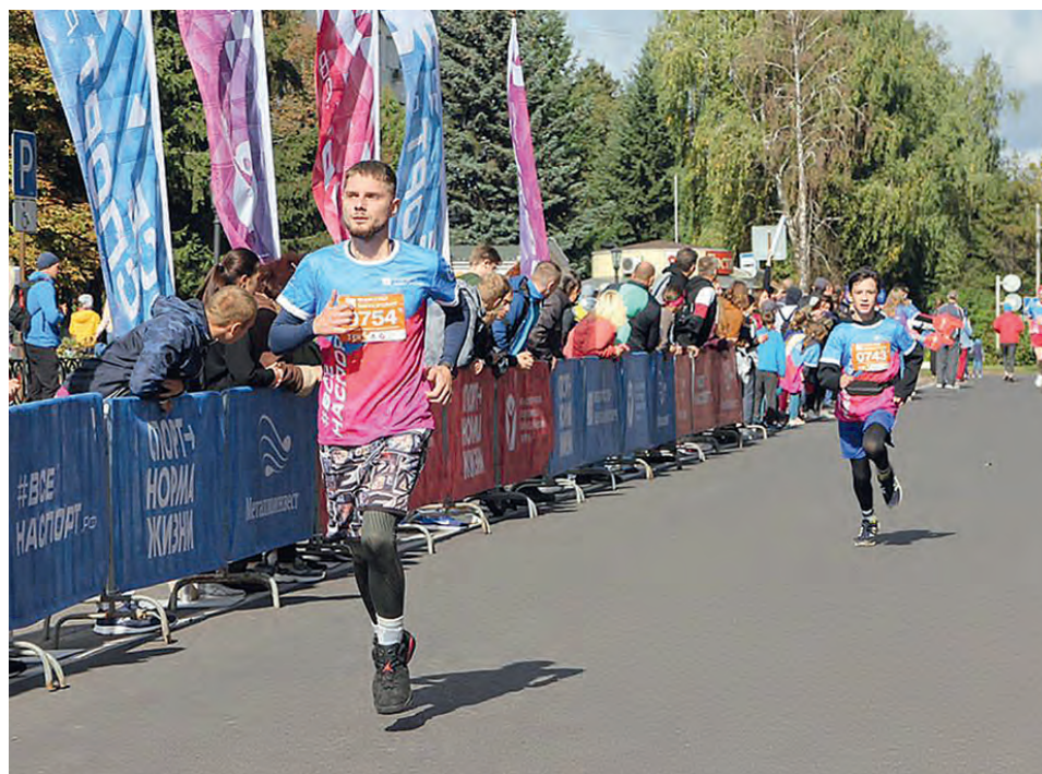
▲ «Металло-Тех» знает, что спорт не воспитывает характер, а выявляет его!

Желаем команде-дебютанту, которая знает, что спорт не воспитывает характер, а выявляет его, лёгких игр и призовых мест!