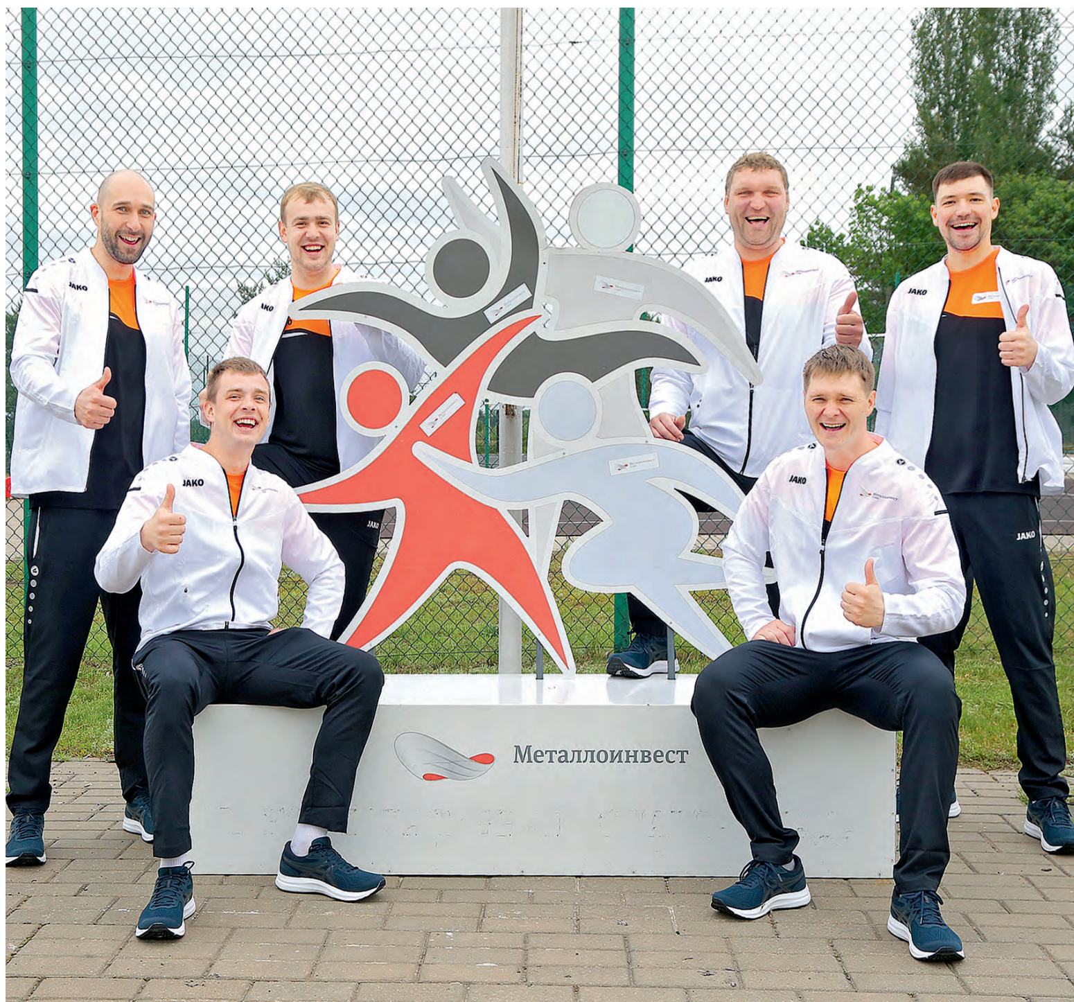
▲ С 10 по 12 июня в Новотроицке соберутся восемь команд из разных регионов: сборные УК «Металлоинвест», Уральской Стали, Лебединского ГОКа, ОЭМК им. А. А. Угарова, Михайловского ГОКа им. А. В. Варичева, Рудостроя, УралМетКома и Металло-Теха. Всего в летней Спартакиаде-2021 участвует порядка 300 человек