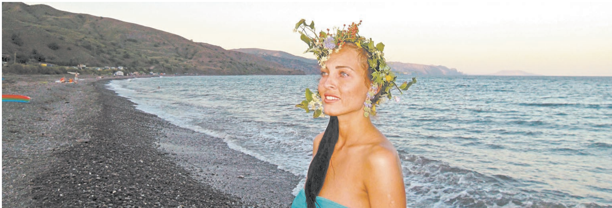
Вот оно — настоящее крымское золото: море, невероятно красивая природа, безумные краски закатов, неизведанность...

Наверное, я еще долго буду засыпать с одной картиной перед глазами: синева морской глади и живописный горный серпантин Крымского полуострова.