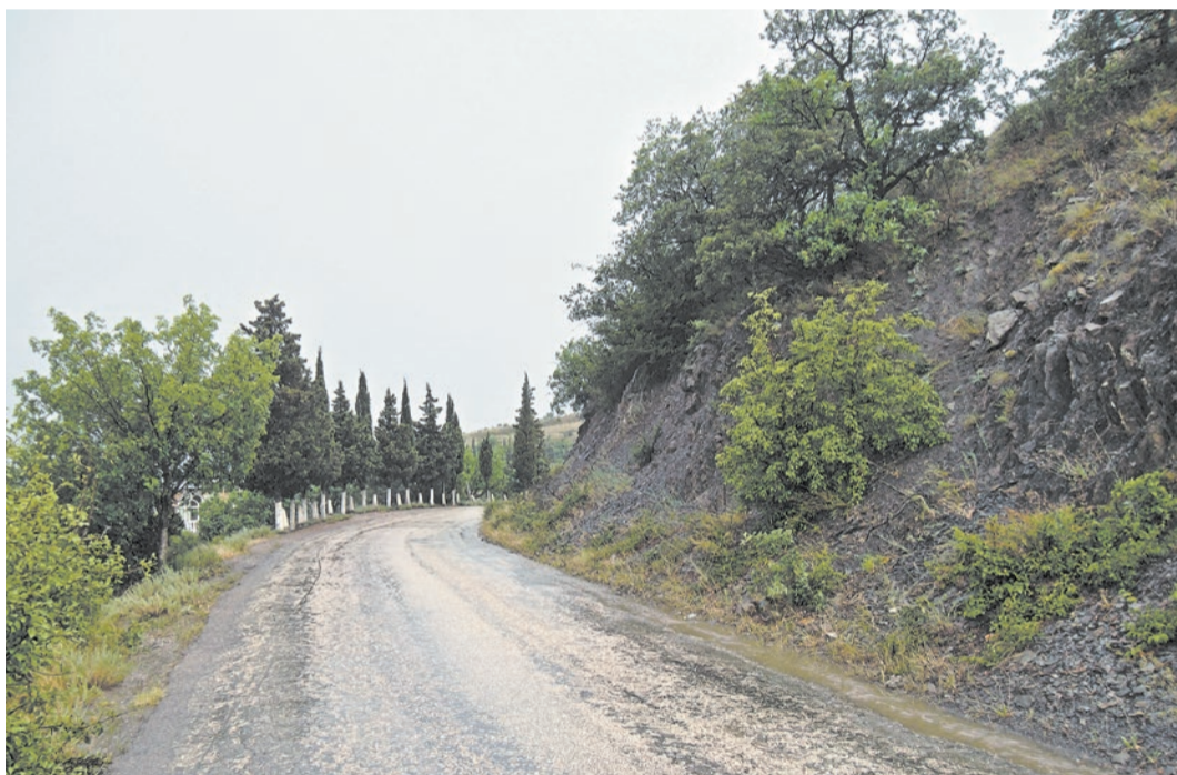
Подбеленные деревья стройными рядами стоят вдоль дороги