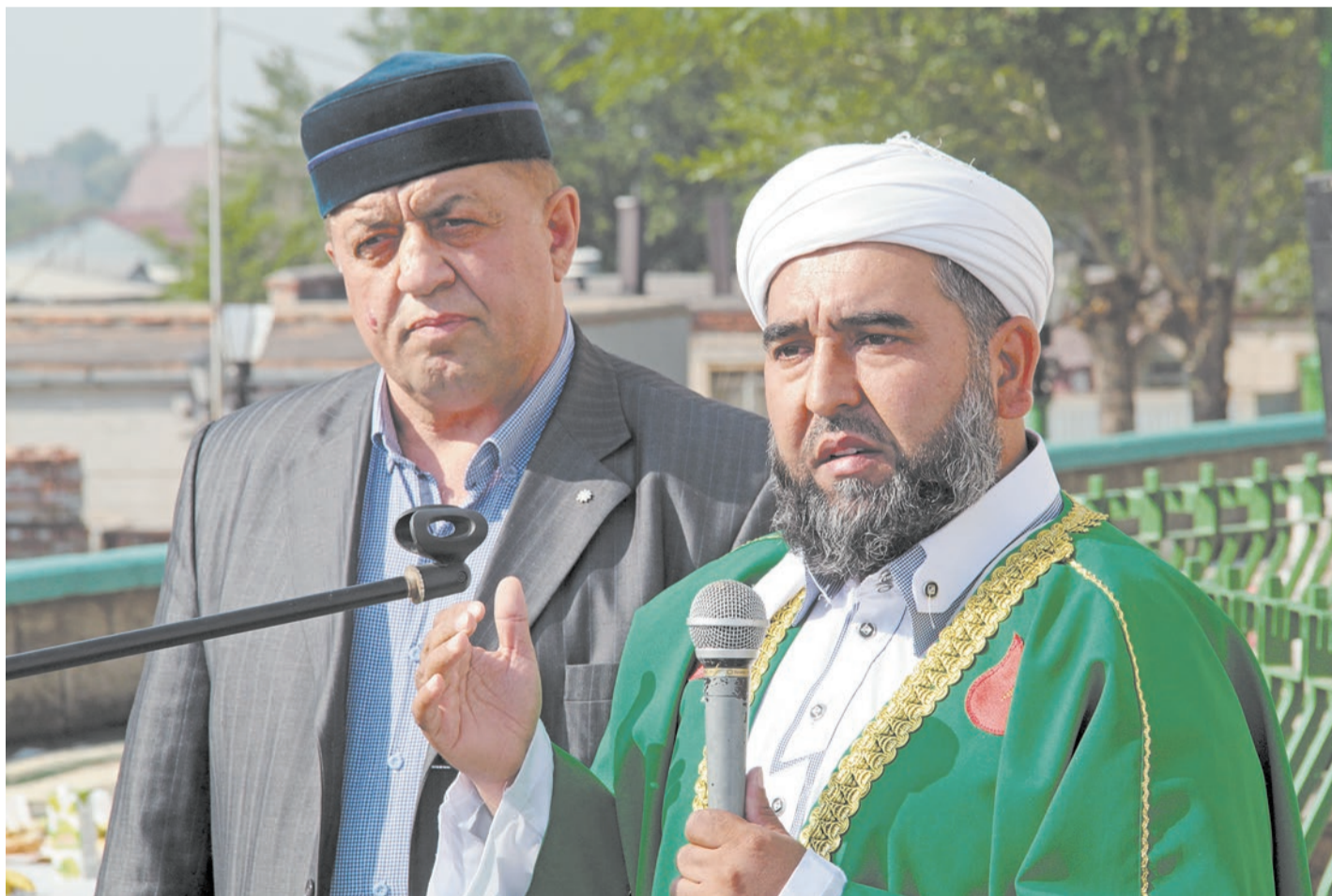
Муфтий новотроицкой соборной мечети поздравил собравшихся с праздником Ураза-байрам

Мусульмане Новотроицка в эти дни вместе с единоверцами всей планеты отпраздновали окончание Рамадана, обязательного ежегодного месячного поста.