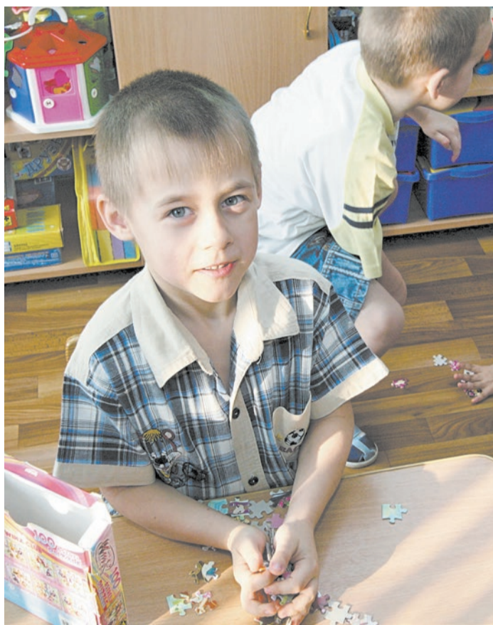
Главная задумка создателей проектов конкурса «Здоровый ребенок» — оздоровление детей дошкольного возраста

Попробовать свои силы в проектной деятельности решились девятнадцать учреждений города. Свои работы они представляли в нескольких номинациях. В «Марафоне здоровья»