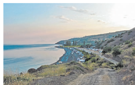
Вдоль берега моря вьется извилистая дорога