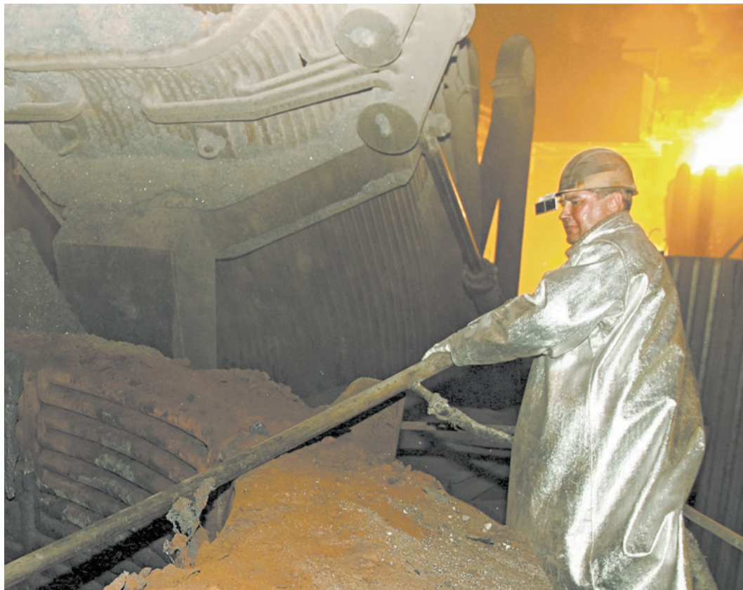
Обработка печи торкрет-массой занимает 10-15 минут

Несмотря на кажущуюся простоту конструкции, агрегат по-своему совершенен. Сухая торкрет-смесь (порошок особого состава) подается из