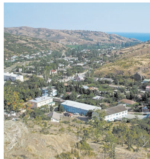
В долине раскинулось село, утопающее в зелени