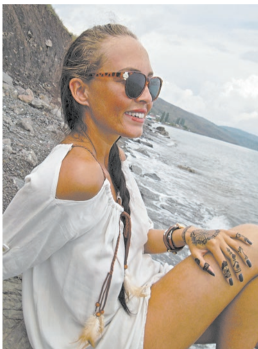
Волны бьются о берег скалистый...

Пляж галечный, камни мокрые и скользкие, поэтому нужно быть предельно аккуратным, чтобы не оказаться с разбитым носом или коленкой. Вода была прозрачной целую неделю, за исключением пасмурных дней. Можно плавать с маской, созерцать каменные рельефы дна, кусты водорослей, похожие на зеленый салат, и даже рыб и маленьких крабиков.