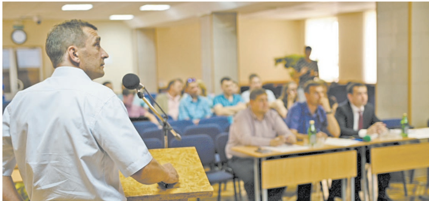
Каждому участнику конкурса на представление проекта давалось три минуты