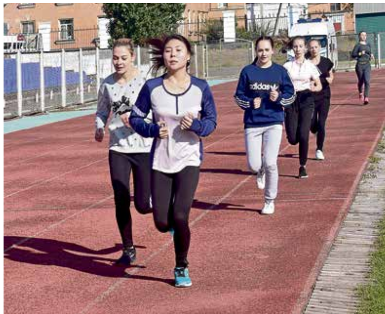
▲ Студенты строительного техникума уже сдали нормы ГТО. Теперь ваша очередь

Вообще, гибкость, вариативность — сильная сторона проекта «Комплекс норм ГТО», возрождённого в нашей стране в 2014 году. Допустим, у вас избыточный вес, из-за которого вы не можете подтянуться на перекладине, да и ко-