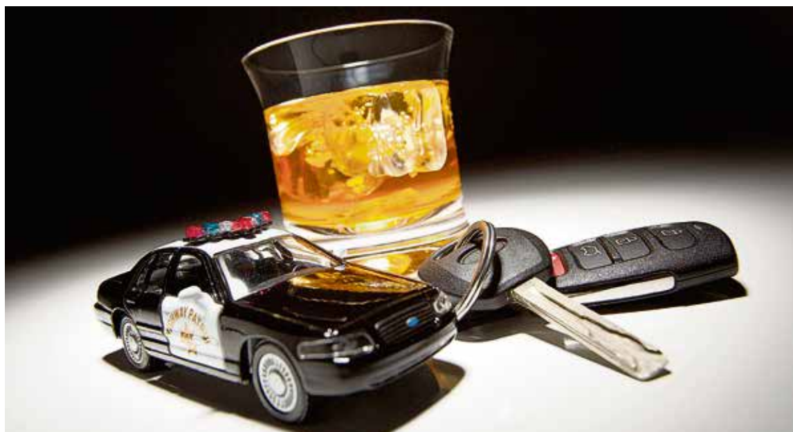
▲ У алкоголя и вождения машины две точки пересечения — крупный штраф и лишение прав