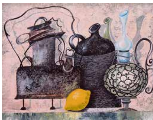
▲ Экспрессионизм от Елены Марковой