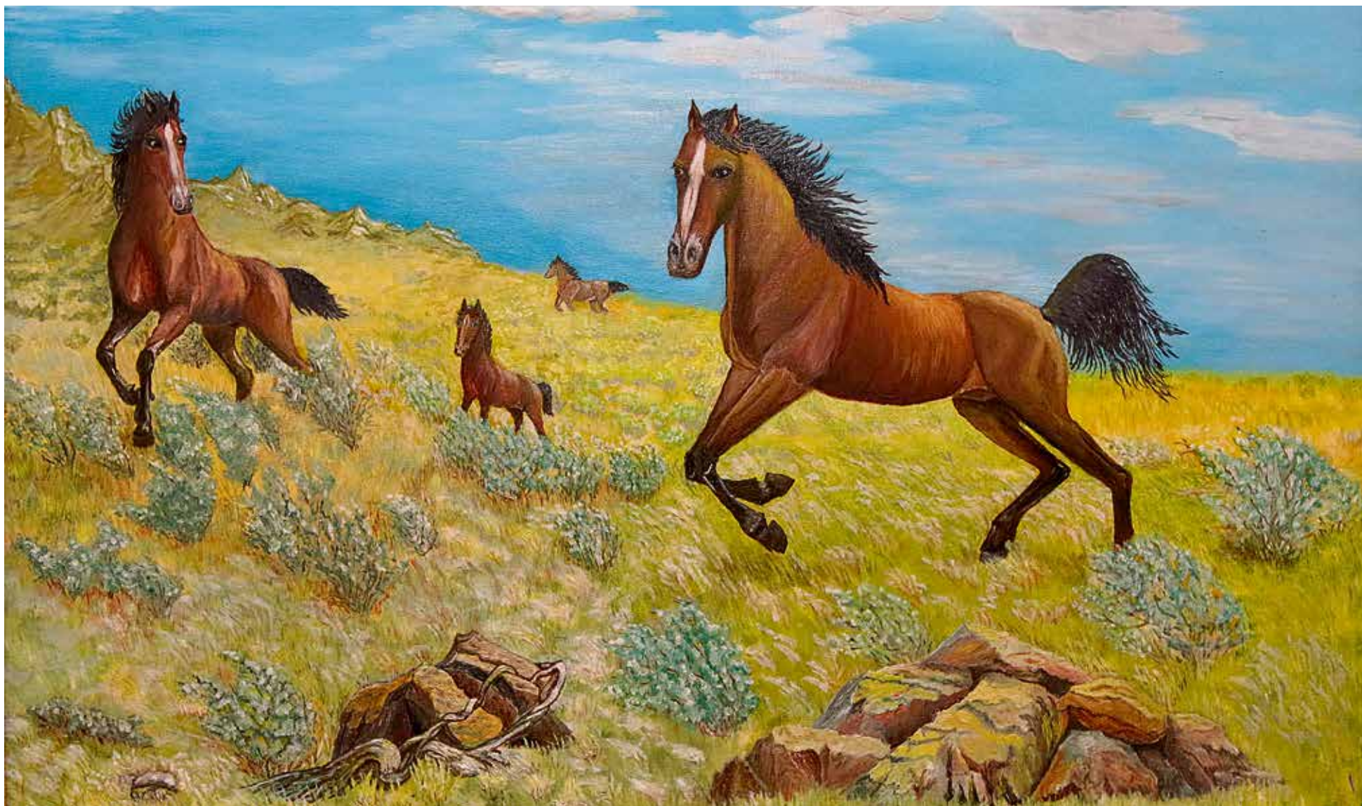
▲ Красавцы кони Раисы Черновой