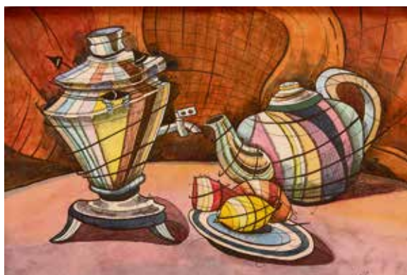
▲ Натюрморт Ильдара Шакирова