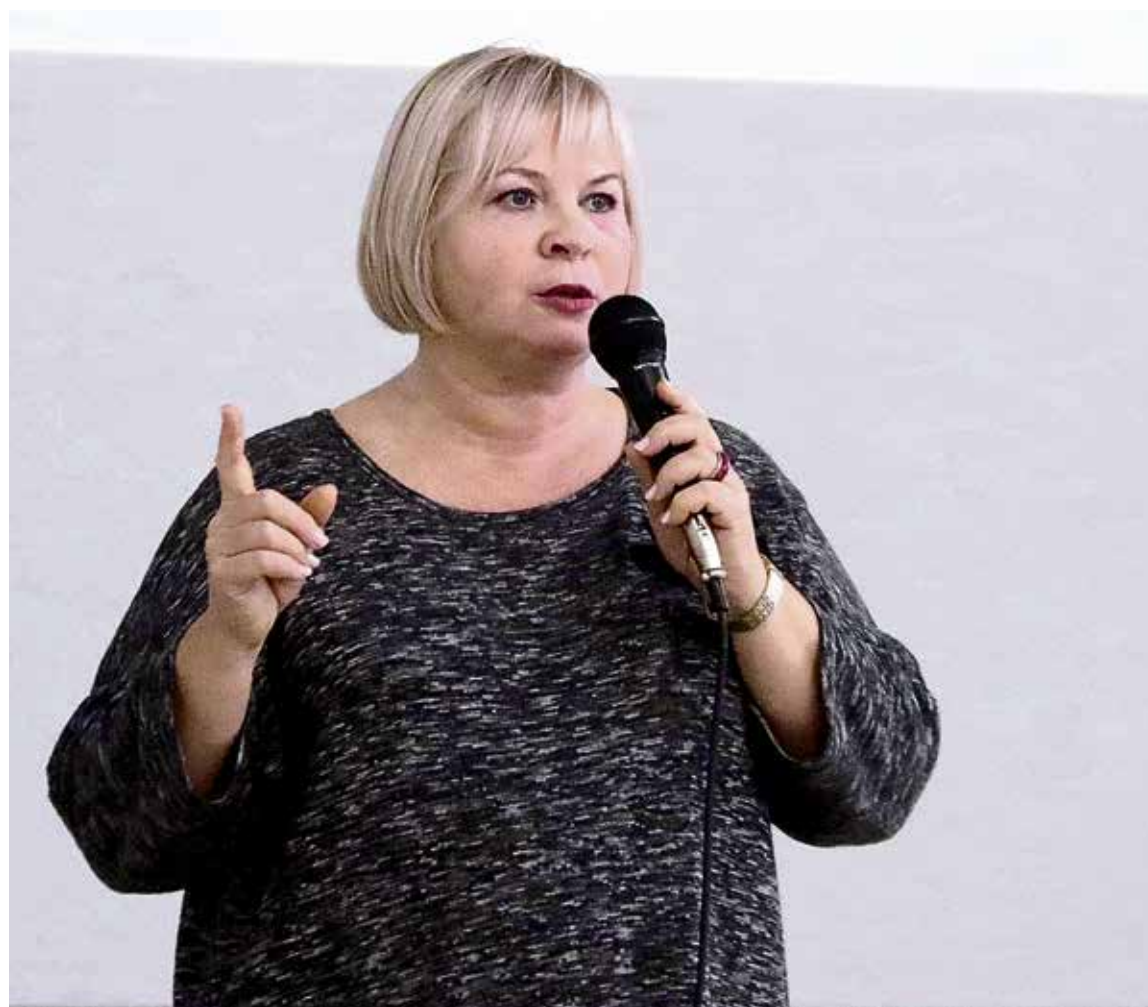
▲ Необходимо вести здоровый образ жизни, закаляться и вакцинироваться