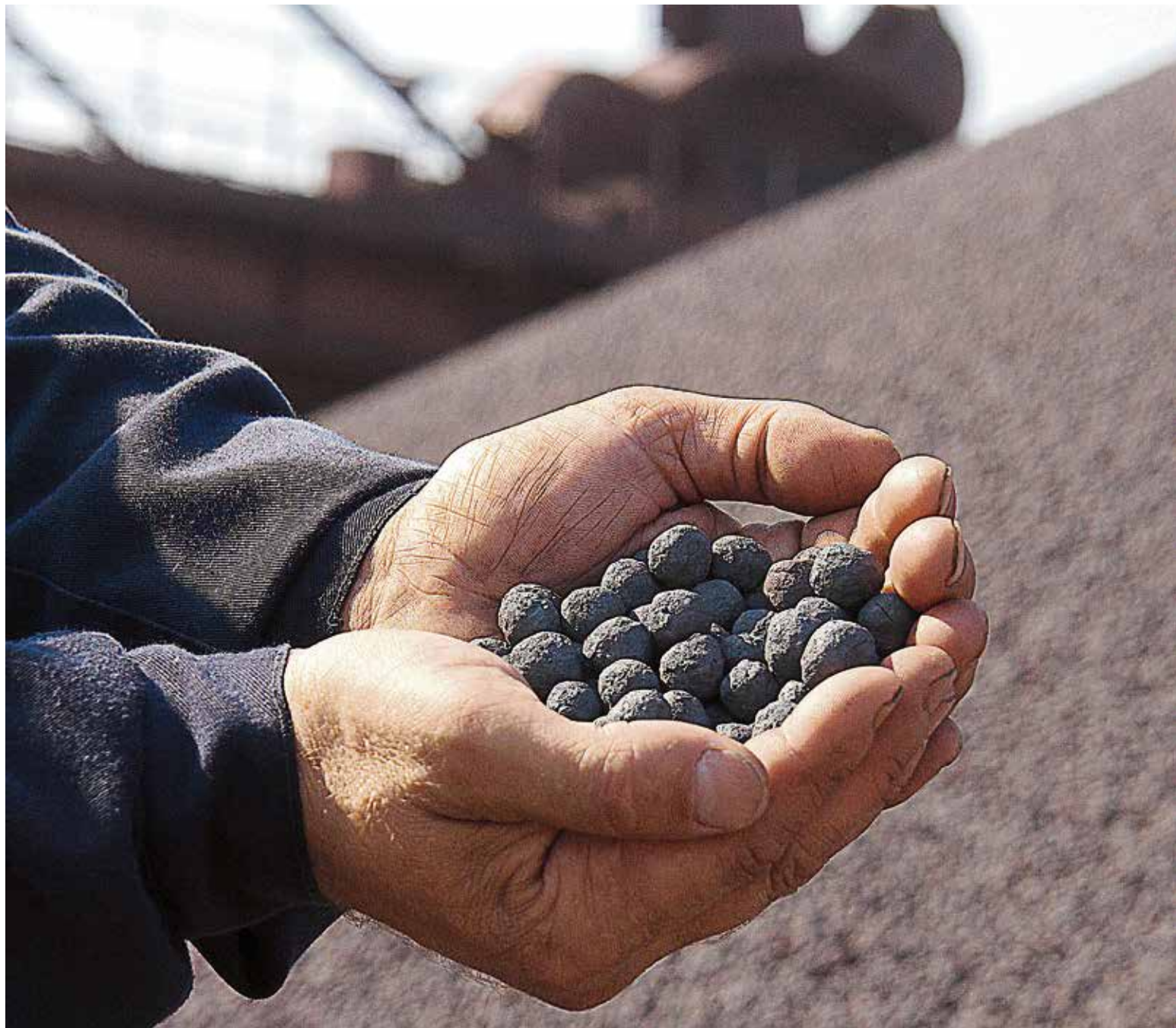
▲ Первые поставки окатышей повышенного качества показывают востребованность продукта ведущими металлургическими компаниями и подтверждают, что продукция Михайловского ГОКа соответствует уровню лучших мировых стандартов