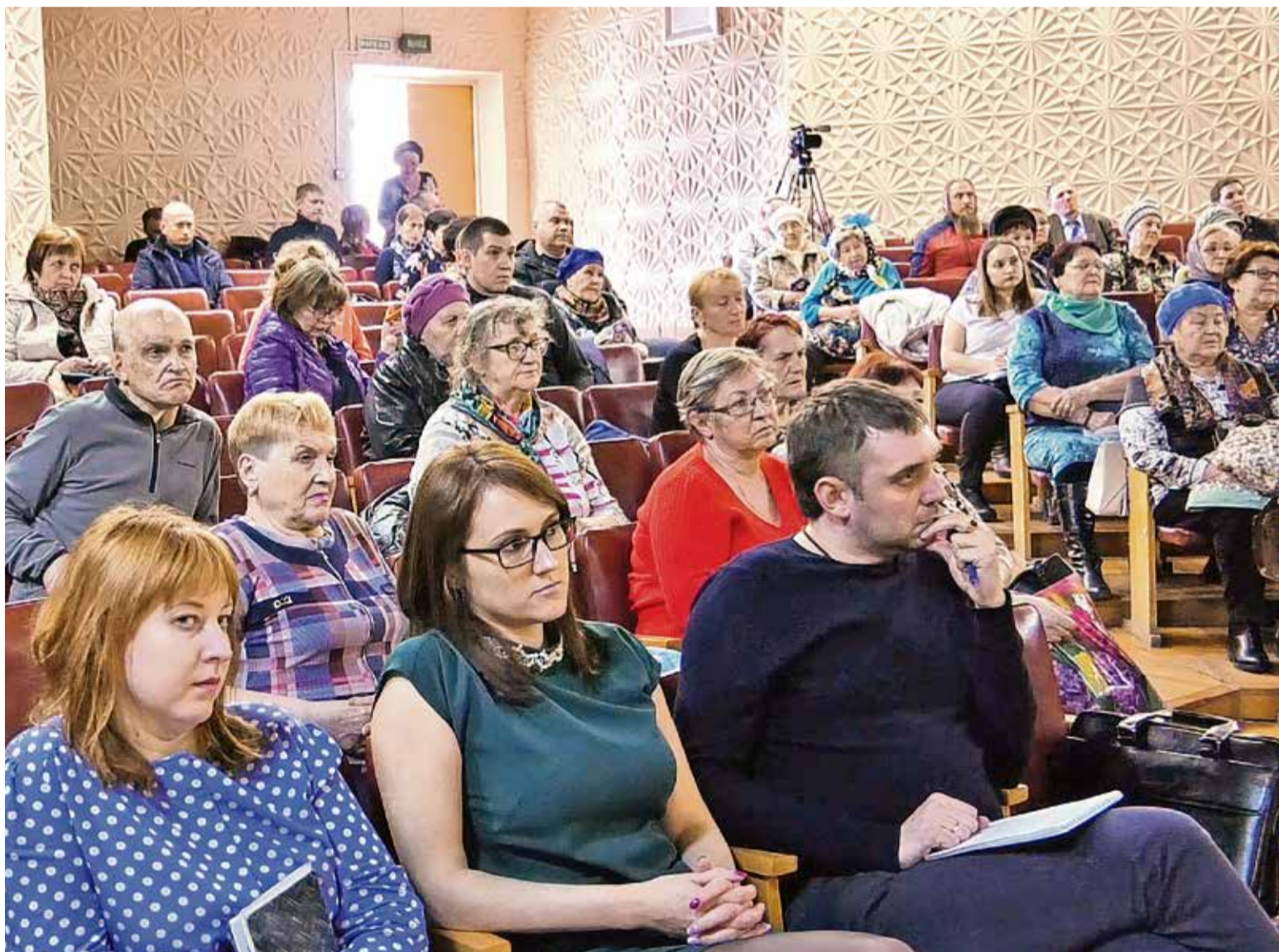
▲ Поговорить о судьбе будущего договора на управление МКД собрались около двухсот человек, среди которых были как старшие домов, так и рядовые собственники