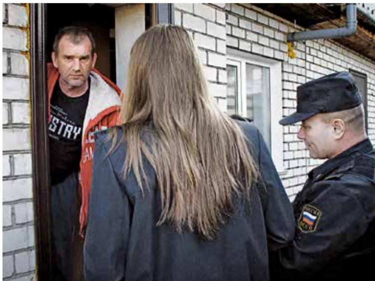
▲ К должникам рано или поздно придут судебные приставы, и тогда неуплата может обернуться арестом

Также полицейские напоминают, что при отсутствии документа, свидетельствующего об уплате административного штрафа, по истечении 30 дней со дня вступления постановления в законную силу предусмотрена административная ответственность по статье 20.25 КоАП РФ «Неуплата административного штрафа, либо самовольное оставление места отбывания административного ареста». В этом случае постановление о неуплате будет направлено в службу судебных приставов для принудительного взыскания.