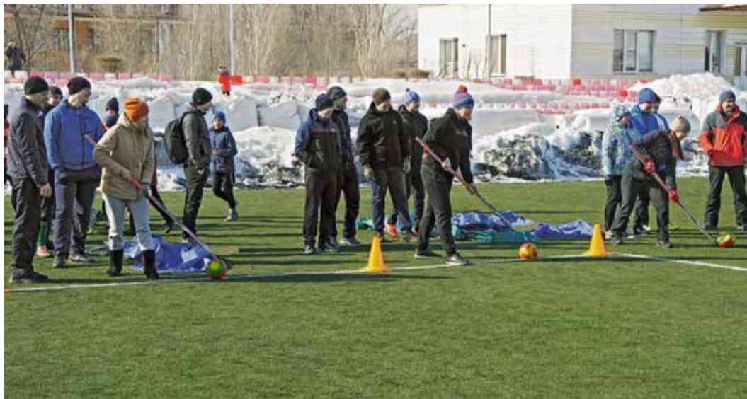
◀ Свежий воздух, адреналин от азарта спортивной борьбы, неформальное общение с коллегами — всё это слагаемые праздничного настроения

Работники листопрокатного цеха № 1 провели спортивную программу, посвящённую 60-летию этого структурного подразделения.