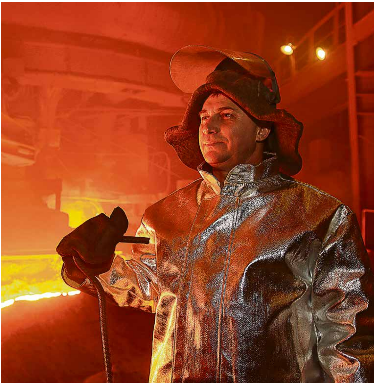
▲ За 65 лет со дня выпуска первого чугуна у доменных печей сменилось несколько поколений металлургов, неизменным осталось одно — высокое качество продукции Уральской Стали