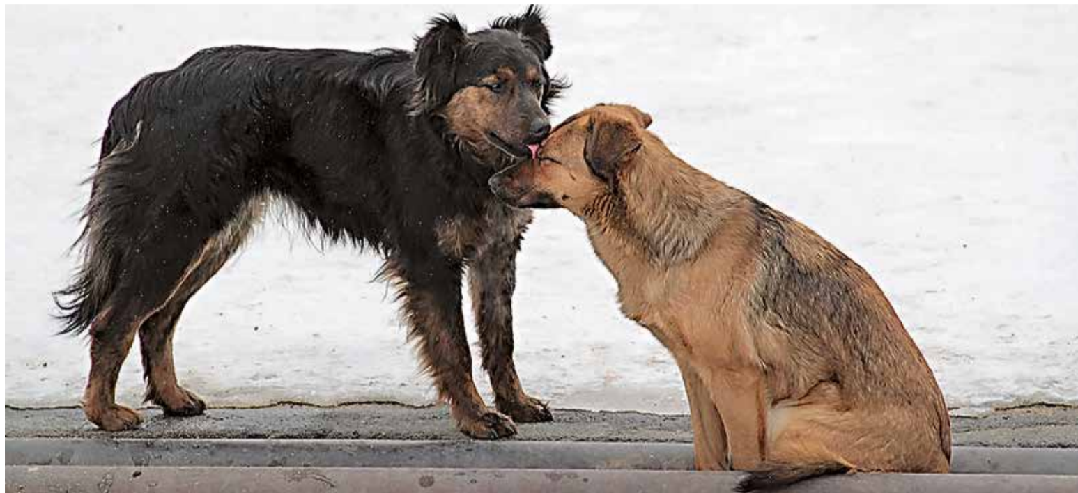
Тщательно прописанной в законах системе гуманного обращения с животными в ближайшее время предстоит пройти проверку реальной жизнью

Нелишними будут фотографии происходящего и доказательства бесхозяйности животного. А также свидетели, способные подтвердить, что ущерб или телесные повреждения находятся в прямой