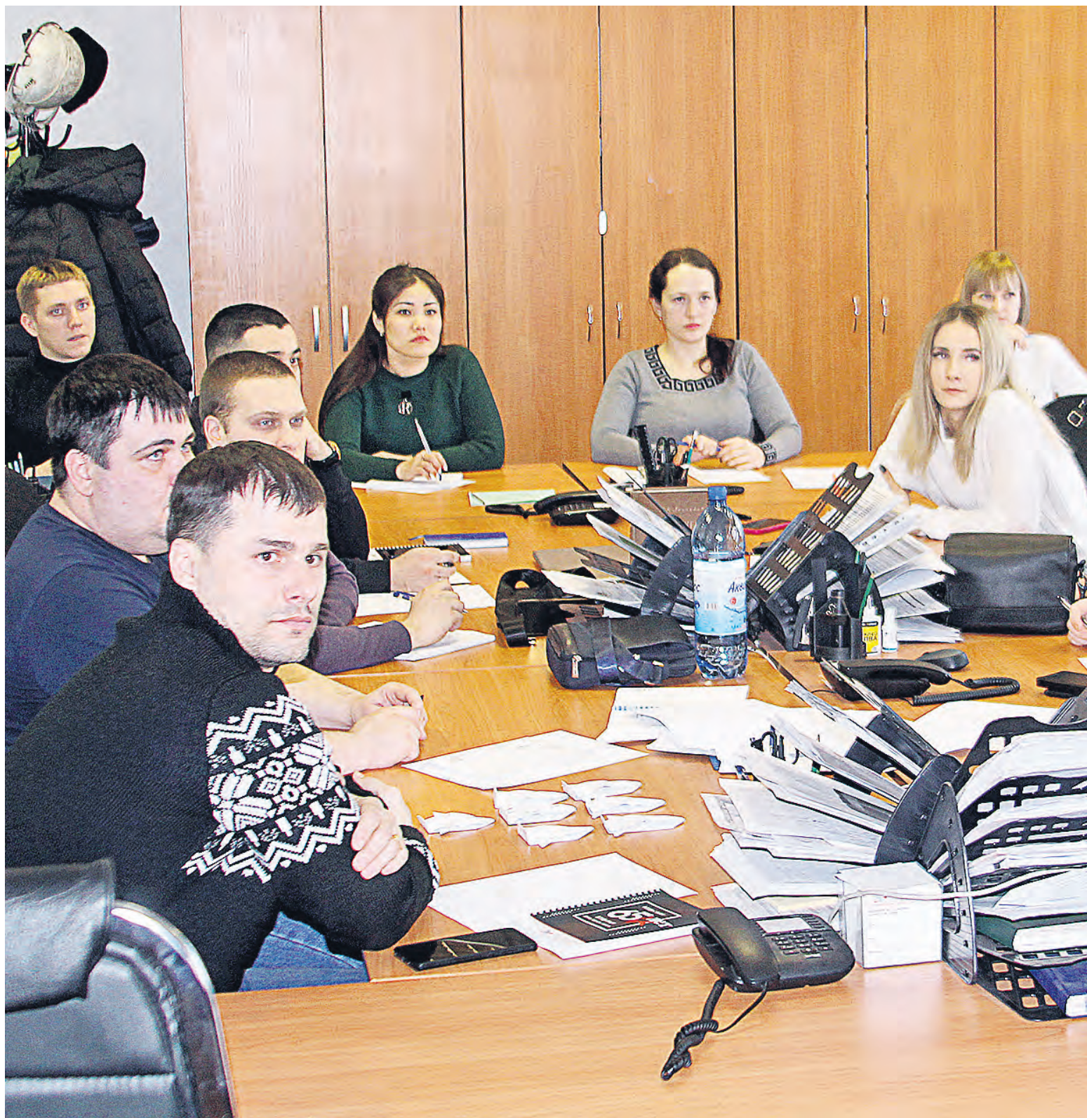
▲ Большинство из отобравшихся в навигаторы третьей волны — молодые специалисты из различных подразделений комбината